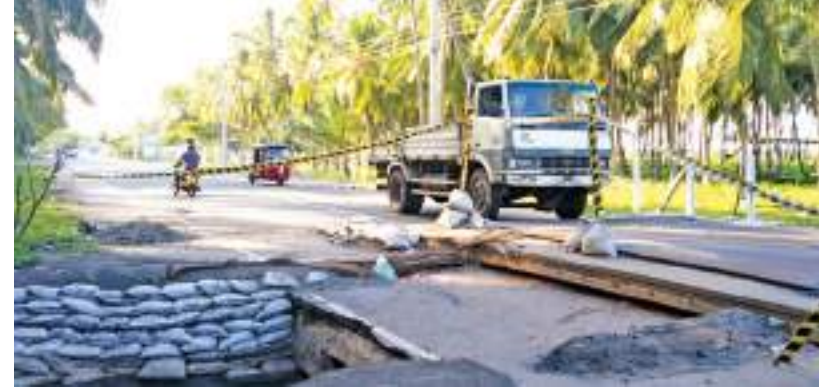
பிரதான வீதியில் நாளாந்தம் கரரக வாகனங்களில் உட்பட நூற்றுக்கணக்கான வாகனங்கள் பயணிக்கின்றன. இதனால், இக் கால்வாய் மேலும் உடையலாமென, பயணிகள் அச்சம்

பாலாவி கற்பிட்டி பிரதான வீதியின் மாம்புரி தேக்கம் தொழிற்சாலைக்கு அருகிலுள்ள சிறிய கால்வாய், சேதமடைந்துள்ளதால், வாகன சாரதிகள் பல சிரமங்களை எதிர்நோக்கியுள்ளனர். கடந்த இரண்டு மாதங்களுக்கு முன்னர், கடும் மழையால் ஏற்பட்ட வெள்ளத்தால், இந்த பிரதான வீதியில் உள்ள சிறிய கால்வாய் பாரிய குழிகள் ஏற்பட்டு உடைந்தது. இயையடுத்து, மண்மேடுகள் அமைக்கப்பட்டதுடன், வாகனங்கள் செல்வதற்கு தற்காலிக வசதிகளும் செய்யப்பட்டிருந்தன. வீதி அபிவிருத்தி அதிகார சபை, இந்த ஏற்பாடுகளைச் செய்திருந்தது. இந்நிலையில், பாலாவி கற்பிட்டி