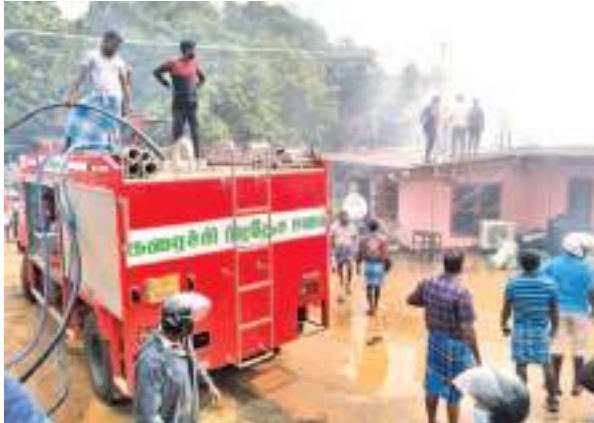
கிளிநொச்சி குறுப் நிருபர்

கிளிநொச்சி சேவியர் கடைச் சந்திக்கருகில் இயங்கி வந்த அமுதகடல் கட்டட பொருட்கள் விற்பனை நிலையத்தில் நேற்று (02) காலை 9.30 மணியளவில் இடம்பெற்ற பாரிய தீ அனர்த்தம் காரணமாக கோடிக்க