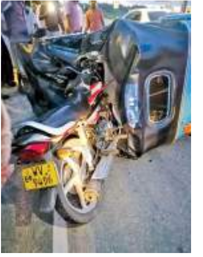
நேர் மோதி இந்த விபத்து சம்பவத்துள்ளது.

அக்கரைப்பற்று கல்முனை பிரதான வீதியில் நித்தலூர் பொலிஸ் பிரிவுக்குட்பட்ட நித்தலூர் வெட்டுவாய்க்கால் காரைதீவு எல்லையில் முச்சக்கர வண்டியுடன் மோட்டார் சைக்கிள் ஒன்று விபத்துக்குள்ளானதில் சிறுமி ஒருவர் பலத்த காயமடைந்து வைத்தியசாலையில் அனுமதிக்கப்பட்டுள்ளார்.