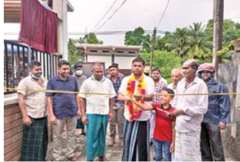
அநுராதபுர மாவட்ட பாராளுமன்ற உறுப்பினர் இஷாக் ரஹ்மானின் நிதியோதுக்கீட்டில், புனர்நிரமாணம் செய்யப்பட்ட கலாவை கப்பல்கம குறுக்குத்தெரு நேற்றுமுன்தினம் (01) பாராளுமன்ற உறுப்பினர் இஷாக் ரஹ்மானால் உத்தியோகபூர்வமாக திறந்து வைக்கப்பட்ட போது பிடிக்கப்பட்ட படம்.