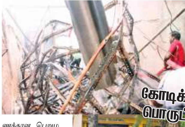
கிளிநொச்சி குறுப் நிருபர்

ள எரிந்து அழிந்துள்ளன. மின்சார ஒழுக்கு காரணமாக தீ ஏற்பட்டிருக்கலாம் என சந்தேகிக்கப்படுகிறது. சம்பவ இடத்திற்கு கரைச்சி பிரதேச சபையின் தீ அணைப்பு பிரிவினர் சென்று தீயினை 11 மணியளவில் முழுமையாக கட்டுப்படுத்தி