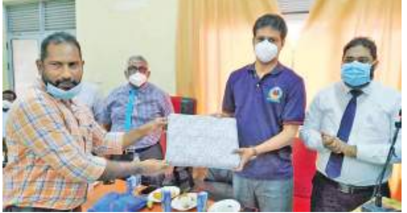
மருதமுனை பிரதேச வைத்தியசாலையும் கொரோனா தொற்றாளர்களுக்கு சிகிச்சையளிக்கும் மத்திய நிலையமாக மாற்றப்பட்டு கிழக்கு மக்களாக இருக்கின்ற சுகாதார பராமரிப்பு நிலையத்திற்கு இடமாற்றம் செய்யப்பட்டது. எனினும் தற்போது கல்முனை பிராந்திய சுகாதார சேவைகள் பணிப்பாளர் அலுவலகத்திற்குட்பட்ட பகுதிகளில் கொரோனா தொற்றாளர்களின் எண்ணிக்கை குறைவடைந்து சுகமமான நிலை ஏற்பட்டுள்ளது. இதனையடுத்து மருதமுனை பிரதேச வைத்தியசாலையின் சேவைகளை மீள ஆரம்பித்து வைக்கும் நடவடிக்கை முன்னெடுக்கப்பட்டது.

கொரோனா தொற்றாளர்களின் எண்ணிக்கை தீவிரமாக அதிகரித்ததை அடுத்து கல்முனைப் பிராந்தியத்தின் சில வைத்தியசாலைகள் கட்டத் வரும் கொரோனா தொற்றாளர்களை பராமரிக்கும் நிலையங்களை மாற்றப்பட்டது.