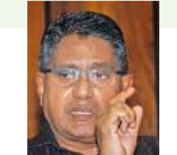
பொலிஸ் மற்றும் பிரதேச சபையின் உதவியை ஆளுநர் கோரியுள்ளார். 06

தியாகராஜா பணிப்புரை விடுத்துள்ளார். வடமாகாணத்தில் சுற்றாடல் பாதுகாப்பு மற்றும் பாதுகாப்பு வேலைத்திட்டங்களை நியம விதிகளுக்கு அமைவாக நடைமுறைப் படுத்துமாறு வடமாகாண ஆளுநர் ஜீவன் தியாகராஜா வடமாகாண அதிகாரிகளுக்கு பணிப்புரை விடுத்துள்ளார். சுற்றாடல் பாதுகாப்பு மற்றும் பாதுகாப்பு வேலைத்திட்டத்தை விசேட வேலைத்திட்டமாக கருதுவதற்கு