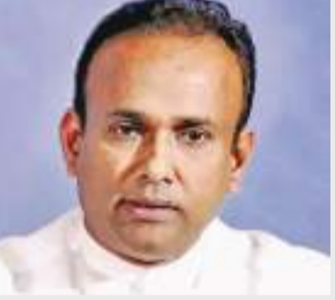
இது தொடர்பில் அடுத்த வாரம் நிதி அமைச்சின் செயலாளர் மற்றும் மத்திய வங்கி ஆளுநருடன் ஆராயவுள்ளதாகவும் அவர் குறிப்பிட்டார்.