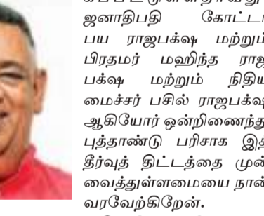
கப்பட்டுள்ளதாவது, ஜனாதிபதி கோட்டாபய ராஜபக்சு மற்றும் பிரதமர் மஹிந்த ராஜபக்சு மற்றும் நிதியமைச்சர் பசில் ராஜபக்சு ஆகியோர் ஒன்றிணைந்து புத்தாண்டு பரிசாக இத்தீர்வுத் திட்டத்தை முன்வைத்துள்ளமையை நான் வரவேற்கிறேன். கொரோனாவின் தாக்கத்தை வெற்றிகொண்டு நாட்டின் அபிவிருத்திப் பணிகளையும் இடைவெளியில் செய்வதற்கு வந்த இன்றைய அரசாங்கம், தற்போது இடக்குமதிப் பொருட்கள் மற்றும் மருந்துப் 06