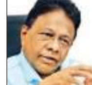
சுசில் பிரேமஜயந்த் நீக்கப்பட்டது தொடர்பில்

குற்றச்சாட்டை மறுக்கிறார் அமைச்சர் டளஸ் ஊம்ஸ் பாஹிம் அரசாங்கத்தை விமர்சித்ததால் இராஜாங்க அமைச்சர் பதவியிலிருந்து சுசில் பிரேமஜயந்த் நீக்கப்பட்டதாக தெரிவிக்கப்படும் குற்றச்சாட்டை மறுப்பதாக தெரிவித்த அமைச்சரவை பேச்சாளர் டளஸ் அழகப்பெரும, அவர் நீக்கப்படுவது தொடர்பில் அமைச்சரவையில் ஆராயப்படவில்லை எனவும் தெரிவித்தார். இராஜாங்க அமைச்சர் குற்றச்சாட்டை மறுப்பதாக தெரிவித்த சுசில் பிரேமஜயந்த் நீக்கப்பட்டது தொடர்பில்