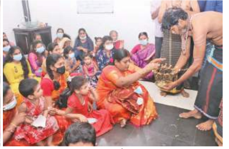
ஆதி ஜயப்ப தீர்த்த யாத்திரை மன்றம் ஸ்ரீ ஜஸ்வர்ய ஜய்யப்பன் ஷேத்திரம் நடத்திய மஹா மண்டல பூஜையுடன் ஸ்ரீ கருப்பன் சுவாமி பூஜையுடன் அண்மையில் கொழும்பு ஜிந்துப்பிட்டி கன்னார தெருவில் அமைந்துள்ள ஆதி ஜயப்ப தீர்த்த யாத்திரை மண்டலத்தில் நடைபெற்ற போது...