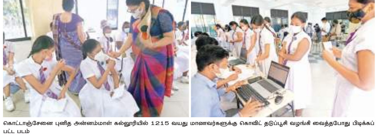
கொடாட்சேனை புனித அன்னம்மாள் கல்லூரியில் 1215 வயது மாணவர்களுக்கு கொவிட் தடுப்பூசி வழங்கி வைத்தபோது பிடிக்கப்பட்ட படம்