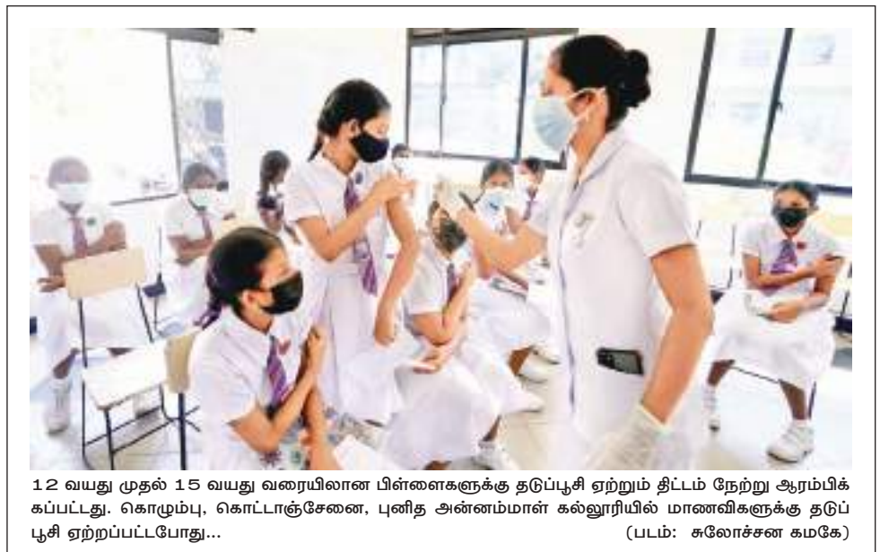
12 வயது முதல் 15 வயது வரையிலான பிள்ளைகளுக்கு தடுப்பூசி ஏற்று திட்டம் நேற்று ஆரம்பிக்கப்பட்டது. கொழும்பு, கொட்டாச்சேனை, புனித அன்மம்மாள் கல்லூரியில் மாணவிகளுக்கு தடுப்பூசி ஏற்றப்பட்டபோது... (படம்: சுனோசன் கமகே)

பாரிய பொருளாதார நெருக்கடிக்கு மத்தியிலும் அரச துறைக்கு நீதி வழங்க அரசு பின்னிடுகவில்லை இதுவொரு சாதனை என்கிறார் அமைச்சர் டாள் 03