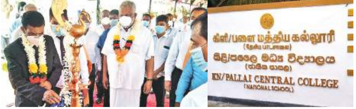
கிளிநொச்சி குறாப், பரந்தன் குறாப் நிருபர்கள்

கிளிநொச்சி பளை மத்திய கல்லூரி தேசிய பாடசாலையாக அங்குரார்ப்பணம் செய்யப்பட்டது. ஜனாதிபதியின் நாட்டை கட்டி யெழுப்பும் சுபீட்சத்தின் நோக்கு வேலைத்திட்டத்துக்கு அமைய பளை மத்திய கல்லூரி தேசிய பாட சாலையாக அங்குரார்ப்பணம் செய்