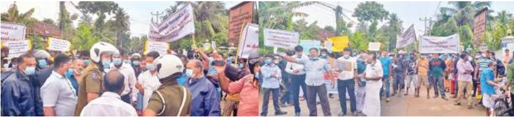
பருத்தித்துறை விசேட, யாழ்.விசேட நிருபர்கள்

இந்திய மீனவர்களின் அத்துமீறல் களை கண்டித்து யாழ்ப்பாணம் சண்டி லிப்பாப் பிரதேச செயலகம் முன்பாக வீதியை மறித்து போராட்டம் ஒன்று முன்னெடுக்கப்பட்டது. யாழ்.மாவட்ட கடந்தொழிபா ளர்கள் கூட்டுறவு சம்மேளனமும், மாதகல் பிரதேச கடந்தொழிபா ளர்கள்