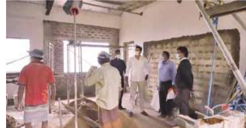
தருமாறு அதிபர், ஆசிரியர்கள் பெற்றோர்கள் மற்றும் மாணவர்கள் முன்வைத்த கோரிக்கையை ஏற்று, இரண்டாம் மாடிக் கட்டடம்

செந்தில் தொண்டமான் நிதி ஒதுக்கீட்டில் நிர்மாணிக்கப்பட்டுவரும் கட்டடத்தின் தரை தளம் மற்றும் முதலாம் மாடியின் நிர்மாணப்பணி நிறைவடைந்ததைத் தொடர்ந்து, இரண்டாவது மாடியை நிர்மாணிக்க 11.6 மில்லியன் நிதி ஒதுக்கீடு செய்யப்பட்டுள்ளது. கம்பஹா பாடசாலையில் மாணவர்களின் எண்ணிக்கை அதிகரித்துள்ளதாலும், வகுப்பறைகள் பற்றாக்குறையாலும் மேலதிக மாடிகளை அமைத்து