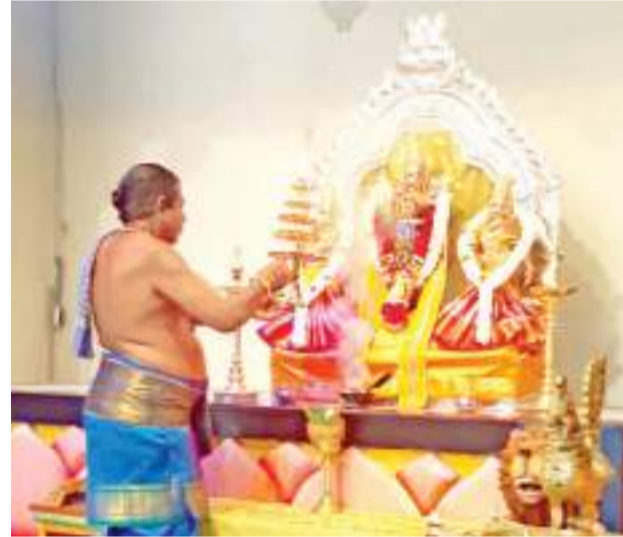
உப்பு ஸ்ரீமணிக்மணி சத்தியபாமா சமேத ஸ்ரீபார்த்தசாரதிப் பெருமான் திரௌபதையம்மன் ஆலயத்தின் வருடாந்த பிரமோற்சவ உட்கொடியேற்றம் புதன்கிழமை (5)நண்பகல் 12மணியளவில் இடம்பெற்றது. இதில் பொது மக்கள் கலந்து கொண்டு பெருமானின் அருளைப் பெற்றுக் கொண்டனர். (படங்கள்: உப்பு குறுப் நிருபர்)

களைச் சேர்த்து வைத்தால் என்ன? இது இறை சக்தியைக் குறைக்கும். அங்கு ஆன்மீக அதிர்வுகள் ஏற்படாது. மிகக் குறைந்த பூஜைக்கு பொருட்களை மட்டும் வைத்துக் கொள்ளுவது நல்லது. 18821) எந்த நாட்களில் வாசலில் கோலம் போடக்கூடாது? அமாவாசை, திவசம் ஆகிய நாட்களில் 18822) எந்த நாட்களில் எண்ணெய் தேய்த்துக் குவிக்க கூடாது? அமாவாசை, பெளர்ணமி, மாதப்பிறப்பு, ஜன்ம நட்சத்திரம் ஆகிய தினங்களில் 18823) தொதுவாக நெற்றிக்கு திலகமிடாமல் பூஜை செய்யலாமா? கூடாது. 18824) பெண்கள் பூசணிக்காய் உடைக்கலாமா? கூடாது. 18825) இரு கைகளால் தலையை சொரியலாமா? ஆகாது. 18826) கர்ப்பிணி பெண்கள் தேங்காய் உடைக்கலாமா? கூடாது. 18827) மற்றவர்கள் தேங்காய் உடைக்கும் இடத்தில் இருக்கலாமா? வேண்டாம். 18828) சாமி படங்களுக்கு வாசனை இல்லாத பூக்களைக் குடலாமா? கூடாது.