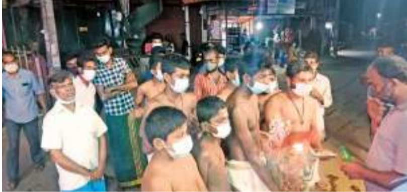
புசல்வாவை தினகரன் நிருபர்

மார்கழி பஜனை மலையகப் பகுதிகளில் அருகி வருகிறது. தோட்டப் புறங்களிலிருந்து நகர்ப்புறங்களை நோக்கி குடியேறியவர்கள் நகர்ப்பகுதிகளிலும் மார்கழி பஜனை நிகழ்வை நடத்தி வந்தமை குறிப்பிடத்தக்கது. ஆனால் கால ஒட்டத்தில் நகர்ப்பகுதிகளில் கைவிடப்பட்டு நகரை அண்மித்த பஜனைக்குழுவினர் இடைக்கிடையே நகர்ப்பகுதிக்கு வருகை