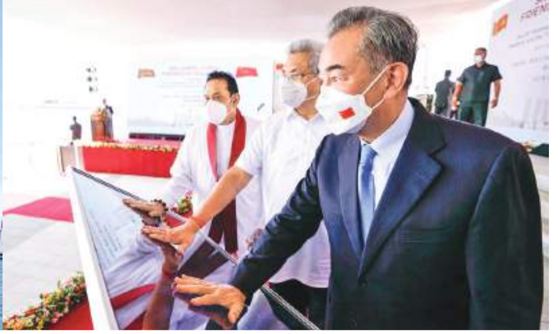
இலங்கைக்கு விஜயம் மேற்கொண்ட சீன மக்கள் குடியரசின் வெளிவிவகார அமைச்சர் வெங்கட் யீ, ஜனாதிபதி கோட்டாபய ராஜபக்ஷ மற்றும் பிரதமர் மஹிந்த ராஜபக்ஷ ஆகியோர் துறைமுக நகர நடைபாதை மற்றும் படகத் தளம் என்பவற்றை திறந்து வைப்பதையும் துறைமுக நகரின் எழில்மிகு தோற்றத்தையும் படங்களில் காணலாம்.