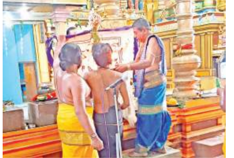
உப்பு ஸ்ரீமணிக்மணி சத்தியபாமா சமேத ஸ்ரீபார்த்தசாரதிப் பெருமான் திரௌபதையம்மன் ஆலயத்தின் வருடாந்த பிரமோற்சவ உட்கொடியேற்றம் புதன்கிழமை (5)நண்பகல் 12மணியளவில் இடம்பெற்றது. இதில் பொது மக்கள் கலந்து கொண்டு பெருமானின் அருளைப் பெற்றுக் கொண்டனர்.