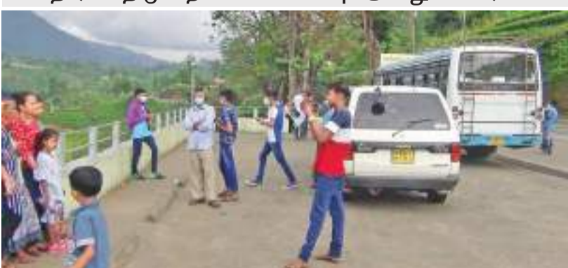
ஹட்டன் விசேட நிருபர்

சுகாதார விதிமுறைகளை கடைபிடிக்குமானும் கோரிக்கை