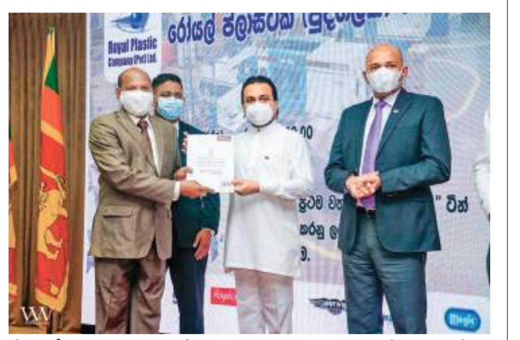
புதிய முதலீட்டாளர்களுக்கு கைத்தொழில் அமைச்சுக்குச் சொந்தமான கைத்தொழில் பேட்டைகளிலுள்ள காணிகளை கையளிக்கும் நிகழ்வு கொழும்பு பண்டாரநாயக்க ஞாயிற்றுக்கிழமை மாநாட்டு மண்டபத்தில் நடைபெற்றது. கைத்தொழில் அமைச்சர் விமல் வீரவங்ச பிரதம அதிநாயக்க கலந்து கொண்டு அவற்றை வழங்கி வைப்பதை காணலாம்.

இவர்கள் அனைவரும் அரச பாடசாலைகள் மற்றும் அரச நினைக்காங்களை, அரச காரியாலயங்கள் ஆகியவற்றுக்கு இணைக்கப்பட்டுள்ளனர்.