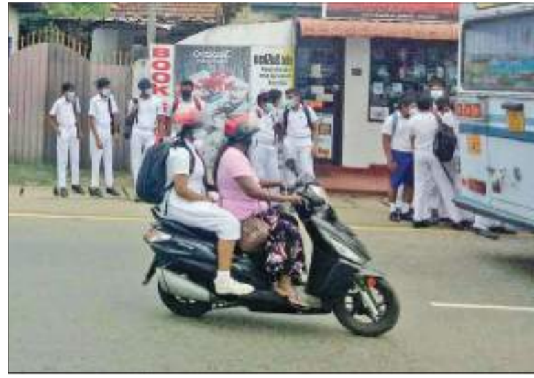
பாடசாலைகள் நேற்று முதல் வழமைக்கு திரும்பியுள்ள நிலையில் பாடசாலை செல்வதற்காக மாணவர்கள் பஸ்ஸிற்கு காத்திருப்பதை படத்தில் காணலாம்.