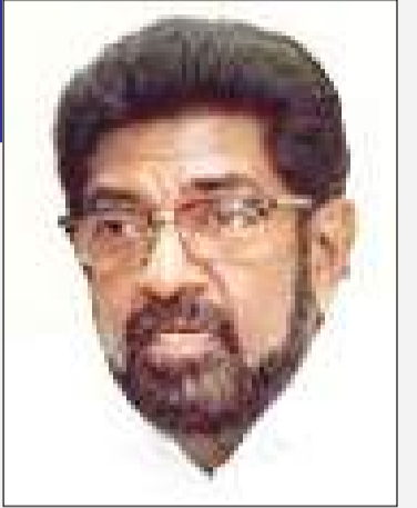
குறித்து ஜனாதிபதியுடன் கலந்துரையாடியதாகவும் அமைச்சர் மேலும் தெரிவித்தார்.

இடம்பெறபோவதில்லை என அமைச்சர் உறுதியளித்தார். நாட்டில் அன்னிய சொலாவணி பிரச்சினை இருப்பது உண்மைதான். ஆனால் மருந்து தட்டுப்பாடு அபாயம் இல்லை, என தெரிவித்த அமைச்சர் நாட்டில் மருந்துப்பொருள் தட்டுப்பாடு ஏற்படாமல் பார்த்துக் கொள்ள வேண்டிய பொறுப்பு அரசாங்கத்திற்கு இருப்பதாகவும், அவ்வாறான நிலைமையை தடுக்க ஏடுக்க வேண்டிய நடவடிக்கைகள்