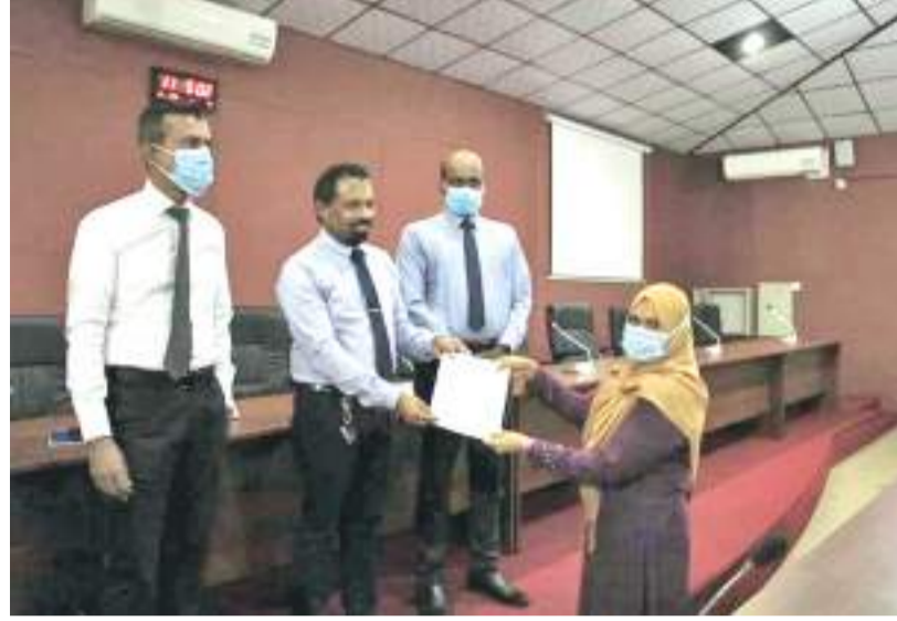
காணப்படுகின்றது. கிடைக்கப் பெற்ற நியமனத்தை சரியாகவும் நேர்த்தியாகவும் மேற்கொள்ளல்

அவர் தொடர்ந்தும் தெரிவிக்கையில், அரச சேவையில் நியமனம் என்பது எல்லோருக்கும் கிடைக்கப் பெறாத ஒரு விடயமாக