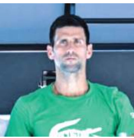
பெரிய பகிரங்க போட்டிகளில் 21 ஆம் முறை வெற்றிபெற்று சாதனை படைப்பதற்கான வாய்ப்பில்லாமல் போகக்கூடும். பார்வையாளர்களின் எண்ணிக்கை பாதிக்கக் குறைப்பு அவுஸ்திரேலியப் பகிரங்க

அவுஸ்திரேலியப் பிரதமர் ஸ்காட் மோரிசன், செர்பிய டென்னிஸ் நட்சத்திரம் நோவாக் ஜோகோவிச்சின் விசா நிலையைப் பற்றிக் கருத்துத் தெரிவிக்க மறுத்துள்ளார். அதுபற்றிக் குடிவரவு அமைச்சர் முடிவெடுப்பார் என்று பிரதமர் மோரிசன் கூறினார். அந்நாட்டு அரசாங்கம் ஜோகோவிச்சின் விசாவை இரண்டாம் முறையாக இரத்து செய்யுமா என்பது குறித்துக் குழப்பம் எழுந்துள்ளது. அவுஸ்திரேலியப் பகிரங்க டென்னிஸ் போட்டியின் ஆட்ட விவரங்களின் பட்டியலில் அவரின் பெயர் இடம்பெற்றுள்ளது. இதற்கிடையே குடிநூழைவு அமைச்சர் அலெக்ஸ் ஹாக் ஜோகோவிச்சின் விசாவை மீண்டும் இரத்து செய்வது குறித்து யோசித்து வருவதாகத் தெரிவிக்கப்பட்டது. அவ்வாறு அவரின் விசா இரத்து செய்யப்பட்டால், ஜோகோவிச்