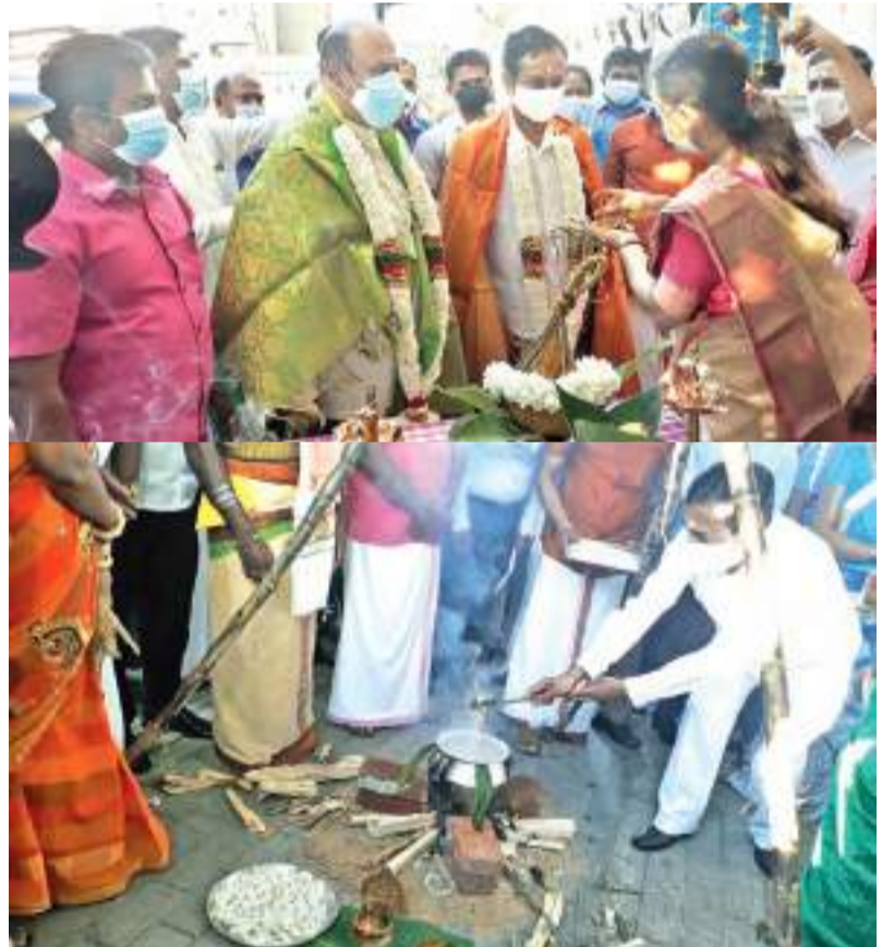
கண்டி மாநகர சபையின் தமிழ் உறுப்பினர்களால் முதல் தடவையாக ஏற்பாடு செய்யப்பட்ட பொங்கல் விழா நேற்று காலை மத்திய மாகாண ஆளுநர் லலித் யு கமகே, மாநகர மேயர் கேசரி டி சேனநாயக்க ஆகியோர் தலைமையில் நடைபெற்றபோது பிடிக்கப்பட்ட படங்கள் நாலப்பிட்டி சுழற்சி நிருபர்