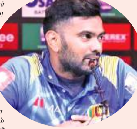
விடுத்திருந்தார் என்பது குறிப்பிடத்தக்கது. இளம் வீரராக நாட்டுக்காக

இலங்கை கிரிக்கெட் வீரர் பாணுக ராஜபக்ஷ தனது ஓய்வு கடிதத்தை வாபஸ் பெற்றுள்ளதாக இலங்கை கிரிக்கெட் தெரிவித்துள்ளது. தனது தனிப்பட்ட காரணங்கள்க்காக பாணுக ராஜபக்ஷ சமீபத்தில் தனது ஓய்வு பெறும் கடிதத்தை இலங்கை கிரிக்கெட்டிடம் கையளித்திருந்தார். இந்நிலையில், அவசர முடிவுகளை எடுக்க வேண்டாமென விளையாட்டு மற்றும் இளைஞர் விவகார அமைச்சர் நாமல் ராஜபக்ஷ தெரிவித்துள்ளார். இராஜினாமா கடிதத்தை மீளப் பெறுமாறு வேண்டுகோள்