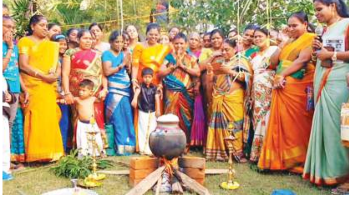
லாக பூசப்பட்டு செப்பனிடப்படும். அதன் மீது புள் ளிக்கோலத்தைப் போடுவார்கள். தைத்தினத்தன்று பொதுவாக புள்ளிக்கோலம்