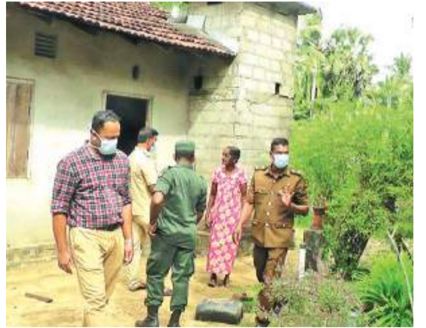
படங்கு நேயரின் தாக்கத்தினை கட்டுப்படுத்தும் முகமாக விசேட வேலைத்திட்டம் வாழைச்சேனை சுகாதார வைத்திய அதிகாரி அலுவலக பிரிவில் கிடம்பெற்று வருகிறது. அந்த வகையில் கக்குடா,கண்ணகியூர் மற்றும் மீராவோடை போன்ற கிராம சேவகர் பிரிவுகளில் உள்ள குடியிருப்பாளர்களின் வீடுகள் அடையாளப்படுத்தப்பட்டு களப் பரிசோதனை நடவடிக்கைகள் மேற்கொள்ளப்பட்டு போது.