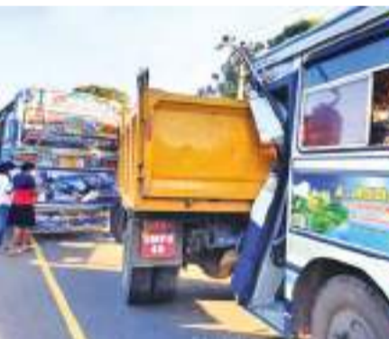
உட்பட மூன்று ஆண்களும் அடங்குகின்றனர். காயமடைந்தவர்களில் இரு பெண் ஊழியர்கள் பலத்த காயமடைந்துள்ளதுடன் ஏனையவர்களுக்கு சிறிய காயங்கள் ஏற்பட்டுள்ளமை தெரியவந்துள்ளது.

வவுனியா கெப்பித்திகொள்ளை ஏ 22 பிரதான வீதியின் கெலேபுளியன்குளம் பகுதியில் இடம்பெற்ற விபத்தில் காயமடைந்த 11 ஆடைத்தொழிற்சாலை ஊழியர்களும் வவுனியா வைத்தியசாலையில் அனுமதிக்கப்பட்டுள்ளதாக பொலிஸார் தெரிவித்தனர். இச்சம்பவம் நேற்றுமுன்தினம் மாலை 5.45 மணியளவில் கெப்பித்திகொள்ளை கெலேபுளியன்குளம் பகுதியில் இடம்பெற்றுள்ளது. இதுதொடர்பான விசாரணைகளை பொலிஸார் மேற்கொண்டு வருகின்றனர். காயமடைந்தவர்களில் ஒன்பது பெண் ஊழியர்களும் வல்வண்டியின் சாரதி