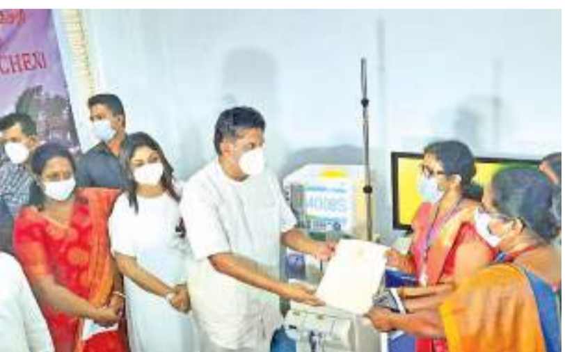
எதிர்க்கட்சி தலைவர் சஜித் பிரதமாதாசினால் சாவகச்சேரி ஆதார வைத்தியசாலைக்கு நேற்றுமுன்தினம் 12/01/2022 புதன்கிழமை சிறுநீரக நோயாளர்களின் பயன்பாட்டிற்காக 24இலட்சம் ரூபாய் பெறுமதியான ஊர்த தத்திரிப்பு இயந்திரம் ஒன்று வழங்கி வைக்கப்பட்டுள்ளது.

அகழ்வு பணிகள் முன்னெடுக்கப்பட்டிருந்தது. பொலிஸார், இராணுவத்தினர், கடற்படைமீனர், கிராம அலுவலர், நீதிமன்ற பிரதிநிதிகள் என பலர் முன்னிலையில் இந்த அகழ்வு பணி முன்னெடுக்கப்பட்டிருந்தது. இதன்போது உகிய நிலையில் உழவு இயந்திரத்தின் பாகங்கள் சில காணப்பட்ட நிலையில் அகழ்வு பணி நிறைவடைந்துள்ளது.