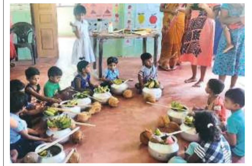
புதுக்குடியிருப்பு பிரதேச செயலாளர் பிரிவுக்குட்பட்ட விசுவமடு ரூபக் முன்பள்ளி மற்றும் சிவநகர் திலக் முன்பள்ளியில் பொங்கல் செய்வதற்கு தேவையான அனைத்து பொருட்களும் அடங்கிய பொதி நேற்றைய தினம் அவர்களின் பெற்றோருக்கு அன்பளிப்பாக வழங்கி வைக்கப்பட்டது.