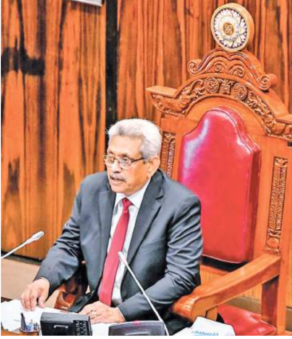
முன்னுரிமை கடமைப் பொறுப்புக்களை மறந்துவிடக் கூடாது.

இலக்கு வைக்கப்பட்ட சனத்தொகையின் 85 வீதத்தினருக்கும் அதிகமானோருக்கு இரண்டு தடுப்பூசிகளையும் வழங்கி இந்த நோயைக் கட்டுப்படுத்தி மக்களின் வாழ்க்கையை வழமை நிலைமைக்கு கொண்டுவர முடிந்தது. தற்போது அனைத்து குடும்பங்களும் இலக்காகக் கொண்டு முன்னராவது பூஸ்ட்டர் தடுப்பூசியையும் வழங்கி வருகின்றோம். இந்த உயர் பாராளுமன்றத்தைப் பிரதிநிதித்துவப்படுத்தும் அரசியல் கட்சிகளின் பிரதிநிதிகள் மேற்படுகின்ற அரசியல் ரீதியிலான பல்வேறு கருத்து வேறுபாடுகள் மற்றும் கொள்கை வேறுபாடுகள் இருக்கின்றன. எனினும், நாங்கள் அனைவரும் நாட்டின் நன்மையைப் பிரார்த்திக்கின்றோம். உலகளாவிய தொற்று நோயினால் பாதிக்கப்பட்டுள்ள இந்த கடினமான சந்தர்ப்பத்தில் நாட்டைக் கட்டியெழுப்ப அனைவரும் ஒன்றாக இணைந்து செயற்படும் பாரிய பொறுப்பு மக்கள் பிரதிநிதிகளாகிய உங்கள் அனைவருக்கும் உள்ளது. அந்தப் பொறுப்பினை நிறைவேற்ற எம்முடன் இணைந்து செயற்படுமாறு உங்கள் அனைவருக்கும் அழைப்பு விடுக்கின்றேன். எந்தவொரு சந்தர்ப்பத்திலும் எமது