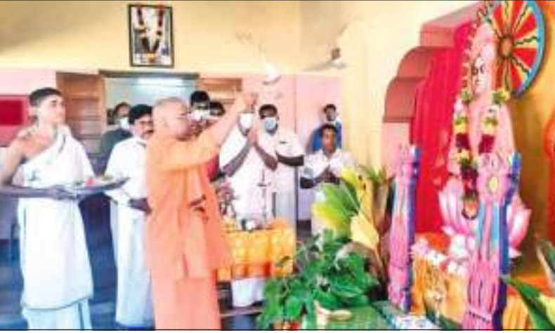
யேற்றினார். அவரது அந்த வரலாற்று ரீதியான விஜயத்திற்கு 125ஆண்டுகளாகி உள்ளது. அதனையொட்டி இலங்கை இராமகிருஷ்ணமிஷன் கொழும்பு தொடக்கம் மட்டக்களப்பு காரைதீவு ஸ்ரீராம பல இடங்களில் நினைவு

சுவாமி விவேகானந்தர் 1897ம் ஆண்டு ஜனவரி 15ந்திகதி வருகை தந்திருந்தார். அவர் இலங்கையில் கொழும்பு, யாழ்ப்பாணம், கண்டி, அனுராதபுரம், மாத்தளை போன்ற நகரங்களுக்கு விஜயம் செய்து 11 நாட்கள் தங்கியிருந்து ஆன்மிக ஒளி