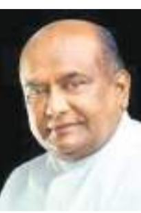
சபையின் தடை எல்லையைத் தாண்டியதும் நீங்கள் அனைவரும் பாராளுமன்றத்தின் கௌரவ உறுப்பினர்களாகக் கருதப்படுகின்றீர்கள்.

தொடர்பில் சபையும் கவனம் செலுத்தி சில விடயங்களில் மாற்றங்களை ஏற்படுத்துவது சிறந்தது என நான் கருதுகிறேன். சபையின் தடை எல்லையைத் தாண்டியதும் நீங்கள் அனைவரும் பாராளுமன்றத்தின் கௌரவ உறுப்பினர்களாகக் கருதப்படுகின்றீர்கள். கௌரவ உறுப்பினர் என்ற தலைப்புக்கு மதிப்பளிக்கும் வகையில் நீங்கள் பேசுவதிலும், நடந்துகொள்வதிலேயே இது தங்கியுள்ளதுடன், சபையிலும் இதுவே பிரதிபலிக்கிறது. நான் பாராளுமன்றத்துக்கு நுழையும்போது இப்படித்தான் சுற்றிக் கொண்டேன். நூலகத்தில் பல புத்தகங்களை வாசித்தும், மறைந்த காமினி திசாநாயக்க, ரணசிங்க பிரேமதாச, லலித் அத்துலாப் முதலியோர் பேச்சாளர்களின் ஊரைகளைப் பார்த்தும் கேட்டும் ஒரு வராகால தயார்ப்படுத்தலின் பின்னரே நான் முதன் முதலில் பாராளுமன்றத்தில் உரையாற்றினேன்.