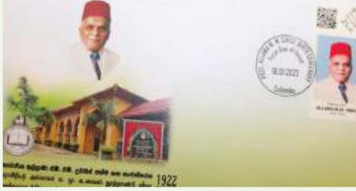
வுரையாளர்கள் உட்பட இலக்கியவாதிகள், முக்கிய பிரமுகர்களும் கலந்து சிறப்பித்தனர்.

இந்நிகழ்வில் பேராசிரியர்கள், பல்கலைக்கழக விரி