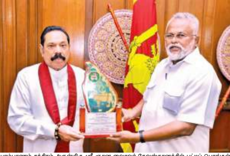
யாழ்ப்பாணம் சத்திரம் அருளியுடைய ஸ்ரீ ஞான வைரவர் தேவஸ்தானத்தில் பட்டிப் பொங்கல் தினத்தன்று ஏற்பாடு செய்யப்பட்ட 'கோமாதா உற்சவம் 2022' சிறப்பு நிகழ்வில் பிரதமர் மஹிந்த ராஜபக்ஷவிற்கு வழங்கப்பட்ட நினைவுச் சின்னத்தை அமைச்சர் டக்ளஸ் தேவானந்தா பிரதமரிடம் கையளித்தார். கோமாதா மற்றும் இடவதைக்கு எதிராக பிரதமர் மேற்கொண்டுள்ள தீர்மானத்திற்கு நன்றி தெரிவிக்கும் வகையில் விழா ஏற்பாட்டாளர்களினால் குறித்த நினைவுச் சின்னம் வழங்கி வைக்கப்பட்டது.