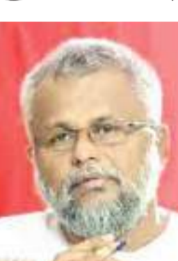
முறையிலும் முன்வைத்த விடயங்கள் குறித்தும் தனது உரையில் தெரிவித்துள்ள அமைச்சர் டக்ளஸ் தேவானந்தா.

தமிழ் மக்களுக்கான சுபிட்சமான எதிர்காலத்தை உருவாக்குவதற்கு வடக்கு, கிழக்கு பாராளுமன்ற உறுப்பினர்கள் முன்வர வேண்டும் என்று அழைப்பு விடுத்துள்ள அமைச்சர் டக்ளஸ் தேவானந்தா, ஜனாதிபதியின் கொள்கை விளக்க உரையின் அர்த்தத்தைப் புரிந்து கொள்ள வேண்டுமெனவும் தெரிவித்துள்ளார்.