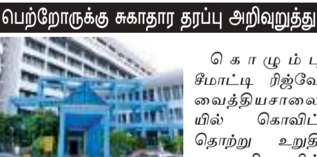
சிகிச்சை பெறும் சிறுவர்களின் எண்ணிக்கை அதிகரித்துள்ளது.

இதற்கமைய சிறுவர்களுக்கு கொவிட் பரவலதைக் கட்டுப்படுத்துவதற்காகச் சுகாதார வழிகாட்டல்களைப் பின்பற்றாமறு சுகாதார தரப்பினர் வலியுறுத்துகின்றனர்.