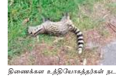
ஹப்பூத்தளை - பண்டாரவளை பிரதான பாதையில் சிறுத்தை யொன்று நேற்று இறந்து கிடந்துள்ளது.

புதுளை தினகரன் விசேட நிருபர் ஹப்பூத்தளை - பண்டாரவளை பிரதான பாதையில் சிறுத்தை யொன்று நேற்று இறந்து கிடந்துள்ளது. இதுகுறித்து, அப்பகுதி மக்கள் வனஜீவராசிகள் நினைக்களத்திற்கு அறிவித்துள்ளனர். இறந்துள்ள சிறுத்தை யொன்று வனஜீவராசிகள் நினைக்களத்திற்கு எடுத்துச் சென்று, பரிசேதனை நடாத்த, நினைக்கள உத்தியோகத்தர்கள் நடவடிக்கைகளை எடுத்துள்ளனர்.