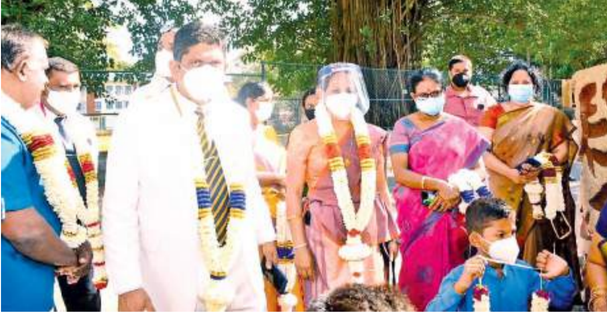
தைப்பொங்கல் விழா, நாடளாவிய ரீதியில் கொண்டாடப்பட்டதுடன் தேசிய நிகழ்வாகவும் கொண்டாடப்பட்டது. இதற்கிணங்க கொடும்பு ரோயல் கல்லூரியிலும் பொங்கல்விழா கொண்டாடப்பட்டது. இதில் கலந்துகொண்டவர்களில் ஒரு பகுதியினரை படங்களில் காணலாம்.