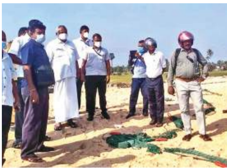
வடமாராட்சி கிழக்கிற்கு நேற்று விஜயம் மேற்கொண்ட அமைச்சர் டக்ளஸ் தேவானந்தா, உடுத்துறை பிரதேச கடற்பொறியாளர்கள் கரைவலைத் தொழிலில் ஈடுபடுவதனை நேரடியாகப் பார்வையிட்டார்.

குறுக்கு வீதி ஒன்றில் இருந்து பருத்தித்துறை வீதிக்கு ஏறிய உழவியந்திரத்துடன் பருத்தித்துறை வீதியில் பயணித்த மோட்டார் சைக்கிள் மோதி விபத்துக்குள்ளாகியிருப்பதாகத் தெரிவிக்கப்படுகிறது. இதில் மோட்டார் சைக்கிளில் பயணித்த மிதிவெடி அகற்றும் நிறுவனத்தில் பணியாற்றும் குடத்தனைப் பகுதியைச் சேர்ந்த பெண் காயமடைந்த நிலையில் மந்திகை வைத்திய சாலையில் சிகிச்சைக்காக அனுமதிக்கப்பட்டுள்ளார்.