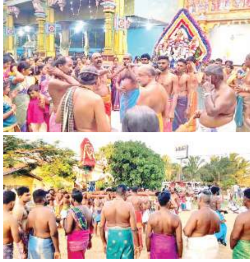
உடப்பு ஸ்ரீசுமரணி சத்தியபாயா சமேத ஸ்ரீபார்த்தசாரதிப் பெருமான் திரௌபதையும் மன் ஆலயத்தில் வருடாந்த பிரமோற்சவ உற்சவத்தில் வேட்டைத் திருவிழா அண்மையில் ஊட்பெற்றது. இதில் பக்த அடியார்கள் பலர் கலந்து அம்பாளின் அருளைப் பெற்றுக் கொண்டனர்.

கலாநிதி சிவலூர் கு.வை.க. வைத்தீஸ்வர குருக்கள்