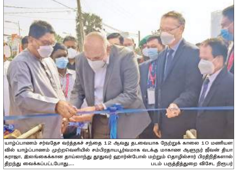
யாழ்ப்பாணம் சர்வதேச வர்த்தகச் சந்தை 12 ஆவது தடவையாக நேற்றுக் காலை 10 மணிளவில் யாழ்ப்பாணம் முற்றவளியில் சம்பிரதாயபூர்வமாக வடக்கு மாகாண ஆளுநர் ஜீவன் தியாகராஜா, இலங்கைக்கான தாய்லாந்து தூதுவர் ஹரன்போல் மற்றும் தொழில்சார் பிரதிநிதிகளால் திறந்து வைக்கப்பட்டபோது... படம் பருத்தித்துறை விசேட நிருபர் 03

கப்பல் பெட்.09 திகதியே நாட்டுக்கு வரும் மின்சார சபைக்கு எரிபொருள் வழங்க இருவாரங்களாகும்