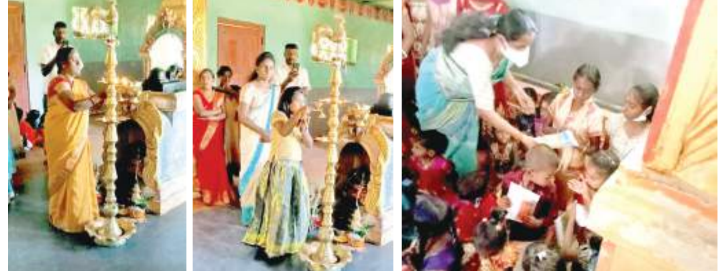
கண்டி கல்வி வலயத்துக்கு உட்பட்ட தெல்தோட்டை நாராய்க்கொண்ட தமீழ் வித்தியாலயத்தில் பொங்கல் விழா அண்மையில் நடைபெற்றது.

திருமணமான பெண்கள் தெற்றி நடுவிலும், வகிட்டின் தொடக்கத்திலும் குங்குமம் அணிவது சிறப்பு. ஆண்கள் இருபருவங்களையும் இணைத்தார் போல் குங்குமம் அணிவது தன்னம்பிக்கையை அதிகரிக்கும். கட்டைவிரலால் குங்குமம் இட்டுக் கொள்வது மிகுந்த துணியைக் கொடுக்கும். குருவிரலால் (ஆள்காட்டி விரல்) குங்குமம் அணிவது முன்னனித்தன்மை, நிர்வாகம், ஆளுமை போன்றவற்றை ஊக்குவிக்கும். சனிவிரல் (நடுவிரல்) குங்குமம் இட்டுக் கொள்வது தீர்க்காயுளைக் கொடுக்கும். குங்குமம் அணிவது தெய்வீக தன்மை, உடல் குளிர்ச்சி மற்றும் சுயக் கட்டுப்பாட்டிற்கு நல்லது. மங்களம் தரும் குங்குமத்தை அணிந்து, இன்னும் மங்களகரமாக இருக்க, உங்கள் வீட்டு இளந்தளிர்களுக்கு இந்த நல்ல நாளில் ஆரம்பித்து பாடிப்படியாக சொல்லி கொடுங்கள்.