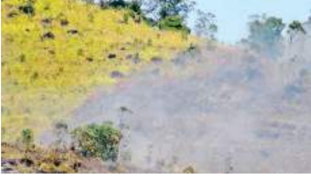
ஹற்றன் விஷேட நிருபர்

குடிநீருக்கு தட்டுப்பாடு ஏற்படும் அபாயம்