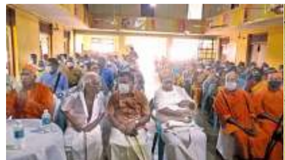
நடராஜர் மண்டபத்தில் இடம்பெற்ற நிகழ்வில் கலை நிகழ்வுகள் இடம்பெற்றதுடன், தமிழ்நாட்டின் கோயம்புத்தூர் இராமகிருஷ்ணமிஷன் வித்தியாலய சுவாமி,