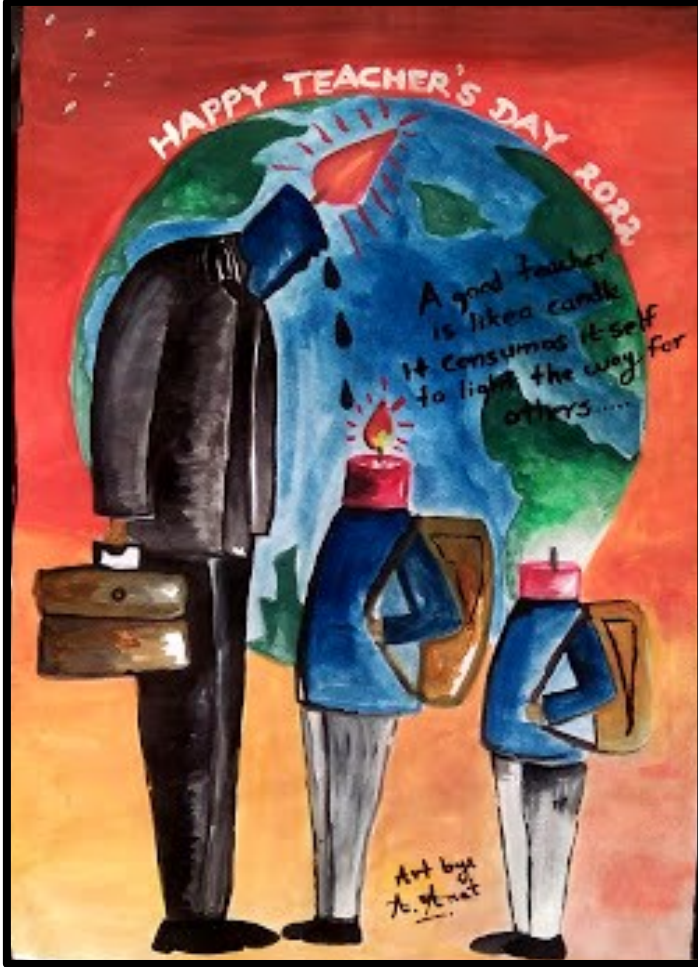
A. Anet, Art Course