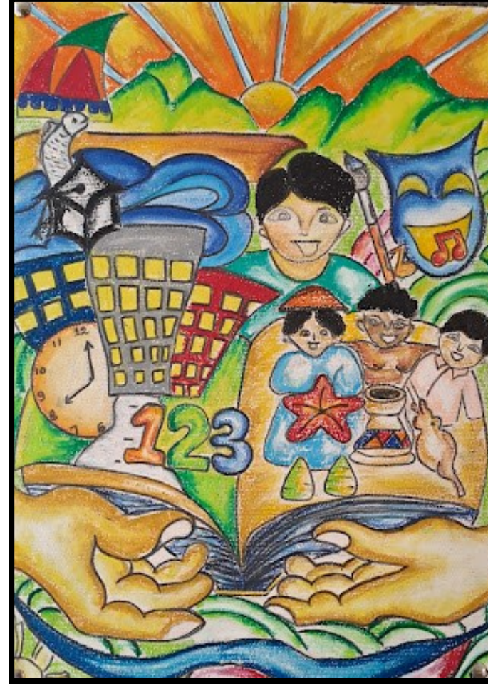
G.F. Rashna Doole, Art Course