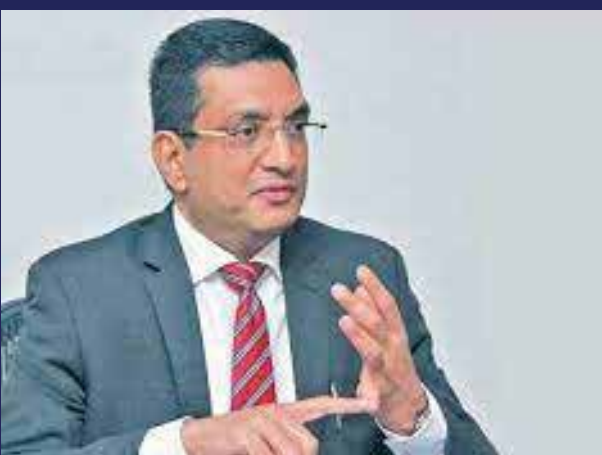
தமிழ் அரசியல் தலைவர்கள் புலம்பெயர் தவர்களின் நிகழ்ச்சி நிரல்களுக்குள்

தமிழ்த் தலைவர்களிடம் அமைச்சர் அலி சப்ரி கோரிக்கை