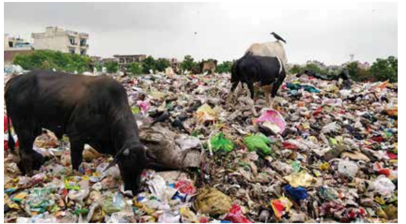
மேனி முழுவதும் பிளாஸ்டிக் கழிவுகளின் கோரப் பற்கள் ஆழப்பதிந்துள்ளன. பிளாஸ்டிக் கழிவுகள் நிலத்தைப் போர்த்தி மண்ணினுள் மழுநீர் மனித உடலினுள்ளும் தேங்க ஆரம்பித்துள்ளன. பிளாஸ்டிக் நல்லாட்சியைவிடச் சமநிலையைச் சீர்குலைத்து இயற்கையைச் சாகடிக்கும் அதன் வல்லாட தாமதமின்றித் தீரும்பேரெனும். தவறின் பிளாஸ்டிக் அதனைப் பிரசுவித்த மனுக்குலத்தையே விரைவில் தீண்டுசெரித்துவிடும் என்றும் குறிப்பிட்டுள்ளார். (05)

தேவையற்ற பிளாஸ்டிக் பொருள்களை வாங்குவதைத் தவிர்ப்பது எம்முன்னால் உள்ள முதற்தெரிவாகும். இயன்றவரை நீண்டகாலம் பயன்படுத்துவது, கழிக்க முயங்குவதால் தரையில் யானைகள் முதல் கடலில் மீன்கள் வரை பலமில்லியன்களைக் காண உயிர்கள் ஆண்டுதோறும் அற்புதத்தில் பிலியாகி வருகின்றன. பிளாஸ்டிக் கழிவுகளை எரிப்பதால் வெளிவரும் கொடும் டையொக்சின் வாயு மனிதர்களை மலடாக்கி வருகிறது. தற்போது பிளாஸ்டிக் கழிவுகள் நுண்துகள்களாக