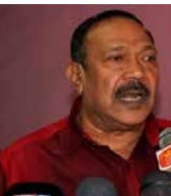
ராஜபக்ஷக்களின் காலத்தில் இடம்பெற்ற ஊழல், மோசடிகளினால் நாடு இழந்த பணத்தை மீள்பெறுவதற்கு