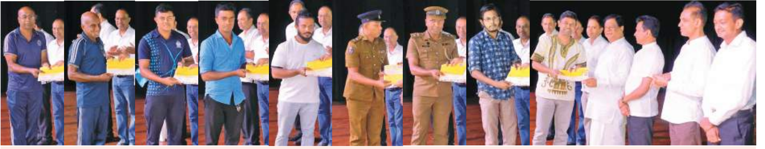
ஹோமாகம் பிடிபை பொசன் வலையத்தில் நடைபெற்ற பொசன் வெளிச்சக்கூடு கண்காட்சியில் வெற்றிபெற்ற ரோர்களுக்கு அமைச்சர் பந்துல குணவர்தன பரிசு வழங்குவதை படத்தில் காணலாம்.