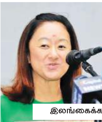
இலங்கைக்கான அமெரிக்க தூதுவர் ஜூலி சங்