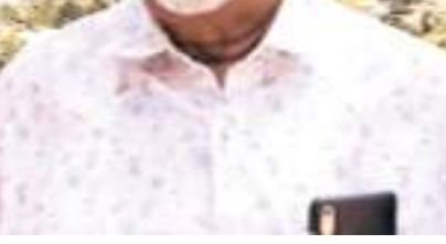
என்தின் ஆயுட்காலத்தலைவராக செயற்படுவாரெனவும் உறுப்பினர்களின் ஏகோபித்த தீர்மானமாக அறிவிக்கப்பட்டது. (06ஆம் பக்கம் பார்க்க)