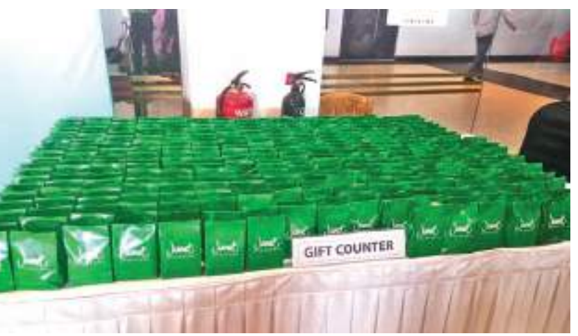
பொருட்கள் விற்பனை நிலையம் யாழ்ப்பாணத்தில் அண்மையில் திறந்து வைக்கப்பட்ட போது...