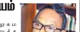
அட்டுலும கல உடவத்த அல் கல்லாலி ஆரம்ப வித்தியாலயத்திற்கு இலங்கை மக்கள் சக்தி பாராளுமன்ற உறுப்பினர் இம்தியாஸ் பாக்கீர் மாக்கார் இன்று (03) காலை 9.00 மணிக்கு விஜயம் செய்கிறார். பாராளுமன்ற உறுப்பினர் பன்முகவரவு செலவு திட்ட நிதியிலிருந்து மேற்படி பாடசாலையில் புனரமைக்கப்பட்டிருக்கும் சுற்றுமையில் புனரமைப்புக்கு முடிவடைந்தது. இலங்கை, துபாய், சனஜத்தியதோடு நேற்று (03) காலை 9.00 மணிக்கு விஜயம் செய்கிறார். பாராளுமன்ற உறுப்பினர் பன்முகவரவு செலவு திட்ட நிதியிலிருந்து மேற்படி பாடசாலையில் புனரமைக்கப்பட்டிருக்கும் சுற்றுமையில் புனரமைப்புக்கு முடிவடைந்தது.