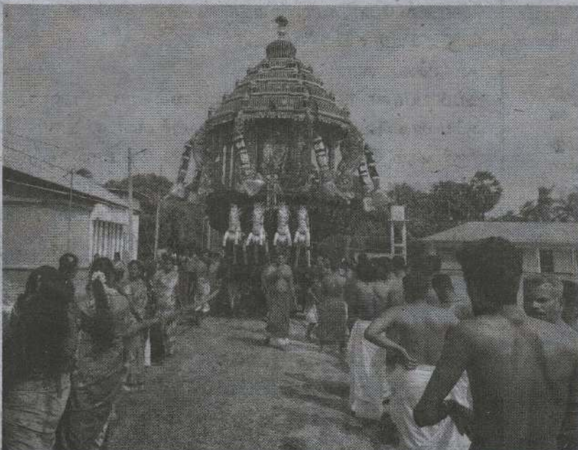
கொழும்புத்துறை இலைந்தைக்குளம் வதரிபீட விநாயகர் ஆலய இரதோற்சவம் நேற்று வெள்ளிக்கிழமை அடியவர்கள் கூழ சிறப்புற இடம்பெற்றது. (ச-17)

யும் கேட்ட நீதிமன்றம், குற்றவாளியின் கொலைக் குற்றத்தின் கீழ் அவருக்கு வழங்கப்பட்ட சிறைத்தண்டனை ஏற்படையது. ஆயினும் அந்தப் பெண்ணைக் கொலை செய்துவிட்டு வெறும் உயிரற்ற சடலத்தை துஷ்பிரயோகத்துக்குட்படுத்தியமை இந்திய தண்டனைச் சட்டத்தின்கீழ் தண்டனைக்குரிய குற்றமாக கருதப்படாது. அதற்கமைய அந்தக் குற்றத் துக்கு விதிக்கப்பட்ட 10 ஆண்டு சிறைத் தண்டனை ரத்துச் செய்யப்படுகிறது என்று நீதி மன்று உத்தரவிட்டுள்ளது. (ச-இ)