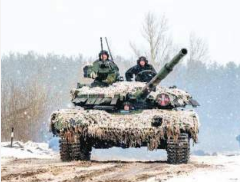
‘அமெரிக்க பிரஜைகள் இப்போதே வெளியேற வேண்டும்’ என்று என். பி.சி செய்திக்கு அளித்த பேட்டியில் பைடன் தெரிவித்துள்ளார்.

உக்ரைனில் உள்ள அமெரிக்கர்கள் உடன் வெளியேறும்படி அமெரிக்க இராணுவ திணைக்களம் வலியுறுத்தி யுள்ளது.