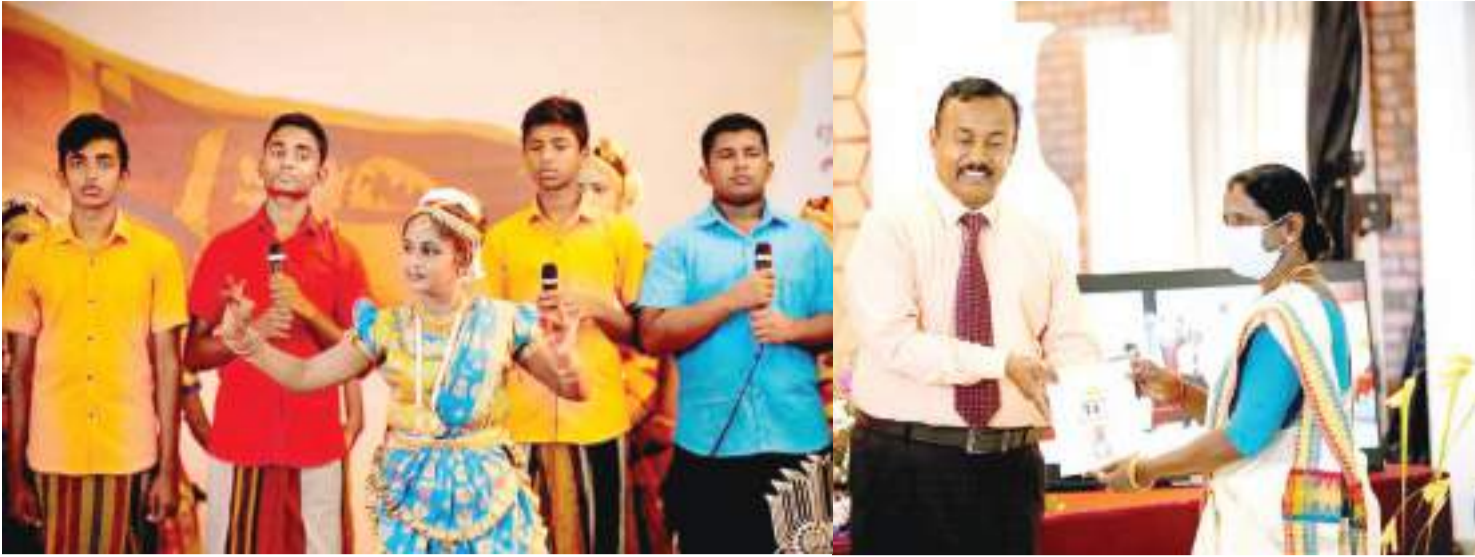
74 ஆவது சுதந்திர தினத்தை முன்னிட்டு தெல்கொட மஹாமெவனாவ பெளத்த கல்லூரி மற்றும் தமிழ் பாடசாலைகள் இணைந்து நடத்திய விழாவில் எடுக்கப்பட்ட படங்கள்.