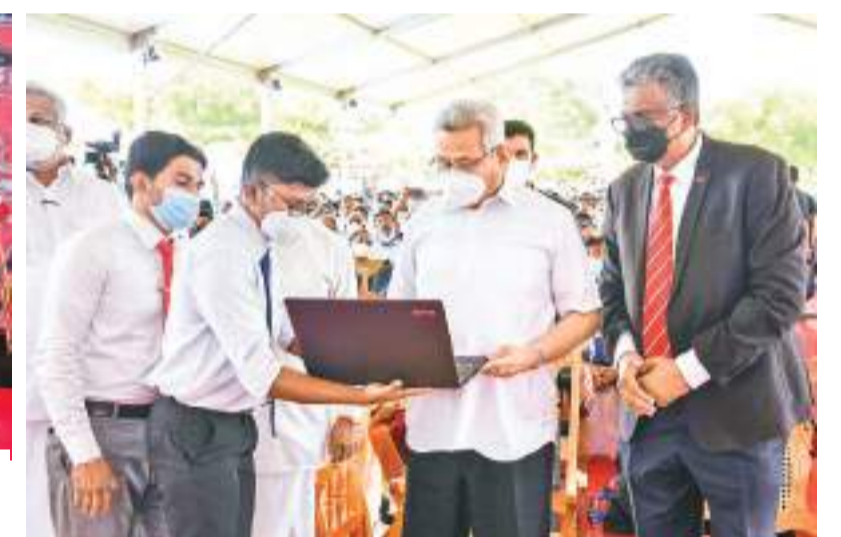
வவுனியா வளாகத்தை தேசிய பல்கலைக்கழகமாக மாற்றும் நிகழ்வைப் பதிவு செய்யும் நோக்கில் கல்வெட்டைத் திரைநீக்கம் செய்து திறந்துவைத்த ஜனாதிபதி, பல்கலைக்கழகத் தகவல் தொழில்நுட்ப மத்திய நிலையம் மற்றும் சகவாழ்வு மையம் போன்றவற்றை மாணவர் பாவனைக்கு கையளித்தார்.

மேலமாகாணத்தில் பிலியந்தலை கல்விலையத்தின் தென்கிழக்கில் கோட்டக்கல்விப் பிரிவுக்குள் செயற்பட்டு வருகின்ற பழப் பெருமை வாய்ந்த இரத்த மலாணை, கொழும்பு இந்துக்கல்லூரி சவால்களுக்கு முகம் கொடுத்துத் தடைகளைத் தகர்த்து முன்னேறி வருகின்றது. வறுமையான கழலிலிருந்து வரும் நூற்றுக்கணக்கான மாணவர்களுக்கு கல்விளித்து வளப்படுத்துகின்ற ஒரு பாடசாலை இதுவாகும். இந்துக் கல்லூரி