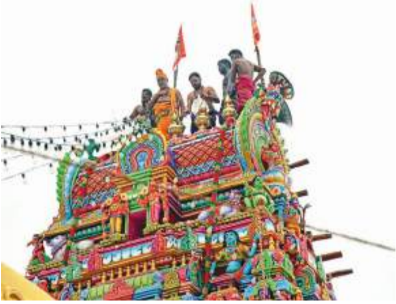
மட்டக்களப்பு செங்கலை ஸ்ரீ சித்திவிநாயகர் ஆலய புனராவர்த்தன அஷ்ட பந்தன நவகுண்ட பட்டி மஹா கும்பாபிஷேக திருக்குட முழுக்க பெருஞ்சாந்தி விழா நேற்று நடைபெற்றது.