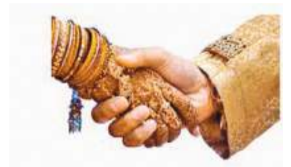
நிஜமாய் ஆனது நீயொருத்தனுக்கு மாலையிட்டாய் என்று

தோப்பூர்.எஸ்.சிராஜுதீன் நற்பிட்டடிமுனை,கல்முனை