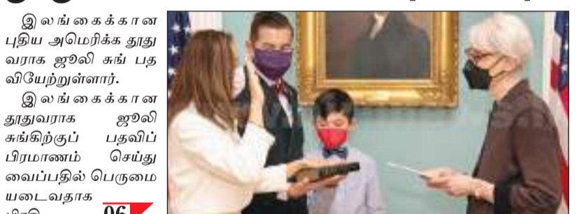
இலங்கைக்கான புதிய அமெரிக்க தூதுவராக ஜூலி சுங்கிற் பதவிப் பிரமாணம் செய்து வைப்பதில் பெருமையடைவதாக பிரதி 06