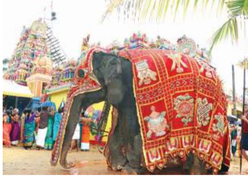
வரலாற்றில் முதல் தடவையாக சுவாமி யானையில் ஏறி பவனி வந்தமை குறிப்பிடத்தக்கது.