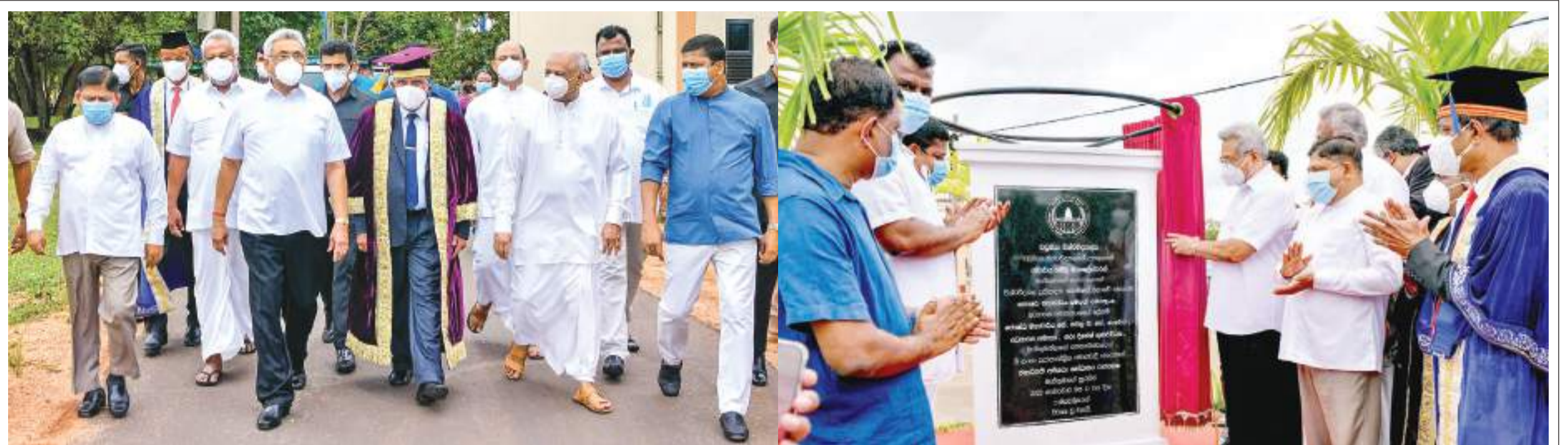
யாழ். பல்கலைக்கழகத்துடன் இணைக்கப்பட்டிருந்த வவுனியா வளாகம், "வவுனியா பல்கலைக்கழகம்" என்ற பெயரில் தேசிய பல்கலைக்கழகமாக அங்குராப்பணம் செய்யும் நிகழ்வு, ஜனாதிபதி கோட்டாபய ராஜபக்ஷ தலைமையில் நேற்று (11) நடைபெற்றது. நிகழ்வுக்கு வருகைதந்த ஜனாதிபதி வரவேற்கப்பட்டு அழைத்துச் செல்லப்படுவதையும் தேசிய பல்கலைக்கழகமாக மாற்றும் நிகழ்வைப் பதிவு செய்யும் கல்வெட்டை ஜனாதிபதி திரைநீர்க்கம் செய்து திறந்துவைப்பதையும் படங்களில் காணலாம்.