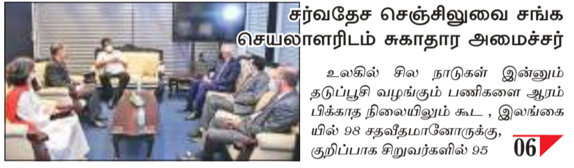
சர்வதேச செஞ்சிலுவை சங்க செயலாளரிடம் சுகாதார அமைச்சர் உலகில் சில நாட்கள் இன்னும் தடுப்பூசி வழங்கும் பணிகளை ஆரம்பிக்காத நிலையிலும் கூட, இலங்கையில் 98 சதவீதமானோருக்கு, குறிப்பாக சிறுவர்களில் 95 06