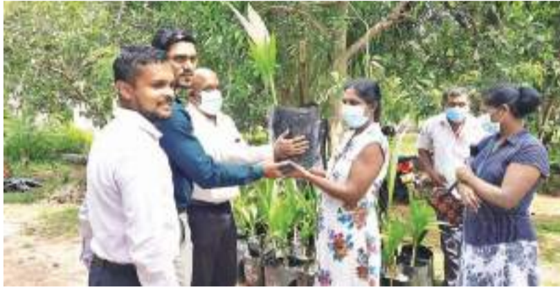
தம்பலகாமம் பிரதேச செயலாளர் பிரிவுக்குட்பட்ட முள்ளிப்பொத்தானை கமநல சேவை நிலையத்துக்குட்பட்ட ஓய்வு பெற்ற கிராமிய வீரர்களுக்கு 35 தொன்மை கன்றுகள் வழங்கி (7) வைக்கப்பட்ட போது.

அத்துடன், கிழக்கு மாகாண கூட்டுறவு சங்கங்களின் பராமரிப்பின் கீழ் உள்ள எரிபொருள் நிரப்பு நிலையங்களை நவீனமயப்படுத்துவதற்கும் திட்டமிட்டுள்ளோம். அதற்காக எமது கூட்டுறவு சங்கங்களின் பராமரிப்பின் கீழுள்ள 27 எரிபொருள் நிலையங்களில், நான்கு எரிபொருள் நிலையங்களை மாதிரி எரிபொருள் நிரப்பு நிலையங்களாக அபிவிருத்தி செய்யவுள்ளோம் என்றார். இக்கலந்துரையின் போது, பலநோக்கு கூட்டுறவு சங்கங்கள் எதிர்பார்க்கும் பிரச்சினைகளுக்கு தீர்வு காணப்பட்டதுடன், புதிய எரிபொருள் நிரப்பு நிலையங்களை அமைத்து பலநோக்கு கூட்டுறவு சங்கங்களை சக்திமிக்கதாக மாற்றுவதற்கும் இணக்கம் காணப்பட்டது.