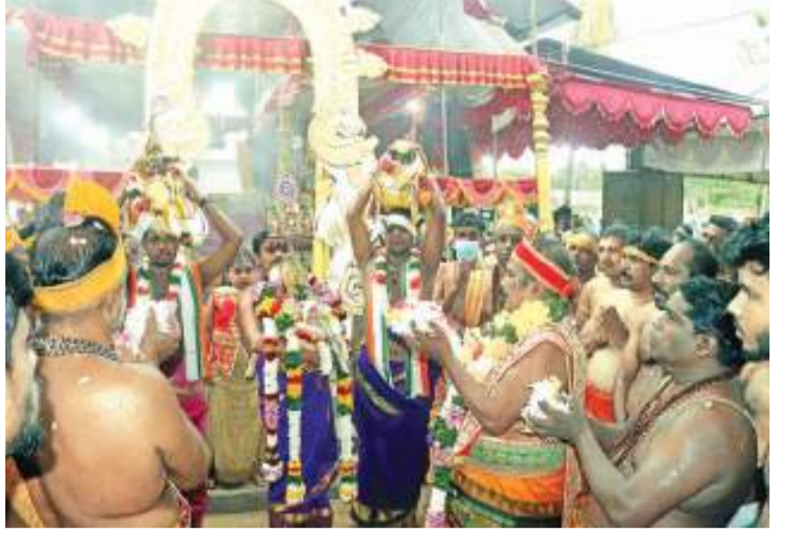
வரலாற்றில் முதல் தடவையாக சுவாமி யானையில் ஏறி பவனி வந்தமை குறிப்பிடத்தக்கது.