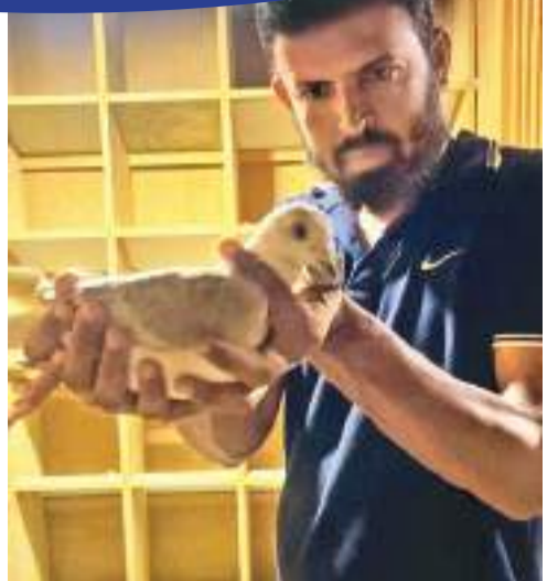
புது சின்னப் பிள்ளைகள்தான். பெரிய ஆட்கள்; புறா வளர்ப்பதில்லை என்ற வித்தியாசமான கண்ணோட்டத்தில் நோக்குகின்றனர். வெளிநாட்டவர்களை எடுத்துக்

ஒரு கட்டுரையொன்றை வாசித்தேன். அதை வைத்து திட்டமிட்ட அடிப்படையில் மிக அழகிய கட்டடக்க கலை அம்சங்களுடன் நிர்மாணித்தேன். பல நாடுகளுக்குச் சென்றிருக்கின்றேன். புறாக்கூட்டின் பல அழகினை ஜெர்மன், இந்தியா, ஜப்பான் போன்ற நாடுகளில் பார்த்திருக்கின்றேன் அவர்களுடன் தொலைபேசியில் பேசி புகைப்படத்தைப் பெற்று இலங்கைக்கு அமையக் கூடிய வகையில் வரைந்து நிர்மாணித்துள்ளேன். இதனை சுமார் 4 மில்லியன் ரூபா செலவில் நிர்மாணித்துள்ளேன். நான் ஜப்பான் நாட்டில் தொழில் செய்தாலும் இதற்காக வீட்டில் ஒருவரை வேலைக்கு அமர்த்தியுள்ளேன். இந்த சந்தர்ப்பத்தில் பேராதனை பல்கலைக்கழகத்தில் ஒரு பேராசிரியர் எழுதிய