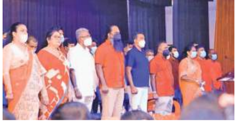
கந்தளாய் தினகரன் நிருபர்