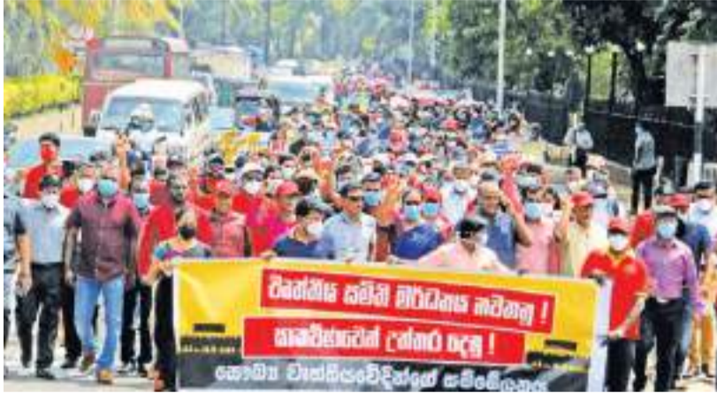
சுகாதார தாழ்மார் சங்கம் நேற்று கொழும்பில் எதிர்ப்பு ஆர்ப்பாட்டம் நடத்தினர். புறக் கோட்டையில் நிலையத்திற்கு முன்பாக இருந்து ஜனாதிபதி செயலகம் வரை ஊர்வலமாக செல்வதை படத்தில் காணலாம்.