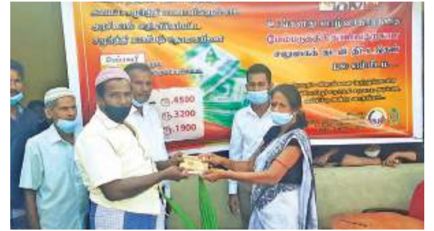
தேப்பூர் குறுப் நிருபர்

சுபிட்சத்தின் நோக்கத்திற்கு அமைய சமுர்த்தி பயனாளிகளுக்காக அரசினால் அதிகரிக்கப்பட்ட சமுர்த்தி மானியத் தொகையினை உத்தியோக பூர்வமாக வழங்கி வைக்கும் நிகழ்வு திங்கட்கிழமை (14) நாடளாவிய ரீதியில் இடம்பெற்றது. அந்த வகையில் திருகோணமலை தேப்பூர் சமுர்த்தி வங்கி கிளையின் கீழுள்ள 16 கிராம உத்தியோகத்தர்