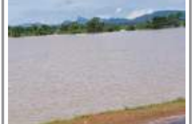
பெரியபோர்தீவு தினகரன் நிருபர்

மட்டக்களப்பு மாவட்டத்தில் கடந்த மூன்று நாட்களாக பலத்த மழை பெய்து வருகின்றது. இதனால் தற்போது மேற்கொள்ளப்பட்டுவரும் பெரும்போக வேளாண்மை அறுவடையிலும் பாதிப்புக்கள் ஏற்பட்டுள்ளதாக விவசாயிகள் கவலை தெரிவிக்கின்றனர். இந்நிலையில் மாவட்டத்தின் சிறிய மற்றும் பெரிய குளங்களின் நீர் மட்டங்களும் அதிகரித்துள்ளதாக அக்குளங்களுக்குப் பொறுப்பு பான நீர்ப்பாசனப் பொறியியலாளர்கள் தெரிவித்துள்ளனர். உன்சீக்கைக்குளத்தின் நீர்மட்டம் 32 அடி 10 அங்குலம், உறுகாமம் குளத்தின் நீர்மட்டம் 14 அடி 11 அங்குலம், வாகனேரிக்குளத்தின் நீர்மட்டம் 18 அடி 9 அங்குலம், கட்டுமுறிவுக்குளத்தின் நீர்மட்டம் 11 அடி 8 அங்குலம், அக்குளத்தின் 2 அங்குல மேலதிக நீர் வெளியேற்றப்படுகின்றது. கித்தான்கொடு குளத்தின் நீர்மட்டம் 8 அடி 5 அங்குலம், வெலிக் காக்கண்டிய குளத்தின் நீர்மட்டம் 15 அடி 5 அங்குலம், புணாணை அணைக்கட்டு 7 அடி 9 அங்குலமாக நீர்மட்டம் உயர்ந்துள்ளதாக பொறியியலாளர்கள் தெரிவித்துள்ளனர்.