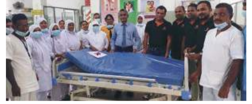
மாணிக்காடு குறுப் நிருபர்

சியபத பிளான்ஸ் பி.எல்.சி நிறுவனத்தால் சாய்ந்தமருது பிரதேச வைத்தியசாலைக்கு சுமார் 3 மில்லியன் பெறுமதியான HDU கட்டிடங்கள் கையளிக்கும் நிகழ்வு வைத்தியசாலை கேட்போர் கூடத்தில் இடம்பெற்றது. சியபத பிளான்ஸ் பி.எல்.சி நிறுவனத்தின் பிராந்திய முகாமையாளர் மற்றும் அவரது குழுவினரால் நிறுவனத்தின் CSR திட்டத்தின் கீழ் இவை வழங்கி வைக்கப்பட்டன. சாய்ந்தமருது பிரதேச வைத்தியசாலை வைத்திய பொறுப்பதிகாரி