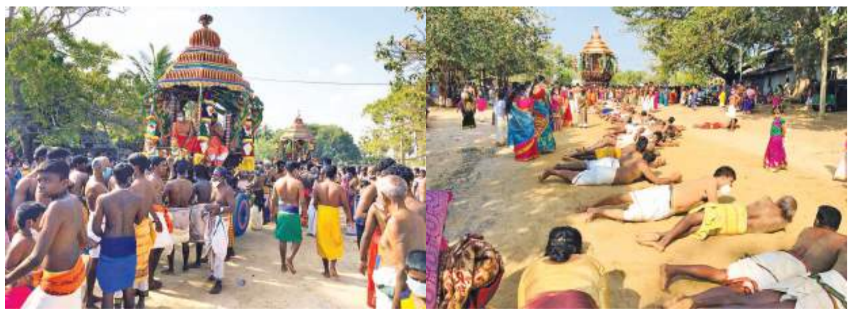
வல்லிபுர ஆழ்வார் ஆலய தேர் உற்சவம் செவ்வாய்க்கிழமை (15) இடம்பெற்றது.

நிலையத்தில் தரித்து செல்வதில்லை. இதன் காரணமாக பயணிகள் பாதிக்கப்படுகின்றனர். பேருந்து நிலையத்தில் பேருந்துகள் தரித்து செல்வதன் காரணமாக பெரும் பயணிகள் ஏற்படும். குறித்த பேருந்து நிலையத்திற்கும் முழங்காவில் பேருந்து நிலையத்திற்கும் அரசு மற்றும் தனியார் பேருந்துகள் 10 நிமிடங்கள் தரித்து நின்று செல்வதை உறுதிப்படுத்துமாறு தவிசாளரினால் கோரிக்கை விடுக்கப்பட்டது. இவ்விடயத்தினை கேட்டறிந்த அமைச்சர் டக்ளஸ் தேவானந்தா இதனை உடனடியாக நடவடிக்கை எடுத்துமாறு உத்தரவு பிறப்பித்தார்.