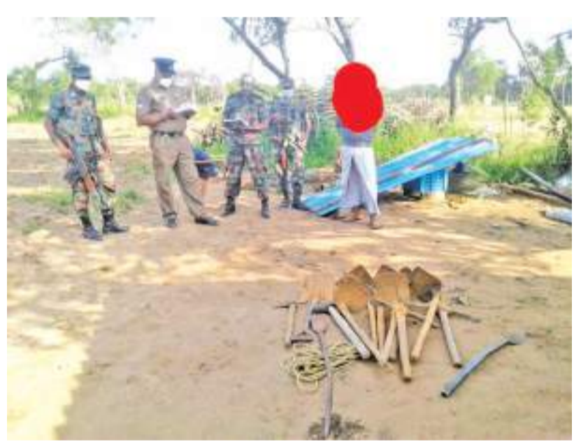
ஒள்ளதோடு புதையல் தோண்ட பயன்படுத்தப்பட்ட பொருட்கள் அடம்பன் பொலிஸ் நிலையத்தில் ஒப்படைக்கப்பட்டிருக்கிறது. தப்பியோடிய சந்தேக நபர்கள் 6 பேரை பொலிசார் தேடி வருகின்றனர். மேலதிக விசாரணைகளை அடம்பன் பொலிஸார் மேற்கொண்டு வருகின்றமை குறிப்பிடத்தக்கது.

அடம்பன் பொலிஸ் பிரிவுக்குட்பட்ட குருவில் வான் பகுதியில் புதையல் தோண்டிய ஒருவர் செவ்வாய்க்கிழமை (15) மாலை கைது செய்யப்பட்டுள்ளார். மன்னார் இராணுவ புலனாய்வுத்துறையினருக்கு கிடைக்கப்பெற்ற இரகசிய தகவலையடுத்து இராணுவம் மற்றும் அடம்பன் பொலிஸார் இணைந்து குருவில் வான் பகுதியில் சோதனை நடவடிக்கைகளை மேற்கொண்டனர். இதன் போது குறித்த பகுதியில் புதையல் தோண்டும் நடவடிக்கையில் ஈடுபட்ட சந்தேக நபர் ஒருவரை கைது செய்யப்பட்டுள்ளதோடு மேலும் ஆறு சந்தேக நபர்கள் தப்பிச் சென்றுள்ளனர். புதையல் தோண்ட பயன்படுத்தப்பட்டுள்ள ஒரு தொகுதி பொருட்கள் இராணுவம் மற்றும் பொலிஸார் மீட்டுள்ளனர். கைது செய்யப்பட்ட சந்தேக நபர் தற்போது அடம்பன் பொலிஸ் நிலையத்தில் தடுத்து வைக்கப்பட்டுள்ளார்.