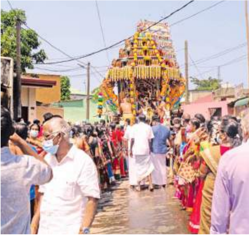
கொழும்பு முகத்துவாரம் ஸ்ரீவெங்கடேஸ்வர ஹனுமேஸ்வர கோவில் மாசிமக மகோற் சுவத்தில் ஸ்ரீமத்துமாரியம்மன் தேரில் எழுந்தருளி பக்கதர்களுக்கு காட்சி கொடுத்த போது எடுக்கப்பட்ட படம்.