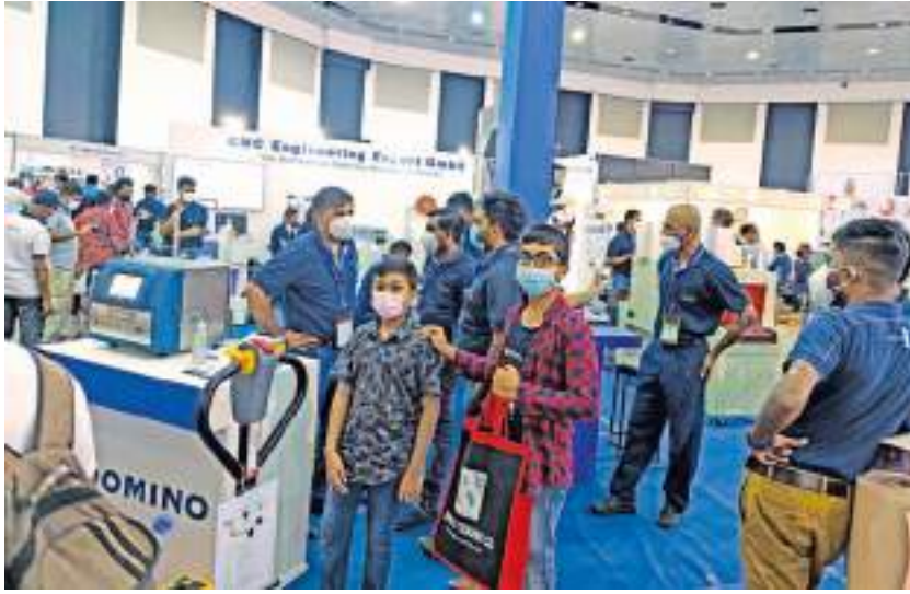
ஸ்ரீலங்கா அச்சக சம்மேளனம் ஒழுங்கு செய்திருந்த ' பிரின்ட் 2022 ' கண்காட்சி 18 முதல் 20 வரை பண்டாரநாயக்க சர்வதேச மாநாட்டு மண்டபத்தில் இடம்பெற்றது. அச்சத்துறையில் அனுபவமுள்ள , ஆர்வமுள்ள வெளிநாட்டு உள்நாட்டு முக்கியஸ்தர்கள் பலர் இக் கண்காட்சியில் கலந்து கொண்டனர்.