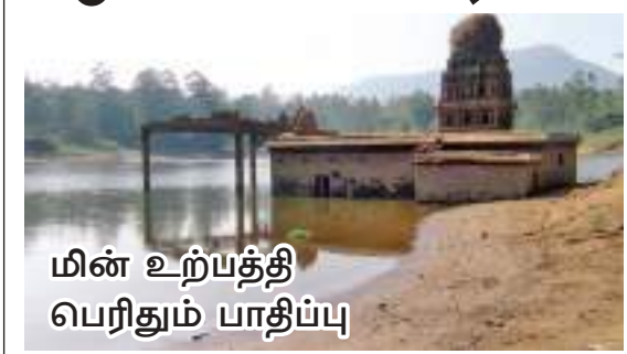
மின் உற்பத்தி பெரிதும் பாதிப்பு

ஹற்றன் விசேட நிருபர் நீர்மின் உற்பத்திக்காக பயன்படுத்தும் மலையகத்தின் மிகப்பெரிய நீர்த்தேக்கங்களில் ஒன்றான மவுசாக்கலை நீர்த்தேக்கத்தில் நேற்று முன்தினம் (21ஆம் திகதிக்கு) சுமார் 55 வீதம் வரை நீர் குறைந்துள்ளதாகவும் தற்போது 45.4 வீத நீர் மாத்திரமே எஞ்சியிருப்பதாகவும் மின்சார சபை பொறியியலாளர் ஒருவர் தெரிவித்தார். இந் நீர்த்தேக்கத்தில் நீர் வற்றியதன் காரணமாக நீருக்குள் மூழ்கிக் கிடந்த கதிசேன் ஆலயம், விகாரை, புத்தச்சிலை, பள்ளிவாசல், மல்கெலியா