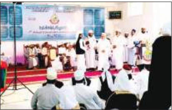
(வெலிகம தினகரன் நிருபர்)

மாத்தறை மின்னத்துல் பாலிய்யா அறபுக்கல்லூரியின் 7வது அல் ஆலிம், அல் ஆலிமா, அல் ஹாபிழ் பட்டமளிப்பு விழா அண்மையில் கல்லூரி மண்டபத்தில் வெகு விமர்சனமாக நடைபெற்றது.