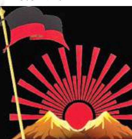
அப்போதும் தமிழகத்தின் குரலாக ஒலித்தார். சமூகம் சார்ந்த எந்த ஒரு பிரச்சினையாக இருந்தாலும் முதல் ஆளாக குரல் கொடுத்து வந்தார். இந்த வெற்றிக்கு பின்னால் கனிமொழியின் கடும் உழைப்பு இருக்கிறது. தொடர்ந்து கடுமையாக பேராடி, தன் கட்சி வளர பாடுபட்டு வரும் கனிமொழிக்கு அண்ணன் முதல்வர் மு.க.ஸ்டாலின் என்ன பரிசு கொடுப்பார் என்ற எதிர்பார்ப்பு அவரது ஆதரவாளர்களிடையே எழுந்துள்ளது. கட்சியின் தலைமைக் கழக பதவிகளில் ஒன்றை கனிமொழிக்கு வழங்க வேண்டும் என்பதுதான் அவரது ஆதரவாளர்களின் எண்ணமாக இருக்கிறது. இத்தனை தொடர் வெற்றியை குவித்த கனிமொழிக்கு அண்ணனிடம் இருந்து பரிசு கிடைக்கும் என்பதை பொறுத்திருந்து தான் பார்க்க வேண்டும்.

களில் தி.மு.க 50 வார்ட்களில் வென்று மாநகராட்சியை கைப்பற்றியுள்ளது. தூத்துக்குடி வெற்றிக்கு கனிமொழி எம்.பியும் ஒரு காரணம் ஆகும். அவரது தொடர் பிரசாரம் மக்களிடம் ஆட்சியின் சாதனைகளை கொண்டு சேர்த்துள்ளது என்பதற்கான அவதானிகள். தூத்துக்குடி மக்களுக்கும் கனிமொழிக்கும் இருக்கும் பாசப் பிணைப்பு அதிகம் உள்ளது. கவிஞர், எழுத்தாளர், இலக்கியவாதி, தமிழ் ஆர்வலர் ஆகியவற்றிலும் ஜொலித்த கனிமொழி, அரசியலிலும் அவரது செயல்பாடுகள் டெல்லி வரை கொடி கட்டியுள்ளது. கடந்த 2007 ஆம் ஆண்டு ராஜ்யசபா உறுப்பினராக முதல்முறையாக கனிமொழி ராஜ்யசபா எம்.பியாக நியமிக்கப்பட்டார். மீண்டும் 2013 ஆம் ஆண்டு இரண்டாவது முறையாக ராஜ்யசபாவுக்கு கனிமொழி தேர்வு செய்யப்பட்டார்.