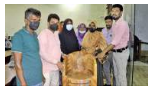
(புத்தளம் தினகரன் நிருபர்)