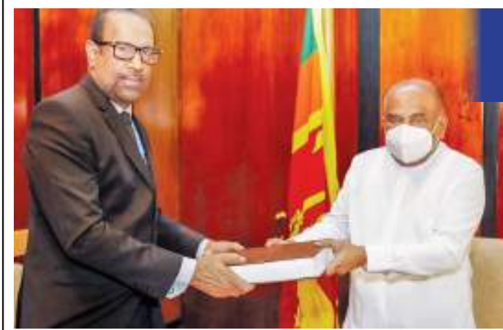
88 தொகுப்புக்களுடனான முழுமையான அறிக்கை சபாநாயகரிடம் கையளிப்பு

பாராளுமன்ற உறுப்பினர்களின் மேலதிக பரிசீலனைக்காக ஜனாதிபதியின் அறிவுறுத்தலுக்கமைய ஒப்படைப்பு