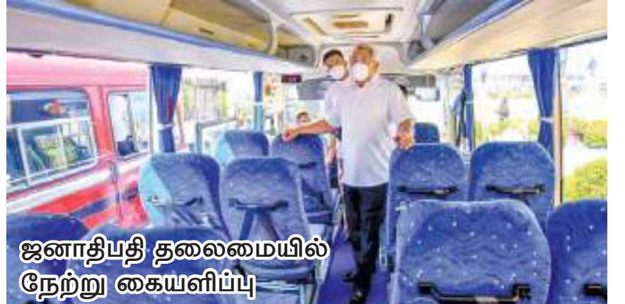
ஜனாதிபதி தலைமையில் நேற்று கையளிப்பு

பழுதடைந்த நிலையில் பயன்பாட்டிலிருந்து நீக்கப்பட்டிருந்த 200 பஸ்களை மறுசீரமைத்து மீண்டும் சேவையில் வளாகத்தில் நடைபெற்றது. இணைத்துக் கொள்ளும் நிகழ்வு, ஜனாதிபதி கோட்டாபாய ராஜபக்ஷ தலைமையில் நேற்று (22) ஜனாதிபதி அலுவலக வளாகத்தில் நடைபெற்றது. வாகன ஒழுங்குறுத்தலை,