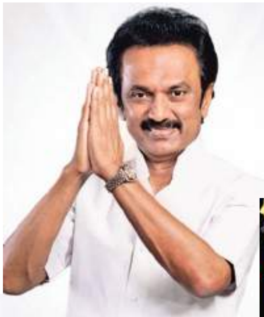
தேர்தலில் அ.தி.மு.க. முதல் முறையாக சென்னை மாநகராட்சியை கைப்பற்றியிருந்தது. தற்போது சென்னை மாநகராட்சி தி.மு.க வசம் வந்துள்ள நிலையில், மக்களால் தேர்ந்தெடுக்கப்பட்ட மாநகராட்சி உறுப்பினர்கள் அடுத்த மாதம் (மார்ச்) 4 ஆம் திகதி மாநகராட்சியின் மேயரை மறைமுக தேர்தல் மூலம் தேர்ந்தெடுக்க உள்ளனர். நாகர்கோவில் மாநகராட்சியாக தரம் உயர்த்தப்பட்ட பிறகு முதல் மேயர் பதவியை தி.மு.க கைப்பற்றி அசத்தியுள்ளது. தூத்துக்குடி மாநகராட்சியில் 60 வார்ட்

களில் தி.மு.க 50 வார்ட்களில் வென்று மாநகராட்சியை கைப்பற்றியுள்ளது. தூத்துக்குடி வெற்றிக்கு கனிமொழி எம்.பியும் ஒரு காரணம் ஆகும். அவரது தொடர் பிரசாரம் மக்களிடம் ஆட்சியின் சாதனைகளை கொண்டு சேர்த்துள்ளது என்பதற்கான அவதானிகள். தூத்துக்குடி மக்களுக்கும் கனிமொழிக்கும் இருக்கும் பாசப் பிணைப்பு அதிகம் உள்ளது. கவிஞர், எழுத்தாளர், இலக்கியவாதி, தமிழ் ஆர்வலர் ஆகியவற்றிலும் ஜொலித்த கனிமொழி, அரசியலிலும் அவரது செயல்பாடுகள் டெல்லி வரை கொடி கட்டியுள்ளது. கடந்த 2007 ஆம் ஆண்டு ராஜ்யசபா உறுப்பினராக முதல்முறையாக கனிமொழி ராஜ்யசபா எம்.பியாக நியமிக்கப்பட்டார். மீண்டும் 2013 ஆம் ஆண்டு இரண்டாவது முறையாக ராஜ்யசபாவுக்கு கனிமொழி தேர்வு செய்யப்பட்டார்.