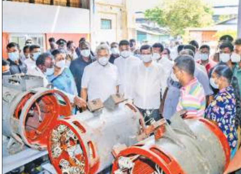
இலங்கை ரயில்வே திணைக்களத்துக்குச் சொந்தமான இரத்தமலாணை இயந்திரப் பொறியியல் தொழிற்சாலைக்கு நேற்று (24) ஜனாதிபதி கண்காணிப்பு விஜயம் மேற்கொண்டார். இதன்போது நிறுவனத்தின் ஊழியர்களுடன் ஜனாதிபதி உரையாடுவதை படத்தில் காணலாம்.

ஜனாதிபதியை சந்தித்து மகஜரையைளிக்க வந்ததாக தெரிவித்தமை முன்னரே திட்டமிடப்பட்ட ஒரு சதியே.. - ஜனாதிபதி செயலகம் அறிக்கை