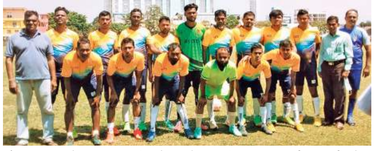
இலங்கை போக்குவரத்து சபையின் ஒழுங்கு செய்யப்பட்ட போக்கி வரத்துசபையின் பிராந்தியங்களுக்கு இடையிலான உதைபந்தாட்ட சுற்றுப் போட்டி கடந்த 16ம் திகதி கொழும்பு நாராஹேன்மீட்டி சாலிகா விளையாட்டு மைதானத்தில் இடம்பெற்றது.