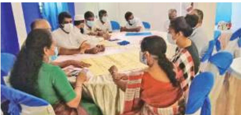
(வெலிகம தினகரன் நிருபர்)

வெலிகம பிரதேச சர்வமத குழு உருவாக் கப்பட்டு நான்கு வருடம் பூர்த்தியையொட்டி