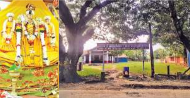
முளாய் ஸ்ரீ முத்துக்குமாரசுவாமி ஆலய பங்குனி உத்தர பகடி வருடபந்த மகோற்சவம் நானை மறுநாள் புன்கிழமை 9ஆவ்திகதி வாகையேற்றத்துடன் ஆரம்பமாகும் என்பதை அடியார்களுக்கு அறியத்தருவதாக ஆலய நிர்வாகத்தினர் தெரிவித்துள்ளனர்.

குருநகர் மீன்பிடி இறங்கு துறைக்கு சென்ற அமைச்சர் டக்ளஸ் தேவானந்தா, உள்ளூர் கிழமைவடி வலைத் தொழிலாளர்களினால் பயன்படுத்தப்படுகின்ற தொழில் உபகரணங்களை பார்வையிட்டார். கடந்த வாரம் கொழும்பில் ஆர்ப்பாட்டமொன்றினை முன்னெடுத்திருந்த கிழமைவடி வலைத் தொழிலாளர்கள், தமது தொழில் முறையினால் கடல் வளத்திற்கு பாதிப்பு ஏற்படாது என்று தெரிவித்ததுடன், தமக்கு நிரந்தர தொழில் அனுமதிக்களை வழங்குமாறும் கோரிக்கை முன்வைத்திருந்தனர்.