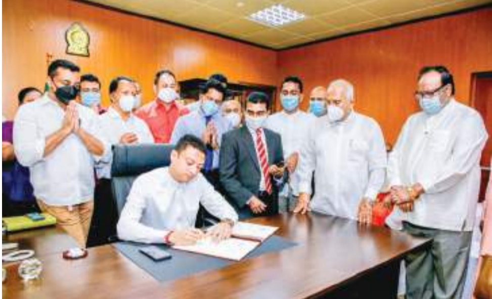
போக்குவரத்து அமைச்சர் திலும் அமுனும நேற்று (07) போக்குவரத்து அமைச்சில் கடமைகளை பொறுப்பேற்ற போது ...