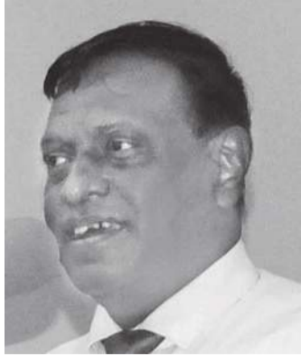
பாராட்டி கௌரவிக்கும் நிகழ்வில் பிரதம அத்தியாயக கலந்து கொண்டு