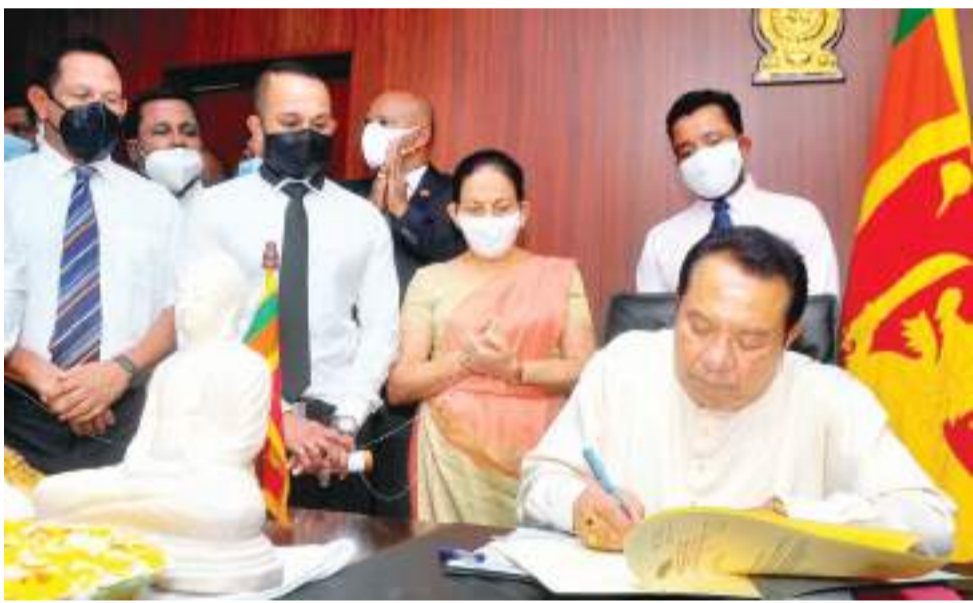
கைத்தொழில் அமைச்சராக நியமிக்கப்பட்டுள்ள எஸ்.பி.திசாநாயக்க நேற்று தமது அமைச்சில் கடமை களை பொறுப்பேற்ற போது...