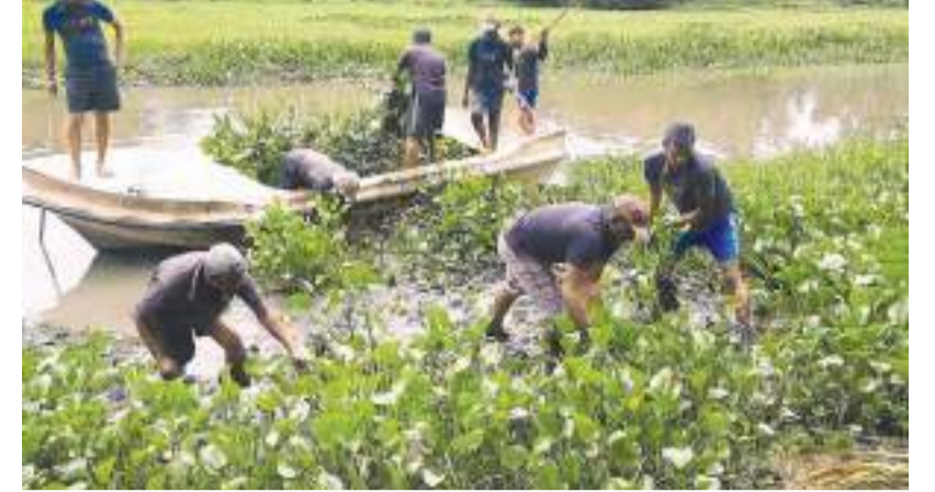
தோப்பூர் குறுப் நிபுணர்

ஜனாதிபதியின் பணிப்புரைக் கமைவாக ஆறுகளை பாதுகாப்போம் "சுரக்கும் கங்கா" எனும் தேசிய வேலைத்திட்டத்தின் கீழ் மாவிலாறு நீர்ப்பாசன பிரிவின்கீழ் உள்ள, கிளிவெட்டி ஆற்றில் உள்ள நீர்வாழைத் தாவரங்களை சேதப்படுத்தாதவாறு சீரமைப்பதற்காக பிரதிநிதித்துவப்படுத்தக்கூடிய நீர்வாழைத் தாவரங்களை பிரதிநிதித்துவப்படுத்தும் வேலைத் திட்டம் தீர்க்கும் கிழமை (07) கிளிவெட்டி ஆற்றில் முன்னெடுக்கப்பட்டது. இத்திட்டத்தின் கீழ், கிளிவெட்டி ஆற்றிலிருந்து மாவிலாறு ஆறு வரையிலான சுமார் 06 கிலோ மீற்றர் தூரமுள்ள நீர்வாழைத் தாவரங்கள் அகற்றப்படவுள்ளமை குறிப்பிடத்தக்கதாகும்.