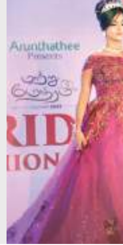
அலங்காரக் காட்சி பிரம்மாண்ட முழக்கத்தோடு யாழ் மண்ணில் அரங்கேற்றப் போகிறது. எதிர்பார்ப்புகளோடு வரும் அனைவரையும் பிரம்மாண்டத்திற்கு அழைத்துச் செல்லும் 'மாற்றுமோதிரம்' நிகழ்வு நிச்சயம் வருகை தரும் அனைவரையும் திருப்திபடுத்தும் மணப்பெண் எவ்வித ஊழமில்லை. யாழ் மண்ணில் இன்று அரங்கேற்றிக்கும் பிரம்மாண்ட மணப்பெண் அலங்காரக் காட்சியில் நீங்கள் இணைந்திருங்கள் என்று ஏற்பாட்டாளர்கள் தெரிவித்துள்ளனர்.

நாடளாவிய ரீதியில் தேர்ச்சி பெற்ற அழகுக்கலை நிகழ்ச்சிகளை அழைப்பதற்கு நடைபெறும் 'மாற்று மோதிரம்' மணப்பெண் அலங்காரக் காட்சி கடந்த ஜனவரி மாதம் கொழும்பில் நடைபெற்றதைத் தொடர்ந்து இம்மாதம் யாழ் மண்ணில் இன்றைய தினம் மாலை 4 மணிக் குழு செல்வம் பல்லம் மண்டபத்தில் வெகுவிமரிசையாக நடைபெறுகிறது. பல மாவட்டங்களிலிருந்தும் வருகை தரும் 50 இற்கும் மேற்பட்ட அழகுக்கலை நிகழ்ச்சிகளின் பங்கேற்போடு பல சிறப்பு அத்திகளும், பிரதம அத்திகளும் இந்நிகழ்வில் கலந்து சிறப்பிக்கவுள்ளனர். இன.மத.மொழி பேதமின்றி இந்த சமூகத்தில் சாதித்துக் கொண்டுக்கும் அழகுக்கலை நிகழ்ச்சிகள் அனைவரையும் கௌரவிக்கும் இம்மாற்றுமோதிரம் மணப்பெண் அலங்காரக் காட்சி அழகுக்கலை நிகழ்ச்சிகளுடன் இணைந்து பல்வேறு ஊடக, புலகப்பட, ஆடை அலங்கார மற்றும் அணுசுரணையாளர்களின் ஒத்துழைப்போடு தனித்துவமான நடைபெறவுள்ளது. ஏராளமான பார்வையாளர்களோடு பலரின் எதிர்பார்ப்புகளோடு இதுவரையில் எந்தவொரு திருமணசேவைகள் ஏற்பாடு செய்ய தீராத மணப்பெண் அலங்காரக் காட்சியை மக்களின் மனதை வென்றுள்ளது. பல எதிர்பார்ப்புகளோடு எதிர்பார்த்து காத்திருக்கும் யாழ் மக்களின் நல் ஆதரவோடும் அவர்களின் நன்மதிப்பை பெற்று மாற்றுமோதிரம் மணப்பெண்