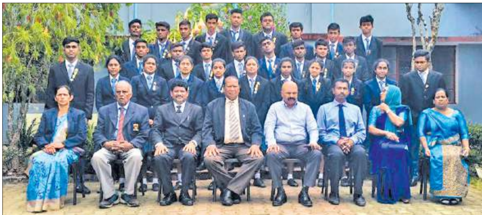
நுவரெலியா சர்வதேச ஆங்கில பாடசாலையில் மாணவ தலைவர்கள், தலைவிகள் தெரிவு செய்யும் நிகழ்வு நேற்று (9) புதன்கிழமை பாடசாலை மண்டபத்தில் நடைபெற்றது.

37 வயதுடைய ஒரு குழந்தையின் தந்தையாவார். அத்துடன் சந்தேகநபரை பொலிஸார் பரிசோதனை செய்த போது கைக்குண்டு ஒன்றும் ஹெரோயின் போதைப் பொருள் ஒரு பக்கட்டும் கைப்பற்றப்பட்டுள்ளன. மேற்படி மோட்டார் சைக்கிள்கள் மிகக் குறைந்த விலைக்கு விற்பனை செய்த நிலையில் மீட்கப்பட்டுள்ளன. இரண்டு மோட்டார் சைக்கிள்கள் வீட்டில் மறைத்து வைக்கப்பட்ட போது கைப்பற்றப்பட்டுள்ளன.