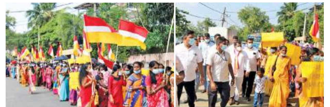
கல்லடி குறுப் நிபுணர்

சர்வதேச மகளிர் தினத்தை முன்னிட்டு தமிழ் மக்கள் விடுதலை புலிகள் கட்சியின் ஏற்பாட்டில், மாபெரும் விழிப்புணர்வு நடைபவனி யென்று செவ்வாய்க்கிழமை (08) மட்டக்களப்பில் முன்னெடுக்கப்பட்டது. தமிழ் மக்கள் விடுதலைப் புலிகள் கட்சியின் மகளிர் அணியின் ஏற்பாட்டில் இடம்பெற்ற இவ் விழிப்புணர்வு நடை பவனியில் சுமார் 1000 இற்கு மேற்பட்டோர் கலந்து கொண்டனர். மட்டக்களப்பு காந்தி பூங்கா முன்றலில் இருந்து ஆரம்பமாகிய