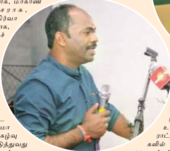
நாடளாவிய ரீதியில் உள்ள நாடாட்சி சபைகளில் தற்போது 27 அங்கத்தவர்களை கொண்டிருப்பது வரலாற்றில் பெருமையே. எமது கிளை பணிம