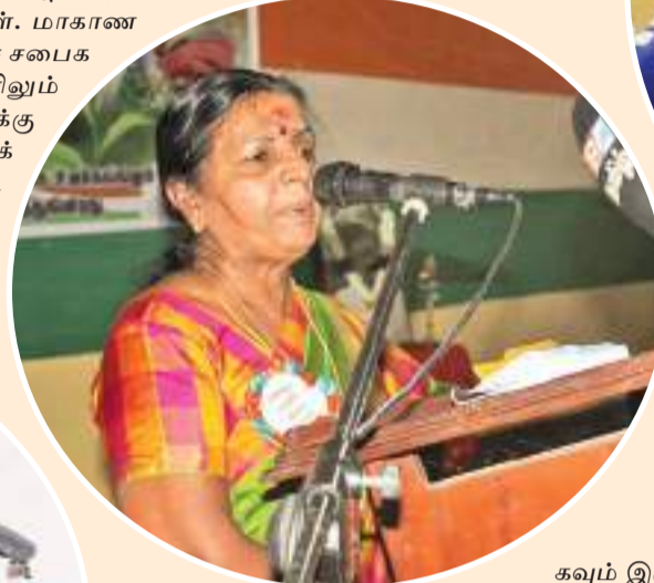
கவும் இருப்பது பெருமைத்தக்க கடிய விடயமாகும்.