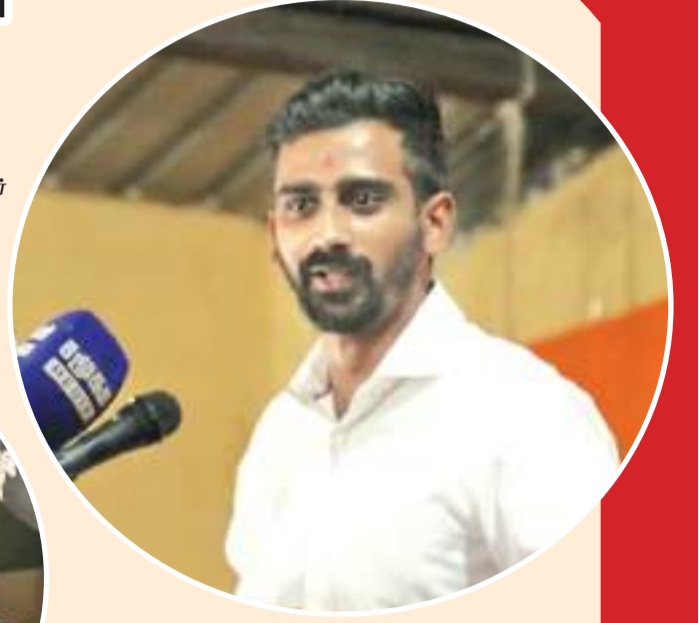
சபையின் தலைவர்கள், உறுப்பினர்கள், மாவட்ட மகளிர் தலைவிகள், மகளிர் அணி நிர்வாக சபை பெண் உறுப்பினர்கள், பிரதேச சபை பெண் உறுப்பினர்கள், பெருந்தோட்ட சேவையாளர்களாக பணிபுரியும் பெண் உத்தியோகஸ்தர்கள், பல்வேறு தொழில்துறைகளில் ஈடுபட்டுள்ள மகளிர் அமைப்புகள் இதில் பங்கேற்றனர்.