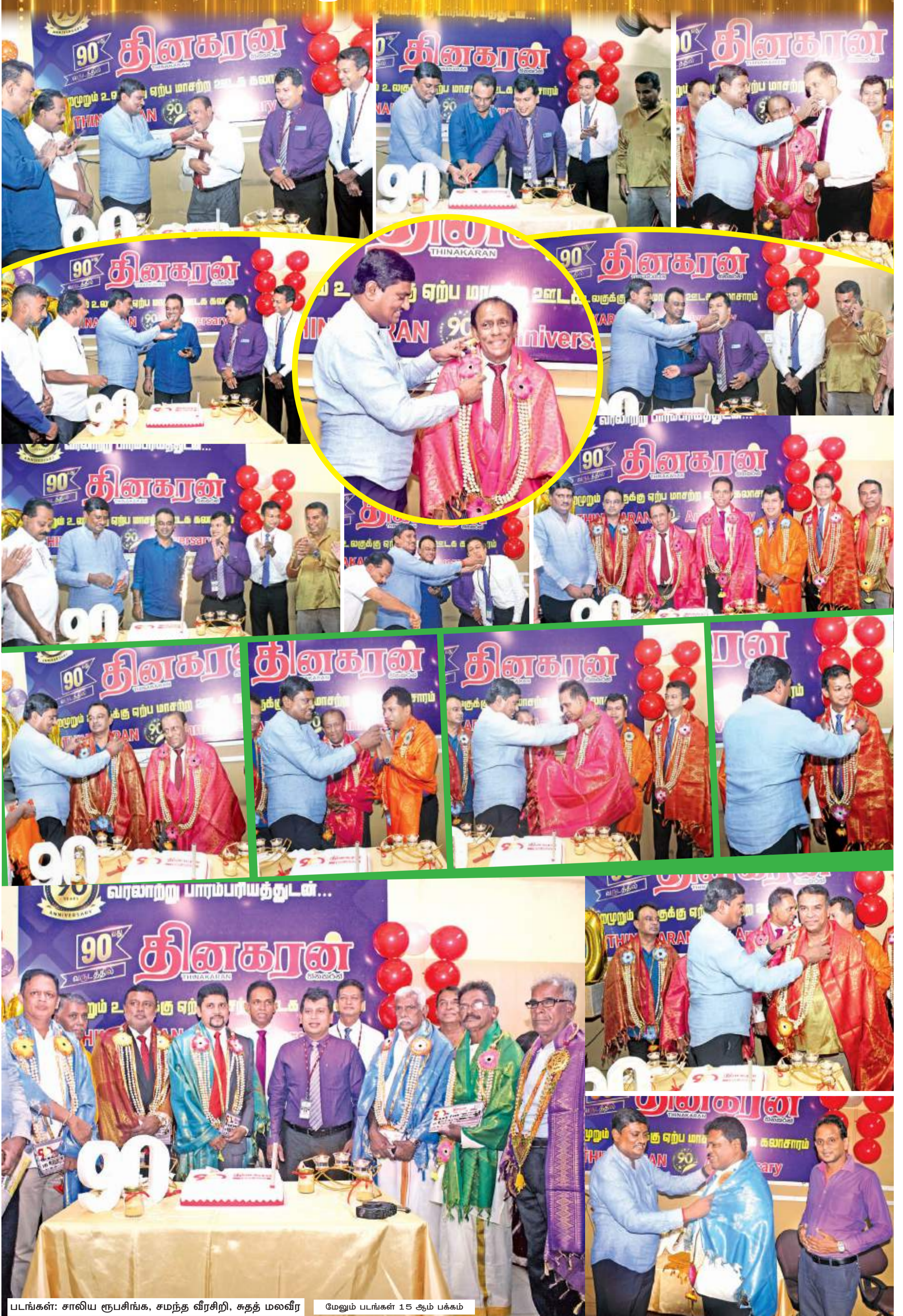
படங்கள்: சாலிய ரூபசிங்க, சமந்த வீரசிறி, சுதத் மலவீர