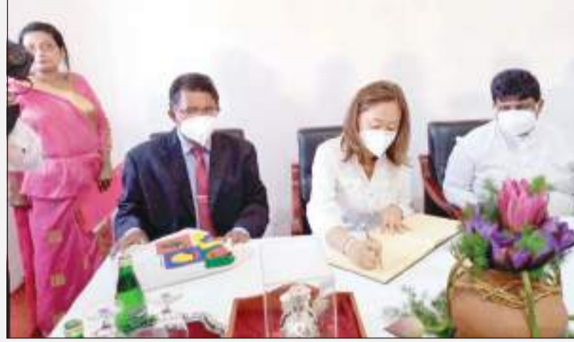
விஜயம் மேற்கொண்டார். இங்கு உரையாற்றிய அவர், கலாசாரங்கள் மற்றும் நாகரிகங்களை பாதுகாப்பதில், அமெரிக்கா கவனம் செலுத்தும். அந்தவகையில் இலங்கையிலுள்ள சில,

கண்டிக்கு விஜயம் மேற்கொண்டிருந்த அமெரிக்கத் தூதுவர் நேற்று (15) கண்டி ஸ்ரீதலதா மானிகைக்கு