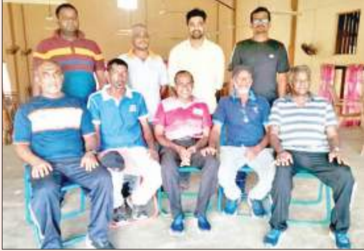
விளையாட்டு அமைச்சினால் ஏற்பாடு செய்யப்பட்டு கடந்த (12) சம்மரத்துறையில் நடைபெற்ற மாவட்ட மட்ட கரம் மற்றும் மேசைப்பந்து போட்டிகளில் அக்கரைப்பந்து சன்றைஸ் விளையாட்டுக் கழகம் இவ்விரு போட்டிகளிலும் வெற்றி பெற்றது. வெற்றி பெற்ற வீரர்களை படங்களில் காணலாம்