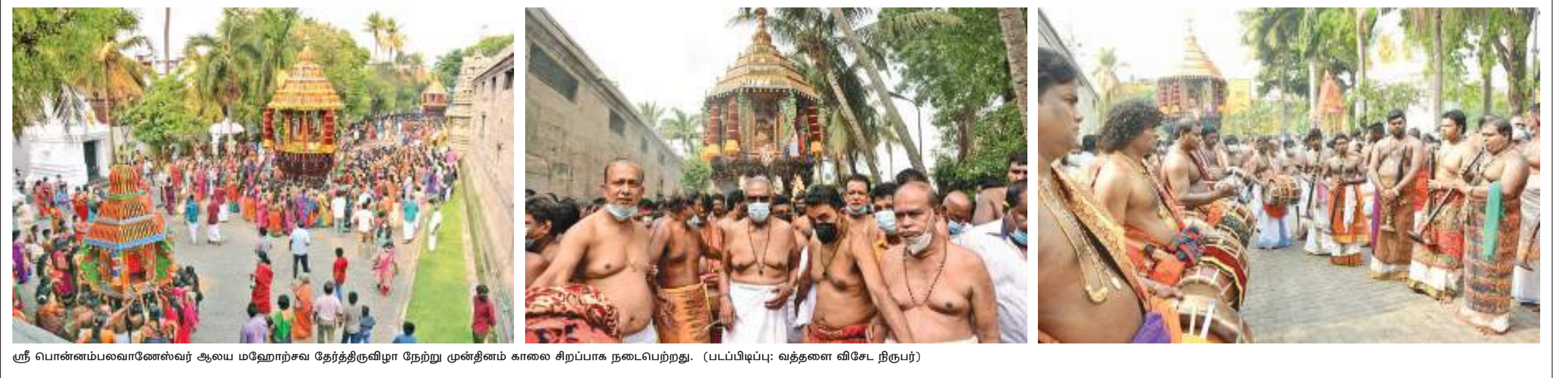
ஸ்ரீ பொன்னம்பலவாணேஸ்வர் ஆலய மஹோற்சவ தேர்த்திருவிழா நேற்று முன்தினம் காலை சிறப்பாக நடைபெற்றது.