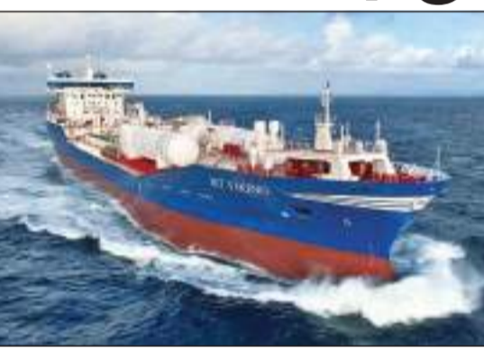
தமும் தற்போது நாட்டில் நிலவும் எரிபொருள் தட்டுப்பாட்டுக்கு தீர்வு கிட்டுமென என்றும் அவர் தெரிவித்துள்ளார். நாட்டில் தற்போது நிலவும்

நாட்டில் நிலவும் எரிபொருள் தட்டுப்பாடு எதிர்வரும் இரண்டு தினங்களில் முற்றாக நீங்கும் பெற்றோலியக் கூட்டுத்தாபனம் தெரிவித்துள்ளது. இலங்கை- இந்திய கடனுதவித் திட்டத்தின் கீழ் இலங்கைக்கு கிடைக்கவுள்ள முதலாவது தொகை டீசல் நாளை ஞாயிற்றுக்கிழமை நாட்டை வந்தடையுமென கூட்டுத்தாபனத்தின் உயரதிகாரி ஒருவர் நேற்று தெரிவித்தார். எரிபொருளை தாங்கிய கப்பல் குடியேற்றுகிழமை கொழும்பு துறைமுகத்தை வந்தடையுமென தெரிவித்துள்ள அவர், அந்தக் கப்பலில் 40 ஆயிரம் மெற்றிக் தொன் டீசல் காணப்படுவதாகவும் அந்த டீசல் கப்பலிலிருந்து விடுவிக்கப்பட்டு பகிர்த்தளிப்பு நடவடிக்கைகள் ஆரம்பித்