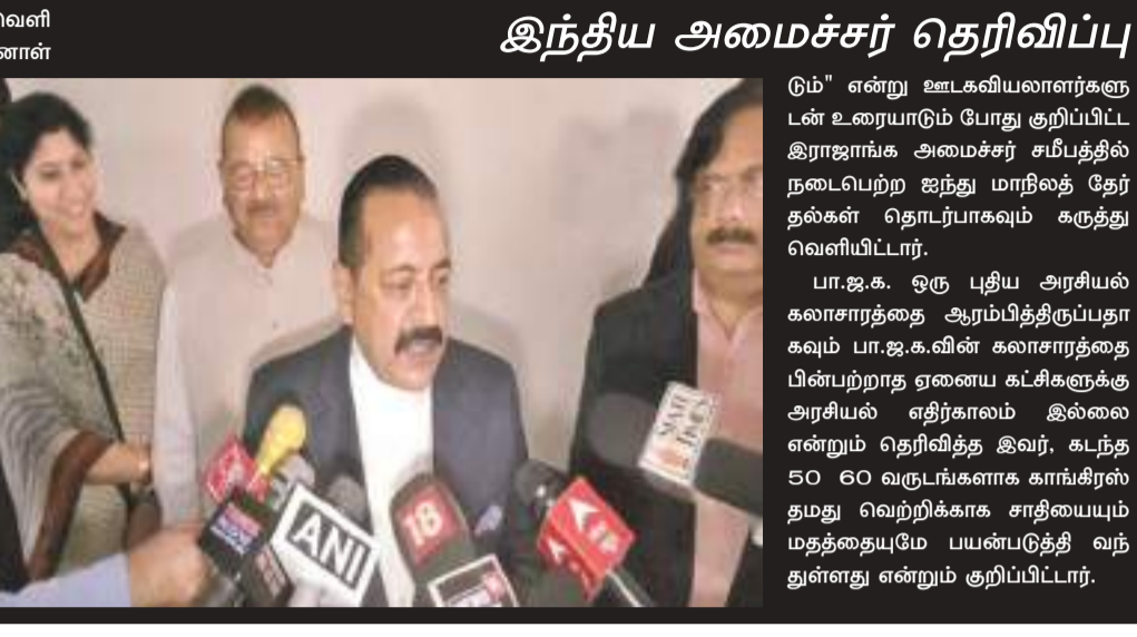
இந்திய அமைச்சர் தெரிவிப்பு

ஜம்முவில் அமைக்கப்பட்டுள்ள விண்வெளி நிலையத்துக்கு இஸ்ரோவின் முன்னாள் தலைவர் சதீஷ் தவானின் பெயர் சூட்டப்படும் என்று விஞ்ஞான தொழில்நுட்பத் துறைக்கான இராஜாங்க அமைச்சர் ஜதேந்திர சிங் தெரிவித்துள்ளார். "சதீஷ் தவான் ஜம்மு காஷ்மீரைச் சேர்ந்தவர் என்பது பலருக்குத் தெரியாது. அவரது பெயரைச் சூட்டுவதற்கு உடனடி நடவடிக்கை எடுக்கப்படுகிறது. தனியார் பங்களிப்புடன் மேலும் விண்வெளி தொழில்நுட்ப ஆய்வு நிலையங்களை அமைத்துள்ளோம். திருவானந்தபுரத்தைடுத்து இரண்டாவது நிலையம் ஜம்முவினிலேயே அமைக்கப்பட்டுள்ளது. விமானவியல் மற்றும் விண்ணியல் துறைகளில் உயர் கற்கைகள் இவ்வூடும் ஆரம்பிக்கப்ப