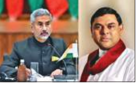
ஆக்கபூர்வமாக கலந்துரையாடல் இடம் பெற்றுள்ளது. இதன்போது இலங்கை மக்களின் தேவைகளுக்கும், நிலைப்பாடுகளுக்கும் இந்தியா தொடர்ந்து மதிப்பளித்து வருகிறது என இந்திய வெளியுறவு துறை அமைச்சர் நிதியமைச்சர் பஷில் ராஜபக்ஷவிடம் குறிப்பிட்டுள்ளார். இந்திய வெளிவிவகாரத்துறை அமைச்சின் செயலாளர் ஹர்ஷ்வர்தன் ஸ்ரீங்காவிற்கும் நிதியமைச்சர் பஷில் ராஜபக்ஷவிற்றும் இடையிலான சந்திப்பின் போது, கொவிட் தாக்கத்தின் பின்னரான காலப்பகுதியில் இலங்கையின் பொருளாதார நிலைமை, கொவிட் பெருந்தொற்று கட்டுப்பாடு உள்ளிட்ட விடயங்கள் குறித்து கலந்துரையாடல் செய்யப்பட்டது.

இலங்கை மக்களின் தேவைகளுக்கும், நிலைப்பாடுகளுக்கும் இந்தியா தொடர்ந்து மதிப்பளித்து வருகிறது என இந்திய வெளியுறவு துறை அமைச்சர் நிதியமைச்சர் பஷில் ராஜபக்ஷவிடம் குறிப்பிட்டுள்ளார். நிதியமைச்சர் பஷில் ராஜபக்ஷவிற்றும், இந்திய வெளிவிவகாரத்துறை அமைச்சர் கலாநிதி எஸ்.ஜெயசங்கருக்கும் இடையிலான சந்திப்பு நேற்று முன்தினம் இரவு புதுடெல்லியில் இடம்பெற்றது. இலங்கைக்கும் இந்தியாவிற்கும் இடையிலான இருதரப்பு பொருளாதார பங்காளித்துவம் குறித்து