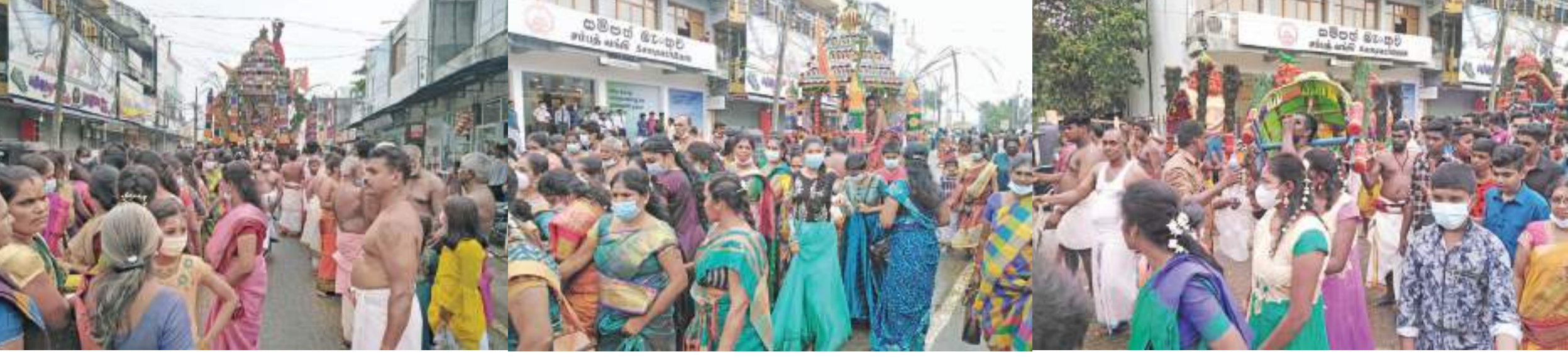
கல்முனை சந்தான ஈஸ்வரர் சிவன் கோயில் வருடாந்த மகோற்சவ தேர் திருவிழா வெள்ளிக்கிழமை (18) நடைபெற்றது. பக்தர்கள் வடம் பிடித்து கல்முனை நகர் ஊடாக தேர் இழுத்து வரப்படுவதை படத்தில் காணலாம்.

களில் சிகிச்சை வழங்கும் நடைமுறை மற்றும் பாதிக்கப்பட்ட மக்களுக்கு மனிதாபிமான உதவிகள் வழங்கும் செயற்பாடுகள் போன்றன செயல்முறை ஊடாக மக்களுக்கு தெளிவுபடுத்தப்பட்டமை குறிப்பிடத்தக்கது.