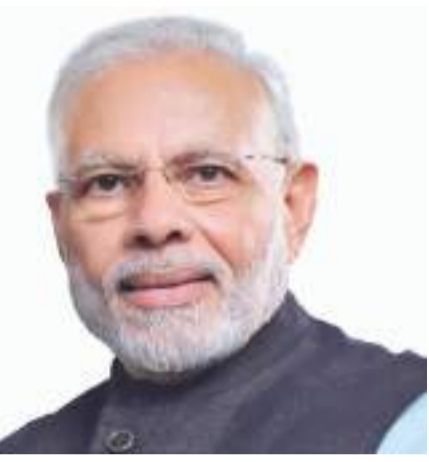
இந்தியா வழியாக நான்கு மாணவர்களும் காட்மண்டு வந்து சேர்ந்தனர். இதற்காக பிரதமர் மோடிக்கு நன்றி தெரிவிப்பதாக நேபாள பிரதமர் ஷர் பகதார் தோபா தெரிவித்துள்ளார்.

உக்ரைனில் சிக்கியிருந்த நேபாள மற்றும் வங்கதேச மாணவர்களை ஓபரேஷன் கங்காவின் மூலம் மீட்டுத் தந்தமைக்காக அந்நாடுகளின் பிரதமர்கள் பாரதப் பிரதமர் நரேந்திர மோடிக்கு நன்றி தெரிவித்துள்ளனர். உக்ரைனில் உள்ள இந்தியர்களை மீட்டு வருவதற்காகவே இந்தியா இந்த மீட்டும் பணியை ஆரம்பித்தது. இதுவரை இருபதாயிரம் பேருக்கு மேற்பட்டோர் விமானங்கள் மூலம் மீட்கப்பட்டுள்ளனர். இவர்களில் நான்கு நேபாள மாணவர்களும் ஒன்பது வங்கதேச மாணவர்களும் அடங்குவர்.