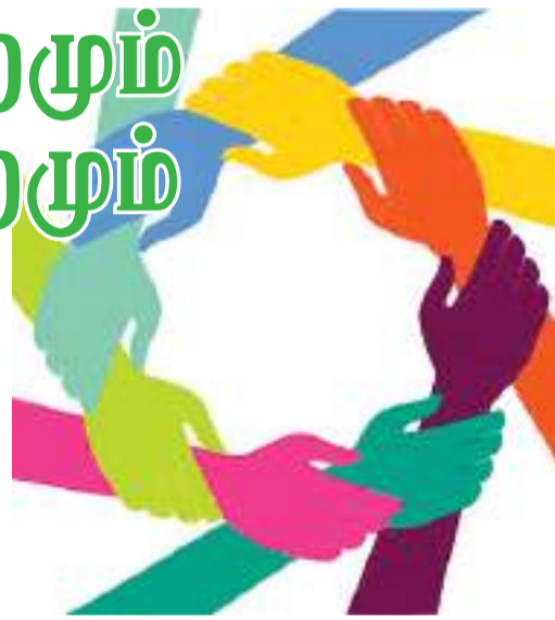
விலை வாசி ஏற்றத்தால் அரைவாசியும் அழிகிறது நாளுக்கு நாள்.

ஆசியாவின் அதிசயமாக காண்போரைக் கவர்ந்திழுத்தது. உல்லாசம் வருவோரை வரவேற்று வாழ்த்தியது அன்று. கொரோனாவின் கோர்ப்பிடியில் தன்னை வீழ்த்தியது இன்று. தொலைபேசியில் தொலை தூரம் செல்லும் நாடுகளுக்கு மத்தியில்