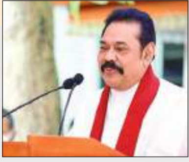
அனைவரும் அனுபவிக்கின்றோம். இதை எமக்கு ஆணை வழங்கிய 69 இலட்சம் மக்களும் புரிந்துகொள்வார்கள் எனவும் பிரதமர் குறிப்பிட்டுள்ளார். தற்போதைய நெருக்கடி நிலைமைக்கு விரைவில் தீர்வு காணப்படும். ஜனாதிபதி இதில் உறுதியாகவுள்ளார் எனவும் பிரதமர் சுட்டிக்காட்டியுள்ளார்.

ஆட்சியை கவிழ்க்க படாதபாடுபடும் எதிர்ணியினரால் போராட்டங்களை முன்னெடுப்பதன் ஊடாக ஆட்சியை கவிழ்க்க முடியாதென தெரிவித்த பிரதமர் மஹிந்த ராஜபக்ஷ, நாட்டின் தற்போதைய நெருக்கடி நிலைமைக்கு எமது அரசு காரணம் அல்ல எனவும் தெரிவித்தார். எதிர்க்கட்சியினரால் முன்னெடுக்கப்பட்டு வரும் தொடர் போராட்டங்கள் குறித்து கருத்து வெளியிடும் போதே பிரதமர் மஹிந்த ராஜபக்ஷ இந்த விடயத்தைக் குறிப்பிட்டுள்ளார். ஆட்சியைக் கவிழ்க்க எதிர்ணியினர் படாதபாடுபடுகின்றனர். அவர்கள், தமது ஆதரவாளர்களை பஸ்களில் ஏற்றிவந்து ஜனாதிபதி செயலகத்தை முற்றுகையிட வைத்துள்ளனர். இதனால் என்ன பயனை அவர்கள் அடைந்தார்கள் எனவும் பிரதமர் கேள்வி எழுப்பியுள்ளார். எதிர்ணியினர், ஜனாதிபதியின் செயலகத்தை முற்றுகையிட்டுப் போராட்டம் செய்வதால் எமது ஆட்சியைக் கவிழ்க்க முடியாது. ஏனெனில், 69 இலட்சம் மக்களின் ஆணையுடனேயே இந்த ஆட்சி அமைக்கப்பட்டது. இதை எதிர்ணியினர் கவனத்தில் கொள்ள வேண்டும் எனவும் பிரதமர் தெரிவித்துள்ளார். நாட்டின் தற்போதைய நெருக்கடி நிலைமைக்கு எமது அரசு காரணம் அல்ல. தற்போதைய எதிர்ணியினர் தான், கடந்த ஆட்சியில் நல்லாட்சி என்ற பெயரில் நாட்டைச் சீரழித்தனர். அதன் விளைவுகளை இன்று