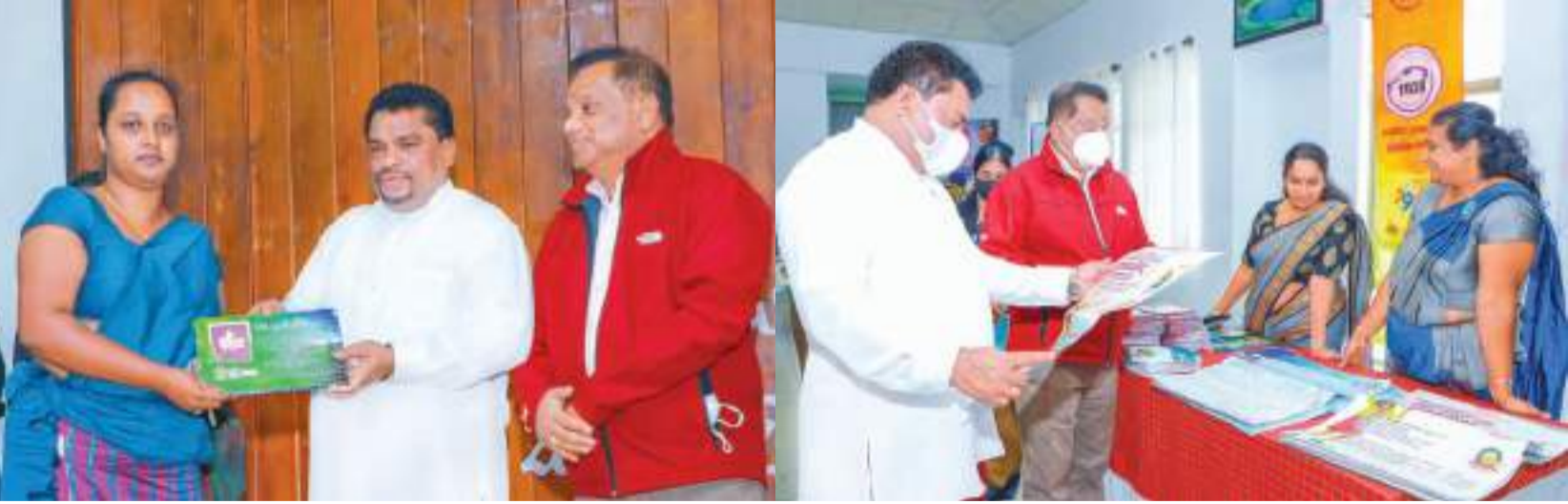
2022 ஆம் ஆண்டுக்கான மகனீர் தின தேசிய நிகழ்ச்சித் தொடரின் நூவரெவியா மாவட்ட நிகழ்வு ராஜாங்க அமைச்சர் பியல் நிஷாந்தனின் தலைமையில் நூவரெவியா செயலகத்தில் நடைபெற்றது. இதன் போது பெண்களுக்கு வேலை வாய்ப்பு, சுயதொழில் உதவி, கல்வி மற்றும் ஊக்கமளிக்கும் நோக்கிலான 'திரிய கத்துன்' இதழ் வெளியிடப்பட்டதோடு 25 பெண்களுக்கு கௌரவமும் வழங்கப்பட்டது. இந்த நிகழ்வில் அமைச்சர் சி.பி. ரத்னாயக்கவும் கலந்து கொண்டார்.