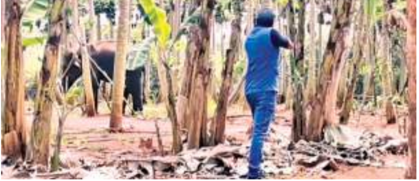
ஓமந்தை விசேட நிருபர்

வவுனியா ஆச்சிபுரம் பகுதியில் பப்பாசி கோட்டத்திற்குள் நுழைந்த யானைக்குட்டி ஒன்று மீண்டும் காட்டிற்கு செல்ல முடியாத நிலையில் தவித்து வருகின்றது. கோட்டத்திற்குள் நுழைந்த 6 வயது மதிக்கத்தக்க யானைக் குட்டி உணவருந்த முடியாத நிலையில், அங்கும் இங்கு திரிந்துகொண்டிருப்பதை காணமுடிந்தது. இதேவேளை யானையினை பார்வையிட சென்ற மக்களை துரத்தி அச்சமடைய வைத்துள்ளது. இதனை தொடர்ந்து பிரதேசவாசிகள்