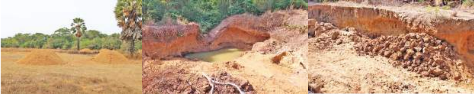
பரந்தன் குறாப் நிருபர்

விவசாய நிலங்கள், நீர்பாசன கால்வாய்களுக்கு பெரும் பாதிப்பு