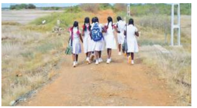
பரந்தன் குறாப் நிருபர்

கண்டாவளை பிரதேச செயலக பிரிவுக்குட்பட்ட தட்டுவன் கொட்டி பிரதேசத்தில் 117 குடும்பங்கள் அடிப்படை வசதிகள், போக்குவரத்து வசதிகள் இன்மையால் பல்வேறு சிரமங்களை எதிர்நோக்கி வருவதாக பிரதேச மக்கள் தெரிவித்துள்ளனர்.