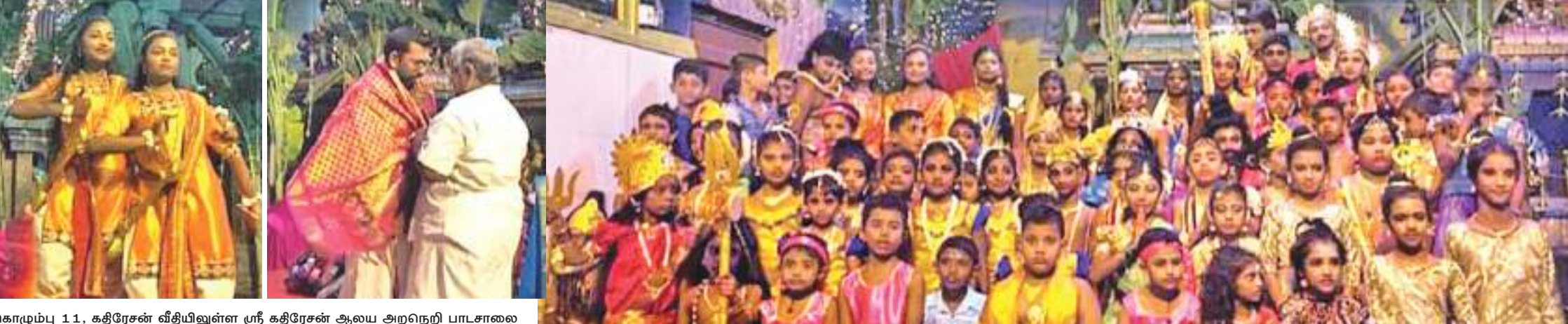
கொடும்பு 1.1, கதிசேசன் வீதியிலுள்ள ஸ்ரீ கதிசேசன் ஆலய அறநெறி பாடசாலை

பண்டிட் ஸ்ரீ ராம் சர்மா ஆச்சார்யா தமிழில்: ஸ்ரீ லக்ஷி சுமனன்