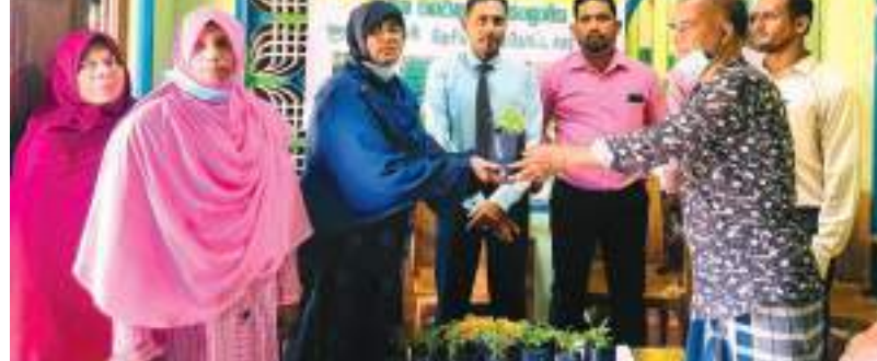
(பெரியநீலாவணை விசேட நிருபர்)

பொருளாதார சவால்களுக்கு முகங்கொடுத்துள்ளனர் உணவுஉற்பத்தியை உயர்த்துவதற்காக வீடுகளின் மட்டத்தில் பொதுமக்களின் பங்களிப்பை பெற்று தேசிய கொள்கை அமுல்படுத்தி, நக்சுநற மரக்கன்றுகள், பழவகைகள், கீரை வகைகள், கிழங்கு வகைகள் உள்ளிட்ட பயிர்களை தத்தமது வீட்டுத்தோட்டத்திலிருந்தே பெற்றுக் கொள்ளலாம். கல்முனைக்குடி சமுர்த்தி வங்கி வலய பிரிவில் தெரிவு செய்யப்