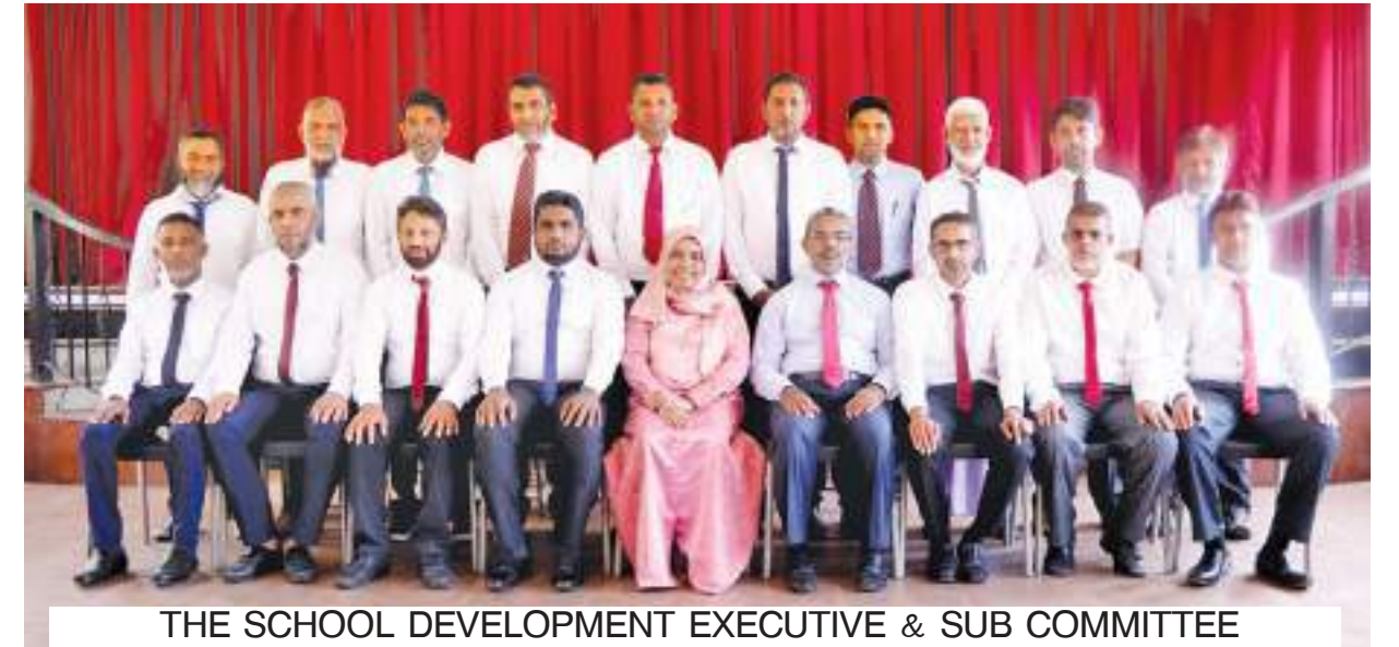
THE SCHOOL DEVELOPMENT EXECUTIVE & SUB COMMITTEE