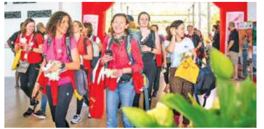
மிகவும் எதிர்பார்க்கப்பட்ட Raid Amazones 2022 அட்வென்ச்சர் சவாலின் இரண்டாம் கட்டம் 214 பங்கேற்பாளர்களுடன் ஆரம்பமானது. இதில் 214 பெண்கள் இலங்கையைச் சுற்றி சைக்கிள் சவாரி மற்றும் ஓட்டம் மூலம் பயணம் செய்ய உள்ளனர். மார்ச் 28 முதல் ஏப்ரல் 6 வரை சிசிரியாவில் நடைபெறும். இதில் பங்கேற்கும் வெளிநாட்டு வீரர்களுக்கு பாரம்பரிய கலாசார பொழுதுபோக்குகளுடன் வரவேற்பு அளிக்கப்பட்டது.

Great Place to Work இனால் மற்றும் மொகு மிகச் சிறந்த பணியிடத்திற்கான விருது வழங்கி கௌரவிக்கப்பட்டிருக்கின்றோம். நிறுவனம் ஒன்றாக நாங்கள் தொடர்ச்சியாக வளர்ச்சியடைந்து அபிவிருத்திப் பாதையில் பயணிக்க வேண்டியிருப்பதால் எங்களுடைய ஊழியர்களுக்கு மிகச்சிறந்த தவறற்ற வழங்குவதில் நாங்கள் மிகவும் கவனம் செலுத்துகின்றோம். பணியமர்த்தப்படும் எங்கள் ஊழியர்களுக்கு மிகவும் மகிழ்ச்சியான மற்றும் நேர்மறையான பணியிடத்தை உறுதிப்படுத்துவதில் AIA இன்ஷூரன்ஸ் உண்மையில் நம்பிக்கை தெரிவிக்கின்றது. எங்கள் ஊழியர்கள் மத்தியில் காணப்படும் ஒரு பொதுவான நோக்கம், தீவிரமான ஆர்வம், மற்றும் தீர்மானம் Great Place to Work ஒன்றாக AIA இன்ஷூரன்ஸ் வரையறுக்கின்றது என்றார்.