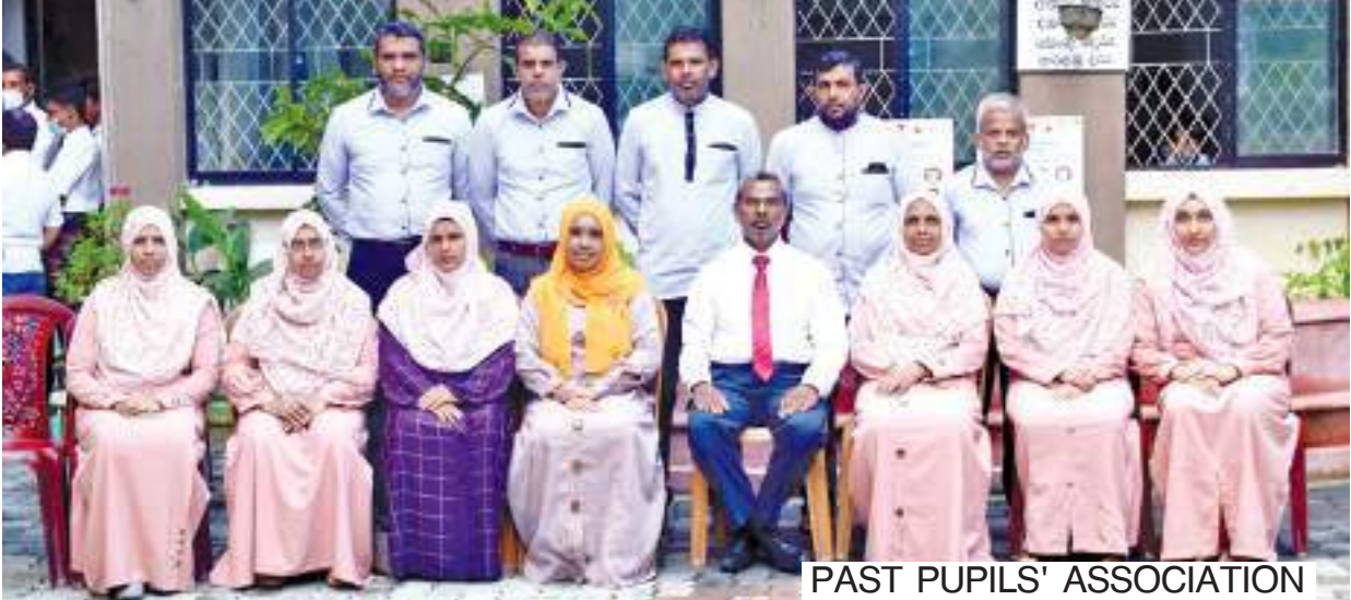
PAST PUPILS' ASSOCIATION

உலக வங்கியின் அனுசூலையுடன் மேற்கொள்ளப்படும் GEPM எனப்படும் பொதுக்கல்வி நலமையமாகக் கள் நிகழ்ச்சித்திட்டத்தில் மேற்பார்வைக்குரிய மாதிரிப் பாடசாலையாக உள்வாங்கப்பட்டிருப்பது விஷேட அம்சமாகும். இத்திட்டத்தின் கீழ் விஷேடமாக கணிதப்பாடத்தின் அபிவிருத்திக்கு முக்கியத்துவம் அளிக்கப்பட்டுள்ளது. அத்துடன் மத்திய மாகாணத்தின் SBPTD எனப்படும் பாடசாலை மட்ட ஆசிரியர் தொழில்சார் வான்மை அபிவிருத்தி நிகழ்ச்சித்திட்டத்திற்கு தெரிவு செய்யப்பட்டுள்ள 25 பாடசாலைகளுள் ஒன்றாகத் திகழ்வது சிறப்பம்சமாகும். மேலும் SESIP எனப்படும் 2ஆம் நிலைக்கல்வி பகுதிசார் மேம்பாட்டுத்திட்டத்தின் கீழ் இப்பாடசாலை தெரிவு செய்யப்பட்டுள்ளது.