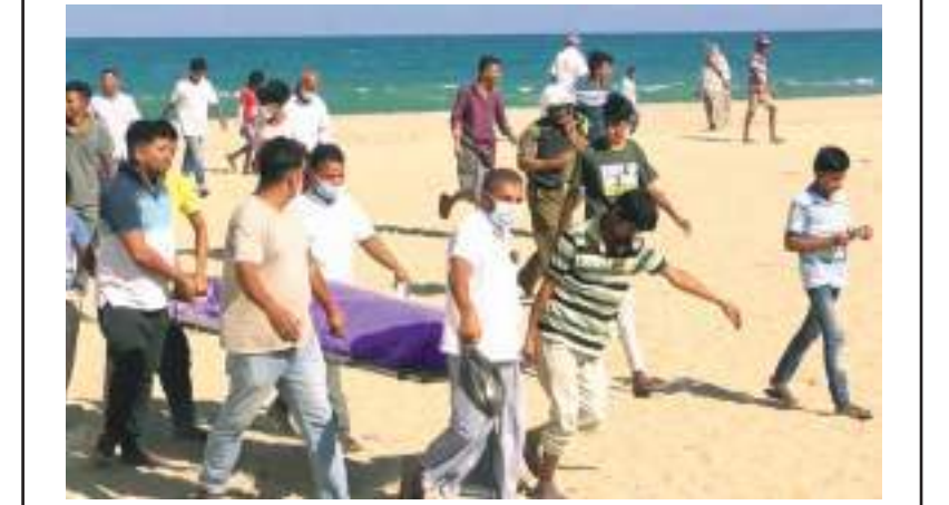
(அட்டாளச்சேனை தினகரன், அக்கரைப்பற்று மேற்கு தினகரன் நிருபர்கள்)

அக்கரைப்பற்று கடற்கரைப் பிரதேசத்தில் மீன்பிடித் தொழிலில் ஈடுபட்டிருந்த மீனவர்களின் வலையில், இனந்தெரியாத நபரொருவரின் சடலமொன்று செவ்வாய்க்கிழமை (29) மீட்கப்பட்டதாக அக்கரைப்பற்று பொலிஸார் தெரிவித்தனர். அக்கரைப்பற்று கடற்கரைப் பிரதேசத்தில் வழமை போன்று கரைவலை மீன்பிடி நடவடிக்கையில் ஈடுபட்டிருந்த போதே, குறித்த சடலம் மீனவர்களின் வலையில் அகப்பட்டதாக தெரிவிக்கப்படுகின்றது. கரைவலை மீனவர்கள் தமது பரிசோதனை மேற்கொண்டதன் மீன்னர் சடலத்தினை அடையாளம் காண்பதற்காக அக்கரைப்பற்று ஆதார வைத்தியசாலையின் அறிந்த மீனவர்கள், சடலத்தினை கரைக்கு ஒதுக்கியுள்ளனர். கரை