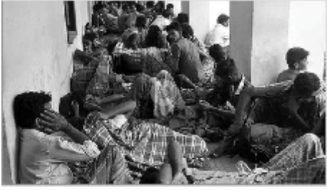
தற்காக அபராதம் செலுத்த வேண்டும்.

பல ஏதிலிகள் தாயகம் திரும்ப அல்லது தங்கள் உறவினர்களைப் பார்க்க விரும்பினாலும், அவர்கள் செலுத்த வேண்டிய அபராதத் தொகை மிக அதிகமாக உள்ளது.