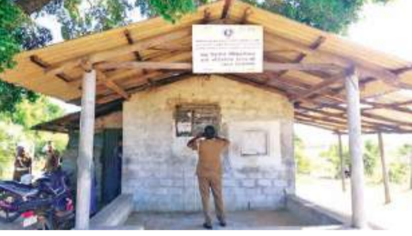
மன்னார் குரூப் நிருபர்

மன்னார் மாந்தை மேற்கு பிரதேச செயலாளர் பிரிவுக்குட்பட்ட வேட்டையாழ்றிப்பு கிராமத்தில் அமைந்துள்ள 'கள்' விற்பனை நிலையத்தை இடமாற்ற கோரி மக்கள் நேற்று சூரியநேர்க்கிழமை (11) காலை கவனப்படுத்துகின்றனர். ஒன்றை முன்னெடுத்தனர்.