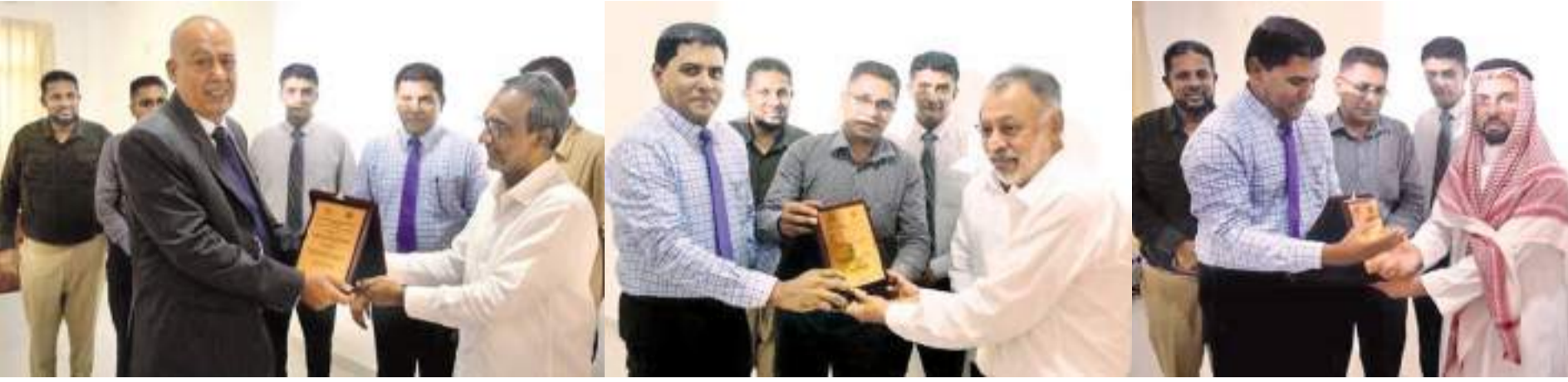
(மாவத்தகம் தினகரன் நிருபர்)