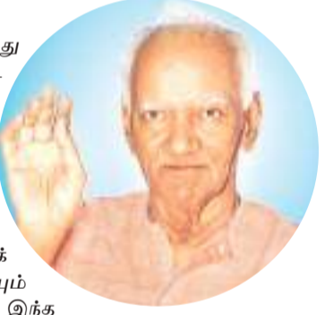
கொண்ட வியாச முனிவர் பின் வருமாறு கூறுகிறார்.