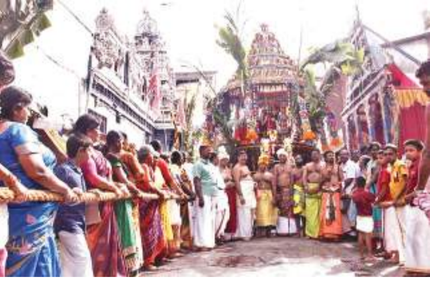
பட்டிப்பிட்டி, மொஹமட் நசார், கொழும்பு வடக்கு நிருபர்