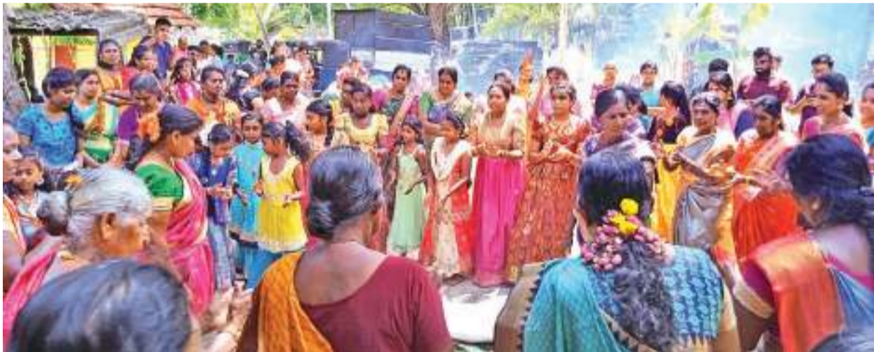
சிவாபம் திமிலை கண்ணகி அம்மன் ஆலயத்தின் வருபாந்த உற்சவத்தில் பொங்கல், மஞ்சள் நீரால், கரகம் நிகழ்வு (8) இடம்பெற்ற போது பக்தர்கள் பலர் கலந்துகொண்டனர்.