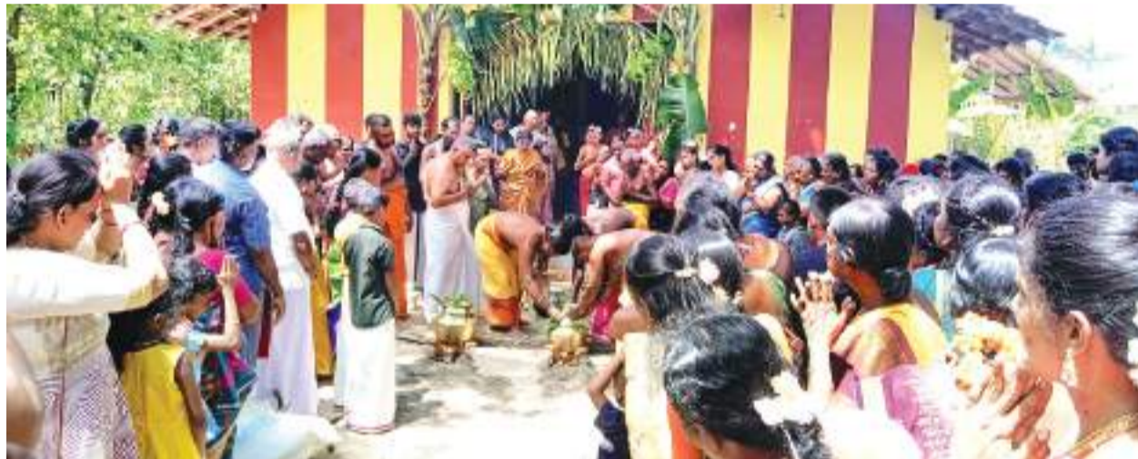
உடப்பு குறாப் நிருபர்