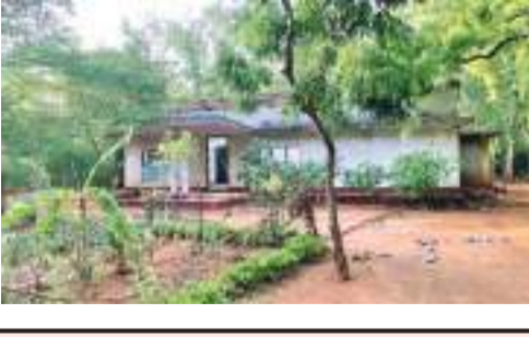
பின்னர் அவர்களது காணிகள் மீள் கிடைக்கவுள்ளமை மக்களுக்கு மகிழ்ச்சியை ஏற்படுத்தியுள்ளது.

யாழ்ப்பாணம் காங்கேசன்துறை மாங்கொல்லை வரைவர் ஆலயம் மற்றும் அதனை சூழவுள்ள சில பகுதிகள் 33 வருடங்களின் பின்னர் உரிய மக்களிடம் மீள்கையளிக்கப்படவுள்ளது. கடந்த 33 வருட காலமாக உயர் பாதுகாப்பு வலயமாக J/ 233 கிராம சேவையாளர் பகுதியில் உள்ள மாங்கொல்லை வரைவர் ஆலயமும் அதனை சூழவுள்ள தனியார் காணிகளில் இருந்து இராணுவத்தினர் வெளியேறியுள்ளனர். அதேவேளை சொந்த நாட்டிலேயே அகதியாக இடம்பெயர்ந்து பல்வேறு கஷ்டங்களுக்கு மத்தியில் வாழ்ந்துவந்த J/ 233 கிராம சேவையாளர் பகுதி மக்களுக்கு மூன்று தசாப்தங்களின்