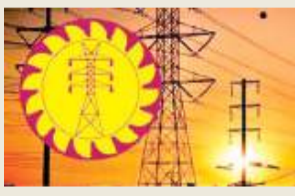
படுத்தும் நுகர்வோருக்கான கட்டணத்தை 1.3 சதவீதத்தால் குறைப்பதற்கு யோசனை முன்வைக்கப்பட்டுள்ளதாக தெரிவிக்கப்பட்டுள்ளது.

எதிர்வரும் ஜூலை மாதம் மேற்கொள்ளப்படவுள்ள மின்கட்டண திருத்தத்தின் போது மின்கட்டணம் குறைக்கப்படவுள்ள அளவு தொடர்பில் இலங்கை மின்சார சபை யோசனைகளை முன்வைத்துள்ளது. இந்த நிலையில், பொதுப் பயன்பாடுகள் ஆணைக்குழு குறித்த யோசனைகளை வெளிப்படுத்தியுள்ளது. இதற்கமைய, 0 - 30 வரையான மின்சார அலகுகளை பயன்படுத்தும் நுகர்வோருக்கான மின் கட்டணம் 26.9 சதவீதத்தாலும் 31 முதல் 60 வரையான மின்சார அலகுகளை பயன்படுத்தும் நுகர்வோருக்கு 10.8 சதவீதமும், 61 முதல் 90 வரையான அலகுகளுக்கு 7.2 சதவீதமும் கட்டணம் குறைக்கப்பட வேண்டும் என யோசனை முன்வைக்கப்பட்டுள்ளது. மின்சார சபையின் யோசனைக்கு அமைய, அதிகளவான மக்கள் பயன்படுத்தும் 91 முதல் 180 வரையான அலகுகளுக்கு 3.4 சதவீதம் கட்டணம் குறைக்கப்படும். 180 அலகுகளுக்கும் அதிகமாக மின்சாரத்தை பயன்படுத்தும் நுகர்வோருக்கான கட்டணத்தை 1.3 சதவீதத்தால் குறைப்பதற்கு யோசனை முன்வைக்கப்பட்டுள்ளதாக தெரிவிக்கப்பட்டுள்ளது.