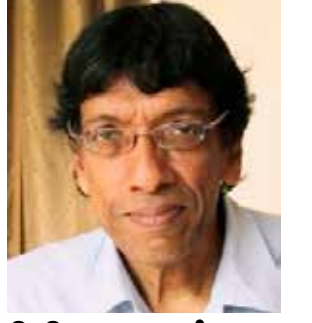
கலாநிதி ஜெகான் பெரேரா

பாராளுமன்ற உறுப்பினரும் தமிழ் தேசிய மக்கள் முன்னணியின் தலைவருமான கஜேந்திரகுமார் பொன்னம்பலத்தின் கைது குறிப்பான அக்கறைக்குரிய ஒரு விவகாரங்களை முதன்மைப்படுத்துகிறது. முதலாவது, வடக்கு, கிழக்கின் முன்னாள் போர் வலயங்களில் தொடரும் உயர்மட்ட நிலையிலான கண்காணிப்பு, நாட்டின் அந்த பாகங்களுக்கு செல்பவர்கள் இரு மாகாணங்களிலும் சீருடையுடன் மிகவும் பெருமளவில் படையினரின் பிரசன்னத்தை காணத் தவறமாட்டார்கள். சுற்றுலா தலங்களிலும் கூட இதுவே நிலைமை. அந்த படையினர் 1970 களின் பிற்பகுதியில் தொடங்கி 2009 மே மாதம் முடிவுக்குவந்த அமைதியைக் குலைத்த வன்முறை நிலைவரத்தை நினைவுபடுத்திக் கொண்டிருக்கிறார்கள். 14 வருடங்கள் கடந்துவிட்டபோதிலும், நாடு அதன் வன்முறைக் கடந்த காலத்தின் மரபை வெற்றிகொள்ளத் தவறியமையை உருவகப்படுத்துவதாக பாதுகாப்பு படைகளுக்காக இன்னமும் செலவிடப்படும் பாரிய செலவினம் அமைந்திருக்கிறது. பொருளாதார வீழ்ச்சிக்கு மத்தியிலும் கூட பாதுகாப்புக்கு பெரும் நிதி ஒதுக்கப்படுகிறது.