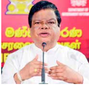
னான சேவையை வழங்க முடியும் என்றும் போக்குவரத்து அமைச்சர் பந்துல கூறினார். (அ)

போன்று ரயில் திணைக்களமும் மறுசீரமைக்கப்பட்டு அதிகார சபையாக மாற்றப்படவேண்டும் என்றும் அமைச்சர் பந்துல தெரிவித்தார். அவ்வாறு மாற்றம் செய்யபடாவிடின் ரயில்வே துறை தனியார் மயமாக்குவதை தவிர அரசாங்கத்துக்கு வேறு வழி கிடையாது என்றும் அவர் குறிப்பிட்டார். ரயில் திணைக்களத்தை அதிகார சபையாக மாற்றுவதன் மூலம் அதிகாரிகள் சுயாதீனமான தீர்மானங்களை எடுப்பதுடன் பொதுமக்களுக்கு விளைத்திற