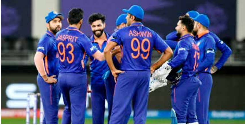
புதுடில்லி, ஜூன் 14 இந்திய கிரிக்கெட் அணி அடுத்த மாதம் மேற்கிந்தியத் தீவுக

ளுக்கு சுற்றுப்பயணம் செய்து 2 டெஸ்ட், 3 ஒரு நாள், 5 இருபது -20 போட்டிகள் கொண்ட தொடர்க