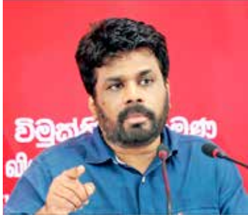
மைப்பது, தேசிய பாதுகாப்பிற்கு அச்சுறுத்தல் ஏற்படுத்தும் தகவல்களை ஊடகங்கள் மூலம் பரப்புவது அந்த நிறுவனங்களுக்கு பாதுகாப்பு ஏற்படுத்தும்.

அரசு நிறுவனங்களை மறுசீரமைப்பது, தேசிய பாதுகாப்பிற்கு அச்சுறுத்தல் ஏற்படுத்தும் தகவல்களை ஊடகங்கள் மூலம் பரப்புவது அந்த நிறுவனங்களுக்கு பாதுகாப்பு ஏற்படுத்தும்.