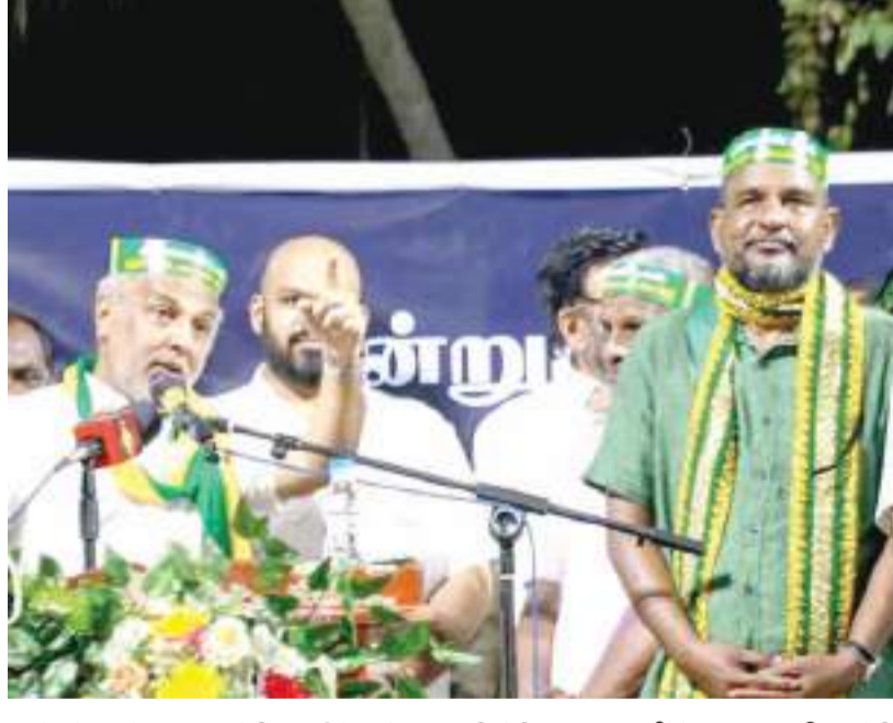
நாட்டின் இன்றைய ஆழ்நிலையில் பல்வேறு பிரச்சினைகளை தீர்க்குமாறு வலியுறுத்தி ஸ்ரீலங்கா முஸ்லிம் காங்கிரஸினால் ஏற்பாடு செய்யப்பட்ட பேரணி வெள்ளிக்கிழமை (1) மாலை அம்பாறை மாவட்ட அட்டாளைச்சேனை மீனோடைக்கட்டு சந்தியில் இருந்து ஆரம்பித்து அட்டாளைச்சேனை நகரப்பகுதி வரை ஊர்வலமாக சென்றது. இப்போராட்டத்தில் ஸ்ரீலங்கா முஸ்லிம் காங்கிரஸ் தலைவரும் பாராளுமன்ற உறுப்பினருமான ரஷிப் ஹக்கீம், தமிழ் தேசிய கூட்டமைப்பின் மட்டக்களப்பு மாவட்ட பாராளுமன்ற உறுப்பினர் கிரா. சாணக்கியன் ஆகியோர் கலந்து கொண்டனர்.

வெறிஞ்சோடிக் காணப்படுகின்றன. வாகனங்களின்றி பிரதான காப்பை பலப்படுத்தியுள்ளதுடன் சோதனை நடவடிக்கைகளையும் வர்த்தக நிலையங்கள் யாவும் மூடப்பட்டுள்ளன. இராணுவமும் பொலிசாரும் நகரங்களில் பாதுகாப்பை பலப்படுத்தியுள்ளதுடன் சோதனை நடவடிக்கைகளையும் தீவிரப்படுத்தியுள்ளனர்.