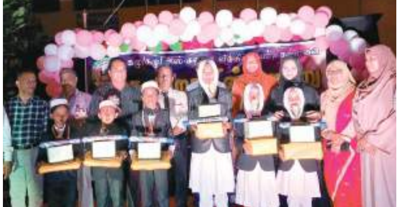
மற்றும் பெற்றோர்கள் இணைந்து நடத்திய இந் நிகழ்வில் மாணவர்களின் கலை, கலாசார நிகழ்வுகள் அரங்கேற்றப்பட்டதுடன் சுஹாவின் ஊற்று என்ற சஞ்சிகையும் வெளியீட்டு வைக்கப்பட்டது.