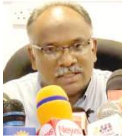
கசப்பான சம்பவங்களின் உண்மையான காரணங்களில் முதன்மை