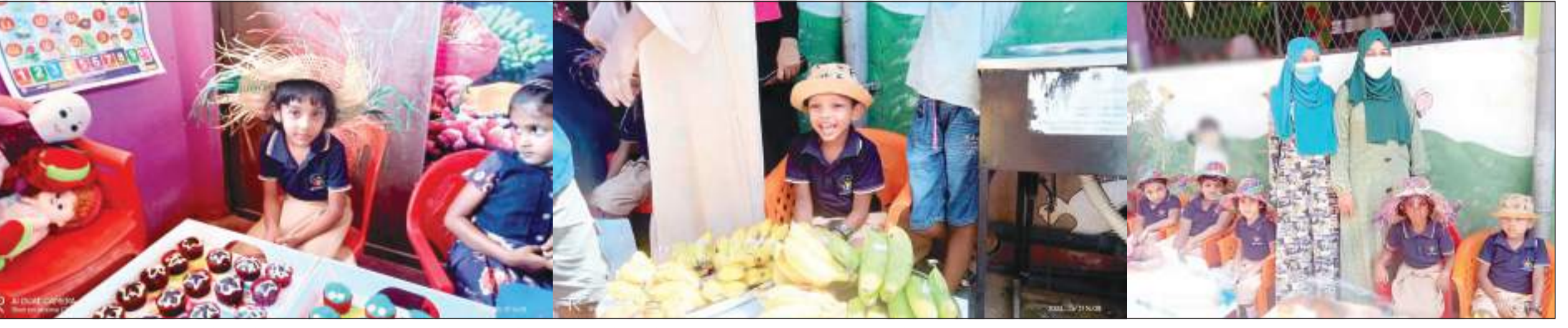
பெருவளை மஸ்ஸல் சமட்ட மாவத்தை பிரைட் சிறுவர் பாடசாலையின் 'பிரைட் சிறுவர் சந்தை' அண்மையில் பிரைட் சிறுவர் பாடசாலையில் நடைபெற்ற போது பிடிக்கப்பட்ட படம்.