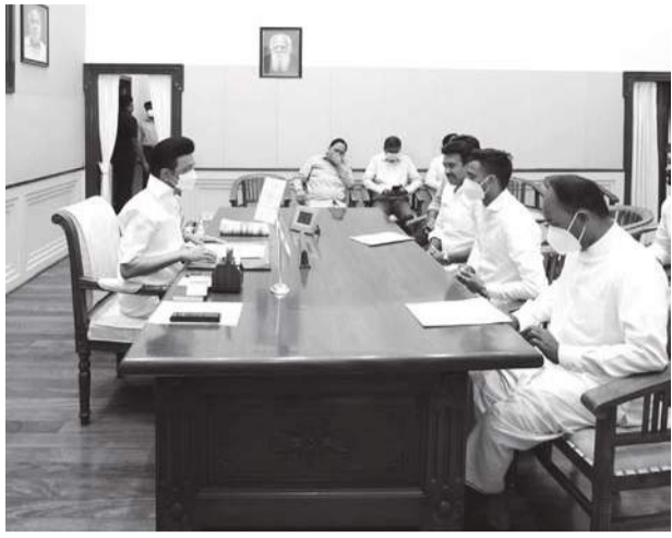
தெரிவித்துக் கொண்டுள்ள முதலமைச்சர், இந்தச் சூழ்நிலையில் இலங்கையில் வசிக் கும் குறிப்பாக மலையகம், வடக்கு மற்றும்

இலங்கையில் ஏற்பட்டுள்ள பொருளாதார நெருக்கடியால், அத்தியாவசியப் பொருட்களின் விலைவாசிகள் அதிகரித்துள்ளன. இதனால், பொதுமக்கள் பெரும் சிரமங்களுக்கு முகங்கொடுத்து வருகின்றனர். இதனைக் கருத்திற்கொண்டு, மலையக மக்களுக்குத் தேவையான அத்தியாவசிய உணவுப் பொருட்கள் மற்றும் மருந்துகளை வழங்குவது தொடர்பில், இந்திய மத்திய வெளியுறவுத்துறை அமைச்சர் வைத்தியர் கப்பரணியம் ஜெய்சங்கர் தொலைபேசியில் தொடர்புகொண்டுள்ள தமிழக முதலமைச்சர், இது தொடர்பாகக் கலந்துரையாடி, உரிய ஏற்பாடுகளைச் செய்துள்ளார்.