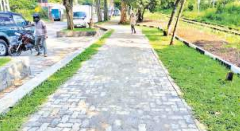
மக்களிடம் கையளக்கும் நிகழ்வு மாத்தளை மாவட்ட பாராளுமன்ற உறுப்பினர் ரோஹன் திலாநாயக்காவால் நாடா வெட்டி பாதையை வைபவ ரீதியாக திறந்து வைக்கப்பட்டது. (படம்: மாத்தளை சுழற்சி நிருபர்)