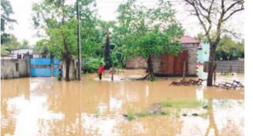
அடி 7அங்குலமாக அதிகரித்துள்ளது. அத்துடன் கணகாம்பிகைக்கு எம் மீண்டும் வான்பாய ஆரம்பித்துள்ளது. இதேவேளை பாரதிபுரம்,

மணித்தியாலங்களில் அதிகளவான மழைவீழ்ச்சி பதிவாகியுள்ளது. 36 அடி கொள்ளவு கொண்ட இரணைமடு குளத்தின் நீர்மட்டம் 35