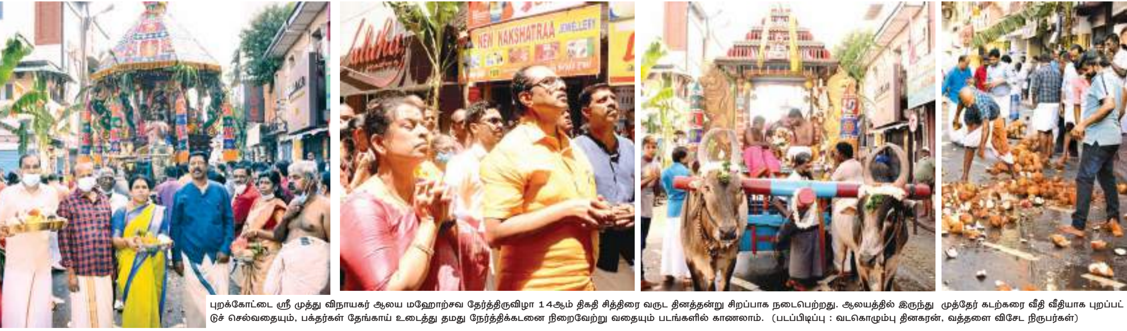
புறக்கோட்டை ஸ்ரீ முத்து விநாயகர் ஆலய மஹோற்சவ தேர்த்திருவிழா 14ஆம் திகதி சித்திரை வருட தினத்தன்று சிறப்பாக நடைபெற்றது. ஆலயத்தில் இருந்து முதல்தேர் கடற்கரை வீதி வீதியாக புறப்பட்டுச் செல்வதையும், பக்தர்கள் தேங்காய் உடைத்து தமது நோர்த்திக்கடனை நிறைவேற்று வதையும் படங்களில் காணலாம்.

பண்டிட் ஸ்ரீ ராம் சர்மா ஆச்சார்யா தமிழில்: ஸ்ரீ ஸத்தி சுமனன்