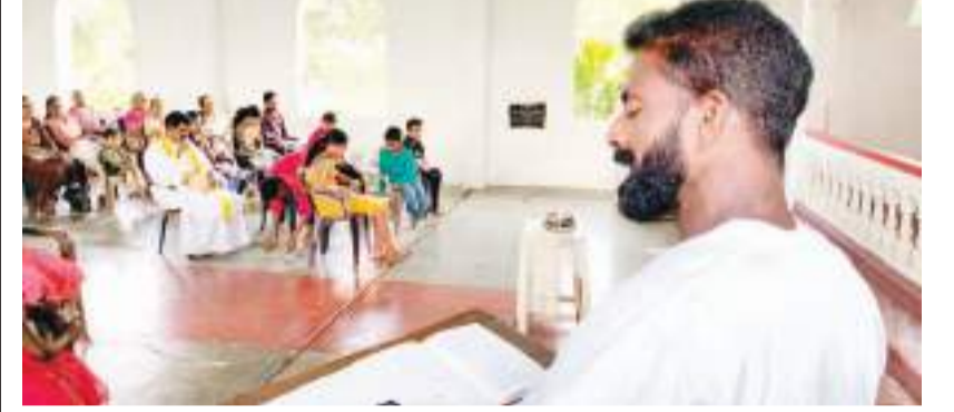
பரந்தன் குறாப் நிருபர்

உயிர்ப்பின் ஞாயிறு வழிபாடுகள் கிளிநொச்சியில் சிறப்பாக இடம்பெற்றன. அனைத்து திருச்சபைகளிலும் விசேட திருப்பலி வழிபாடுகள் இடம்பெற்றன. நாட்டின் பொருளாதாரம் மற்றும்