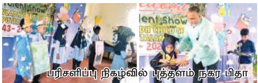
பரிசளிப்பு நிகழ்வில் புத்தளம் நகர பிதா