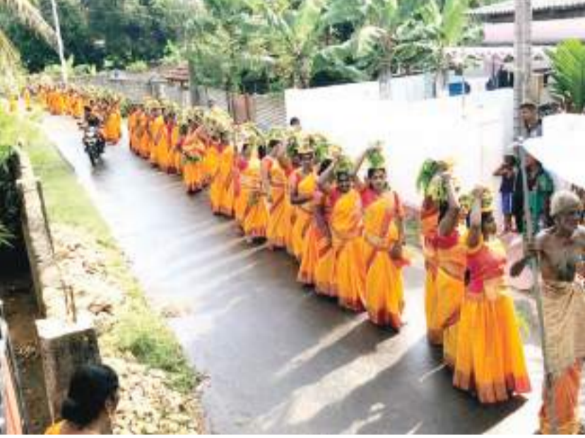
பொருளாதாரத்தால் நலிந்து போயுள்ள நாட்டையும் மக்களையும் காக்க ஆசி வேண்டியும், நாட்டில் சாந்தி சமாதானம் நிலை வேண்டியும் பால்குட பவனி ஒன்று இடம்பெற்றது. பருத்தித்துறை தம்பசிடியில் உள்ள மாயக்கைப்பிள்ளையார் ஆலயத்தில் நேற்று சனிக்கிழமை(16) காலை இப் பால்குட பவனி இடம்பெற்றது. 108 பெண்கள் பால்குடத்தை தாங்கி தமது ஊரினைச் சுற்றி அப்பாலுள்ள அம்மன் கோவிலுக்கு சென்று அங்கு அம்மனுக்கு பாலாபிஷேகம் இடம்பெற்றது.