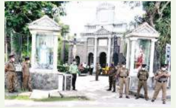
உயிர்த்த ஞாயிறு தினத்தையொட்டி கம்பஹ ஆலயத்தில் விசேட பாதுகாப்பு ஏற்பாடு மேற்கொள்ளப்பட்டுள்ளதை படத்தில் காணலாம்.