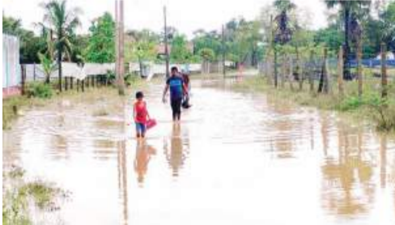
கடந்த வெள்ளி மற்றும் சனி ஆகிய நாட்களில் பிற்பகல் வேளைகளில் இடியுடன் பலத்த மழை பதிவாகியுள்ளது. மிக குறுகிய

மணித்தியாலங்களில் அதிகளவான மழைவீழ்ச்சி பதிவாகியுள்ளது. 36 அடி கொள்ளவு கொண்ட இரணைமடு குளத்தின் நீர்மட்டம் 35