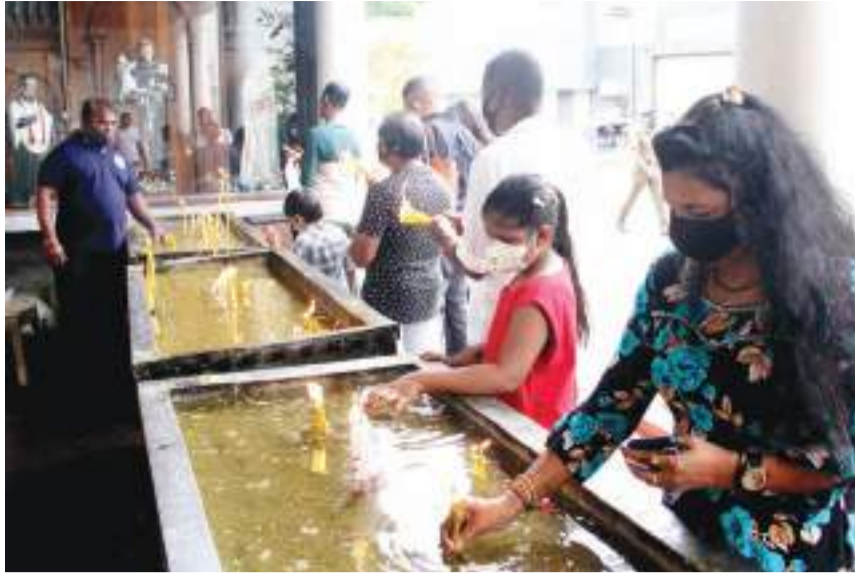
உயிர்த்த ஞாயிறு தினத்தையொட்டி கொச்சிக்கடை ஆலயத்தில் விசேட பிரார்த்தனை நடைபெற்ற போது...