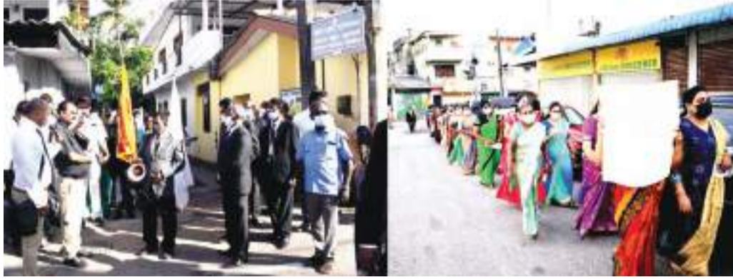
உயிர்த்த ஞாயிறு தினத்தை முன்னிட்டு மட்டக்குளி மோதரை மிஸ்பா ஜெப மிஷனரி ஆலயத்தினால் நாட்டுக்கும் நாட்டு மக்களுக்கும் சமாதானம், இறைஆசிரிவாதம் வேண்டி நடைபெற்ற பாதயாத்திரையின் போது.