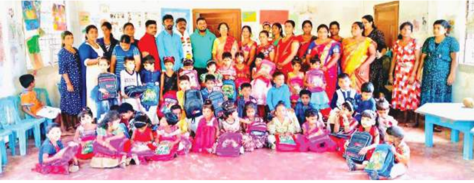
கரவெட்டி தினகரன் நிருபர்

மிருகவில் வடக்கு மிருகவில் பாரதி முன்பள்ளியின் வருடப்பிறப்பு விழாவும் மாணவர்களுக்கு உதவி வழங்கும் நிகழ்வும் சித்திரை புத்தாண்டு தினத்தன்று மிருகவில் வடக்கு பாரதி முன்பள்ளியில் ஆசி