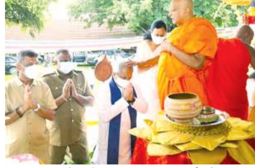
மாகாண ஆளுநரின் இணைப்பு உட்பட அரச அதிகாரிகளும் கலந்து கொண்டனர்.