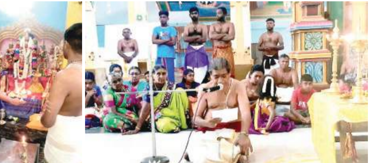
"சுப சிந்து வருஷம்" சித்திரை வருடப்பிறப்பு மலர்ந்ததையிட்டு உடம்பு ஸ்ரீருக்கணி சத்தியபாமா சமேத ஸ்ரீபார்த்தசாரதிப் பெருமான் திரைபதியம்மன் ஆலயத்தில் விஷேட பூஜைகளும், பக்தர்களின் அர்ச்சனைத் தட்டு வழங்கும் நிகழ்வுகளும் இடம்பெற்றன. அத்துடன் ஆலய பிரதம குரு பஞ்சாச்சரக் குருக்களினால் சித்திரை வருடப்பிறப்பு பஞ்சாங்கமும் வாசிக்கப்பட்டது. பங்களி: உடம்பு குறாப் நிருபர்

பெண் குழந்தைகள் மட்டும் இருந்தால் அவர்கள் கொடுக்கும் சிரார்த்தம் ஏற்படையதுதானா? பெண்கள் நேரடியாக இதை செய்யக்கூடாது. யாராவது ஒரு ஆணிடம் தர்ப்பையைக் கொடுத்து அவர் மூலமாக செய்ய வைக்கலாம். திருமணமான பெண்கள் கணவன் வீட்டைச் சார்ந்து விடுவதால், பெற்றோருக்காக தர்ப்பை கொடுக்கக் கூடாது. பெற்றோரின் பங்காளிகளைச் செய்யச் சொல்லி பொருளுதவி மட்டும் செய்யலாம். 18991) பஞ்சாட்சர மந்திரம் (நமசிவாய, சிவாயநம) சொல்லித் தான் திருநீறு பூச வேண்டும் என்பது உண்மையா? பஞ்சாட்சரம் (நமசிவாய) சொல்லி திருநீறும், அஷ்டாஷ்டாரம் (ஓம் நமோ நாராயணாய) சொல்லி திருமண னும் இட்டுக் கொள்வதைப் போன்ற புண்ணியச் செயல் இவ்வுலகில் வேறு கிடையாது. 18992) கிரகப்பிரவேசம் செய்யும்போது முதலில் பசுவையும், கன்றையும் அழைத்து வந்து கோபூஜை செய்வதன் நோக்கம் என்ன? பசுவின் உடம்பில் முப்பத்து முக்கோடி தேவர்கள் இருக்கிறார்கள். நான்கு வேதங்களும் நான்கு கால்களாக உள்ளன. கன்றுக்காக சுரக்கும் பாலை நமக்கும் கொடுக்கும் பசுவை "கோமாதா" என அழைக்கிறோம். இதன் காலடி பட்ட இடத்தில் மாங்கலம் உண்டாகும். கன்றுடன் கூடிய பசுவை பூஜிப்பதால், லட்சுமியின் அருள்காட்சம் நிலைத்திருக்கும். கன்று இல்லாமல் பசுவை தனித்து அழைத்து செல்லவோ, பூஜை செய்யவோ கூடாது.