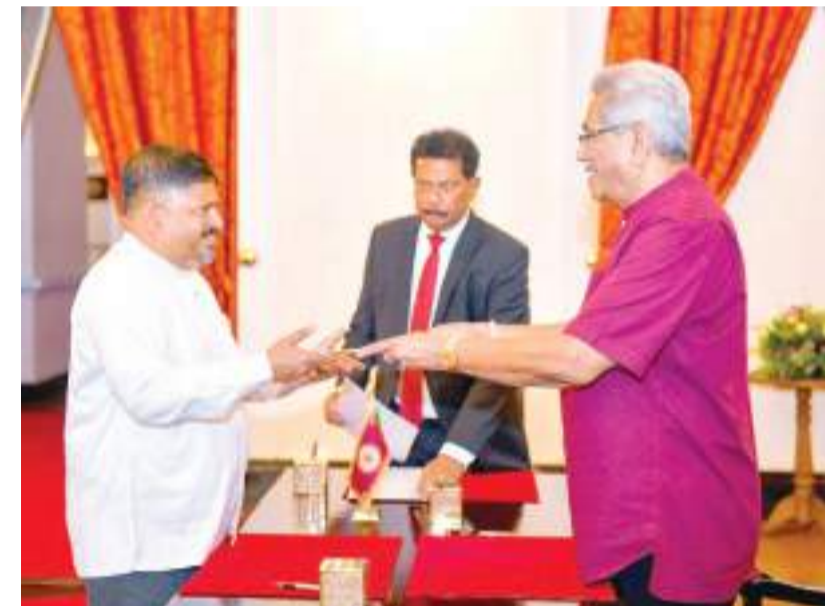
புதிய இராஜாங்க அமைச்சர்களாக சுரேன் ராகவன், காந் மஸ்தான், அரவிந்த குமார் ஆகியோர் நேற்று ஜனாதிபதி கோட்டாய ராஜபக்சு முன்னிலையில் சத்தியப்பிரமாணம் செய்து கொண்டனர். சுரேன் ராகவன் கல்விச் சேவை மற்றும் மறுசீரமைப்பு இராஜாங்க அமைச்சராகவும் காந் மஸ்தான் கிராமிய பொருளாதார பயிற்செய்கை மற்றும் அபிவிருத்தி இராஜாங்க அமைச்சராகவும் ஏ.அரவிந்தகுமார் தோட்ட விடமைப்பு மற்றும் சமூக உட்கட்டமைப்பு வசதிகள் இராஜாங்க அமைச்சராகவும் சத்தியப் பிரமாணம் செய்து கொண்டுள்ளனர். (ஸ)