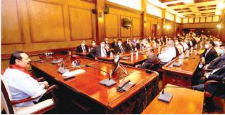
தெரிவிக்கப்பட்டுள்ளதாவது: அரசாங்கத்திற்கு ஆதரவான சட்டத்தரணிகளுக்கும் பிரதமர் மஹிந்த ராஜபக்சவுக்கும் இடையிலான சந்திப்பொன்று நேற்று (18) அலரி மாளிகையில் நடைபெற்றது. இது குறித்து பிரதமரின் ஊடகப் பிரிவு வெளியிட்டுள்ள அறிக்கையில்

ஒழுங்கமைக்கப்பட்ட கும்பல்கள் மக்களை ஈடுபடுத்தி அரசாங்கத்தை இடக்கட்டான நிலைக்கு உட்படுத்துவதற்கும், ஜனாதிபதி மற்றும் பிரதமரை நீக்கி அவர்களது குறுகிய இலக்குகளை அடைவதற்கு முயற்சிப்பதாகவும், எனவே, இந்த நெருக்கடியை மிகுந்த புரிதலுடன் மக்களின் தேவைகளை நிறைவேற்றி, ஜனாதிபதியும் பிரதமரும் துணிச்சலுடன் செயற்பட வேண்டியது மிகவும் அவசியமானது என அரசாங்கத்திற்கு ஆதரவான சட்டத்தரணிகள் தெரிவித்துள்ளனர். அரசாங்கத்திற்கு ஆதரவான சட்டத்தரணிகளுக்கும் பிரதமர் மஹிந்த ராஜபக்சவுக்கும் இடையிலான சந்திப்பொன்று நேற்று (18) அலரி மாளிகையில் நடைபெற்றது. இது குறித்து பிரதமரின் ஊடகப் பிரிவு வெளியிட்டுள்ள அறிக்கையில்