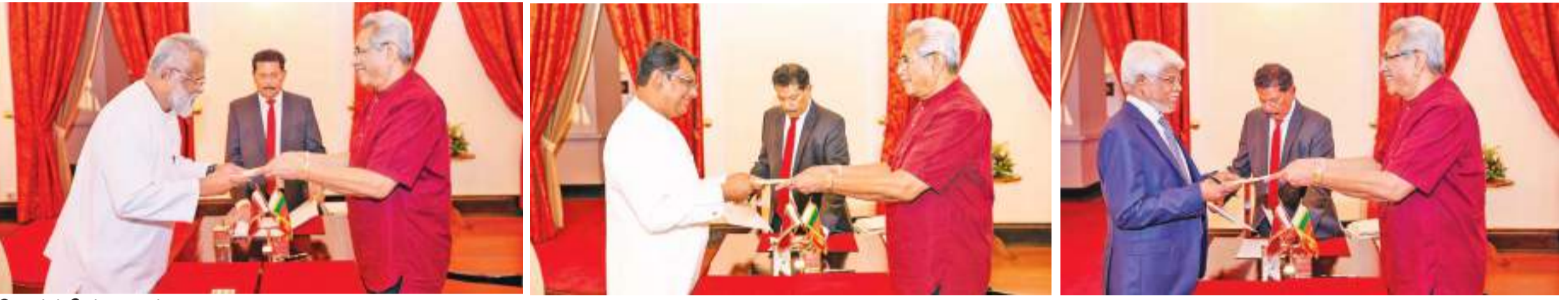
லோரன்ஸ் செல்வநாயகம் கொண்டனர். புதிய அமைச்சரவை அந்தஸ்துள்ள அமைச்சர் டக்ளஸ் தேவானந்தா அமைச்சர்களாக ஜனாதிபதி கோட்டா முன்பு வகித்த கடற்றொழில் அபிவிபாய ராஜபக்ஷ முன்னிலையில் நேற்று ருத்தி அமைச்சராக புதிய அமைச்ச 17 பேர் சத்தியப்பிரமாணம் செய்து ரவையில் இடம் பெற்றுள்ளனர். முன்னாள் கிழக்கு மாகாண முதலமைச்சர் நஸீர் அஹமட் சற்றாடல் அபிவிருத்தி அமைச்சராக ஜனாதிபதி முன்னிலையில் நேற்று சத்தியப்பிரமாணம் செய்து கொண்டார். அத்துடன் ஊடகத்துறை அமைச்சராக நாலக கொடஹேவா சத்தியப்பிரமாணம் செய்து கொண்டார். ஜனாதிபதி மானிகையில் நேற்று முற்பகல் நடைபெற்ற விசேட நிகழ்வின் போதே மேற்படி 17 அமைச்சர்களும் ஜனாதிபதி முன்னிலையில் புதிய அமைச்சர்களாக சத்தியப்பிரமாணம் செய்து கொண்டுள்ளனர். அமைச்சர்களான பேராசிரியர் ஜி. எல் பிரிஸ், அலி சப்ரி, திணைக் குணவர்தன, ஜோன்ஸ்டன் பெர்னாண்டோ ஆகியோர் ஏற்கனவே ஜனாதிபதியின் முன்னிலையில் புதிய அமைச்சர்களாக

ஊடகத்துறை அமைச்சராக நாலக கொடஹேவா சத்தியப்பிரமாணம்