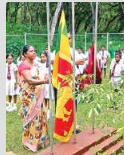
2022ஆம் ஆண்டிற்கான முதலாம் தர மாணவர்களை வரவேற்கும் நிகழ்வு மத்துகம அன்னாசிகல