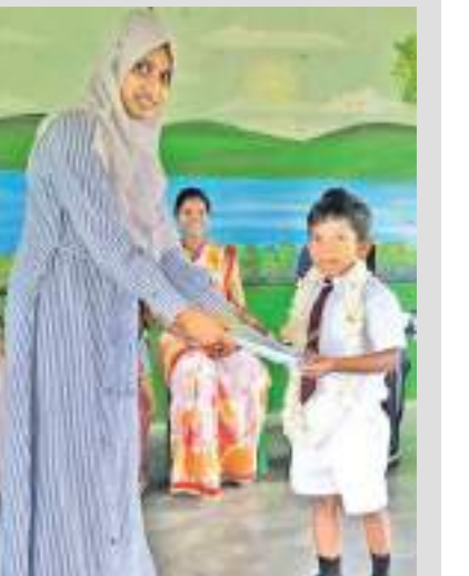
பெற்றதுடன் விசேட பரிசில்களும் அதிதிகளினால் புதிய மாணவர்களுக்கு வழங்கி வைக்கப்பட்டன.