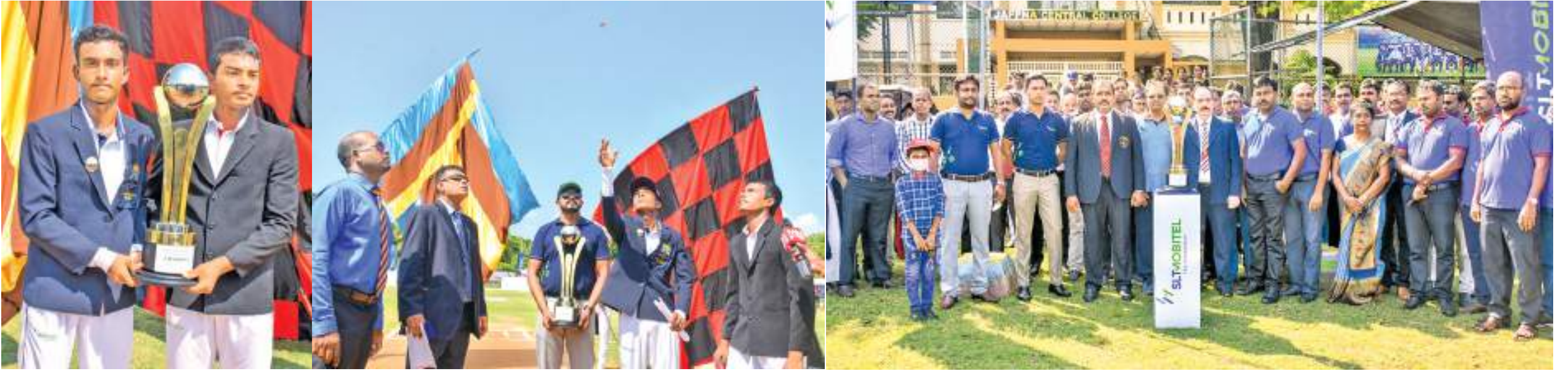
வடக்கின் வரும்போர் என வர்ணிக்கப்படும் யாழ்ப்பாணம் மத்திய கல்லூரிக்கும் இடையிலான மாபெரும் கிரிக்கெட் போட்டி நேற்று யாழ் மத்திய கல்லூரி மைதானத்தில் ஆரம்பமாகியது.