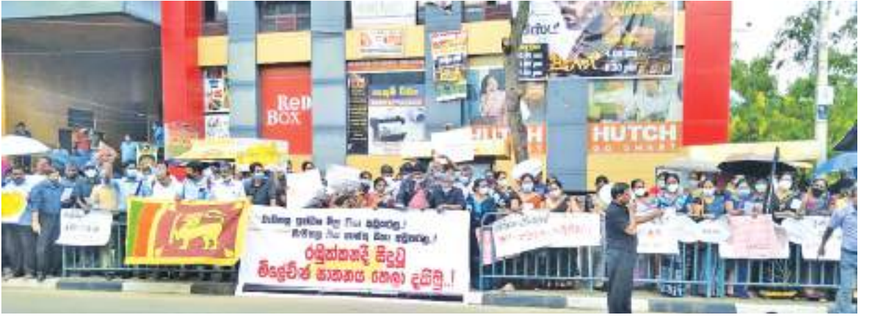
ரம்புக்களையில் நடந்த ஜனநாயக ரீதியான மக்கள் போராட்டத்தின் போது பொலினாரின் துப்பாக்கி கூட்டுக்கு இலக்காகி மரணமடைவதற்கு அணுதாயம் தெரிவித்து மாத்தளை மாநகர மணிகோபுர சந்தியில் நேற்று இடம்பெற்ற ஆர்ப்பாட்டத்தின் போது... (உக்குவண வீடே நிருபர்)

கொண்டுவரப்படுவதாகவும் சமீப காலமாக தேங்காய்கள் விற்பனைக்காக வர்த்தகர்கள் கொண்டு வருவதில்லை எனவும் வர்த்தகர்கள் தெரிவிக்கின்றனர். இதனால் நுகர்வோர்கள் தேங்காய்க்காக பெரும் அவதிப்படுவதாக தெரிவிக்கப்படுகிறது.