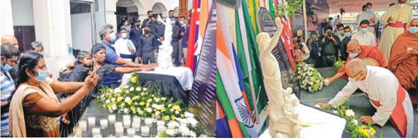
உயிர்த்த ஞாயிறு குண்டுதாக்குதல் இடம்பெற்று நேற்றுடன் (ஏப்.21) 03 ஆண்டுகள் பூர்த்தியாகியது. நாடு முழுவதும் நினைவு கூரல் நிகழ்வுகள் நடைபெற்றதோடு குண்டுதாக்குதல் இடம்பெற்று கொழும்பு, கொச்சிக்கடை புனித அந்தோனியார் பேராலய கந்தினால் மெல்கம் ரஞ்சித் ஆண்டகையின் தலைமையில் விசேட பிரார்த்தனைகள் நடைபெற்றன. குண்டுவெடிப்பில் மரணமானவர்களை நினைவு கூர்ந்து மெழுகுவர்த்தியேற்றி வழிபட்டபோது பிடிக்கப்பட்ட படங்கள்