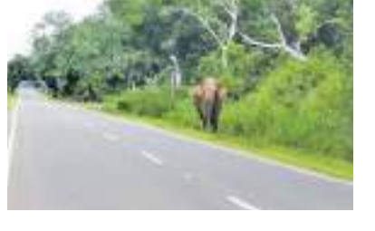
இதேவேளை, அவ்வப்போது வீதிக்கு யானை வருவதால் மக்கள் அச்சத்துடனேயே பயணிக்க வேண்டியுள்ளமை குறிப்பிடத்தக்கது.

வவுனியா புளியங்குளம் நெடுங்கேணி வீதியில் யானை ஒன்று வீதிக்கு வந்தமையால் அவ்வீதி வழியாக போக்குவரத்து செய்த பயணிகள், வாகன சாந்திகள் எனப்பலரும் அசௌகரியங்களுக்கு உள்ளாகியுள்ளன.