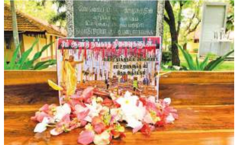
உயிர்த்த ஞாயிறு தாக்குதலில் உயிரிழந்தவர்களுக்கு யாழ்.பல்கலை மாணவர்களால் நேற்று அஞ்சலிசெய்யப்பட்டது.

இவ்வகையிலான திறன் பலகைகளை பயன்படுத்தும் பயிற்சிகளுடன் ஆசிரியமானவ இடைவினை செயற்பாடுகள், கற்றல், கற்பித்தலில் பாரிய முன்னேற்றங்களுக்கு வித்திடும் என எதிர்பார்க்கப்படுகின்றது. அதுமட்டுமல்லாது மாணவர்களின் கயசின்தனை கிளர்வு மற்றும் அவர்களது தன்னம்பிக்கை போன்றவற்றை வளர்த்தெடுப்பதில் இது முக்கிய பங்கு வகிக்கும் என எதிர்பார்க்கப்படுகின்றது.