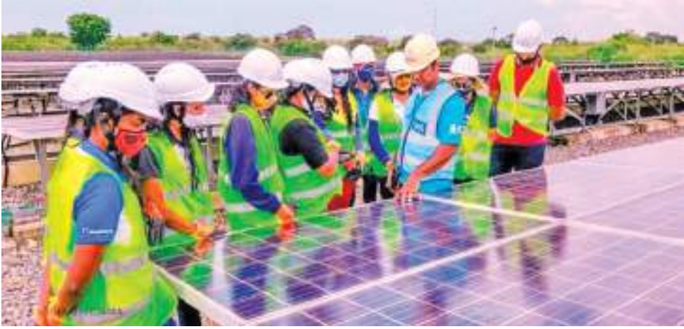
சூரியசக்தி தொழில்நுட்பவியலாளர்கள் 1000 பேரை பயிற்றுவித்தலுக்கான வேலைத்திட்டம் பொதுமக்கள் பயன்பாட்டு ஆணைக்குழுவுடன் இணைந்த NAITA பயிற்சியாளர்கள்....