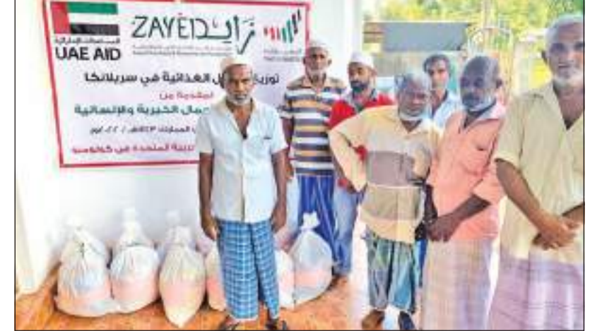
கொழும்புவிருள்ள ஐக்கிய அரபு எமிரேட்ஸ் தூதர்கள், ஐக்கிய அரபு எமிரேட்ஸில் உள்ள தொண்டு மற்றும் நலன்புரி அமைப்புகளுடன் இணைந்து, இலங்கை மக்களுக்கு பயனளிக்கும் வகையில் ரமழான் மாதத்தில் பல்வேறு வேலைத்திட்டங்களை செயல்படுத்துகின்றன. ஸாவுட் தொண்டு நிறுவனத்தின் மூலம் வழங்கப்பட்ட உலர் உணவுப் பொதிகள் நாட்டின் பல்வேறு பகுதிகளில், ஏழை குடும்பங்களுக்கு விநியோகிக்கப்பட்டன.

கருத்தரங்கில் பங்குபற்றிய மாணவர்கள் இவ்வாறான கருத்தரங்கு தமக்கு மிகுந்த பயனுள்ளதாக அமையப் பெற்றதைப்பற்றி நகராபிதாவுக்கு தமது நன்றிகளைத் தெரிவித்தனர்.