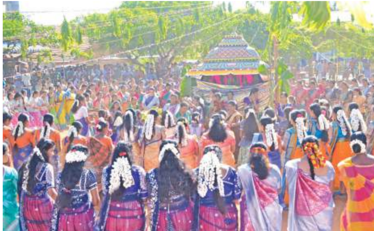
உட்புறின் வருடாந்த சித்திரைச் செவ்வாய் நிகழ்வு மிகவும் பக்தியாக புத்தளம் காலை(27) நடைபெற்றது. மாறியமன் அம்பாளின் அருளைப் பெற்றுக் கொள்ளும் முழு நோக்குடனும், இந்த நிகழ்வு காணும் காமமாக நடைபெறுகிறது. இந்த வைபவ காலத்தில் மக்களுக்கு அம்மை நோய் வருவதை நிவர்த்தி செய்யும் முகமாகவும், மழையை வேண்டியும் இது நடைபெறுகின்றது.

சிறிய குளங்களை அபிவிருத்தி செய்யும் வேலைத் திட்டத்தின் கீழ் இவ் வேலைத் திட்டத்தை நடைமுறைப்படுத்துவதோடு, இவ் வருட சிறுபொக மற்றும் பெரும்பொக விவசாய நடவடிக்கைகளுக்கான நீர்ப்பாசன வசதியை பெற்றுக் கொடுப்பதே இதன் நோக்கமாகும். இதற்காக உலக வங்கி 500 மில்லியன் ரூபா பணத்தை ஒதுக்கீடு செய்துள்ளதாக 'வாரி சகரு' அபிவிருத்தி திட்டப்பிரிவு தெரிவித்துள்ளது.