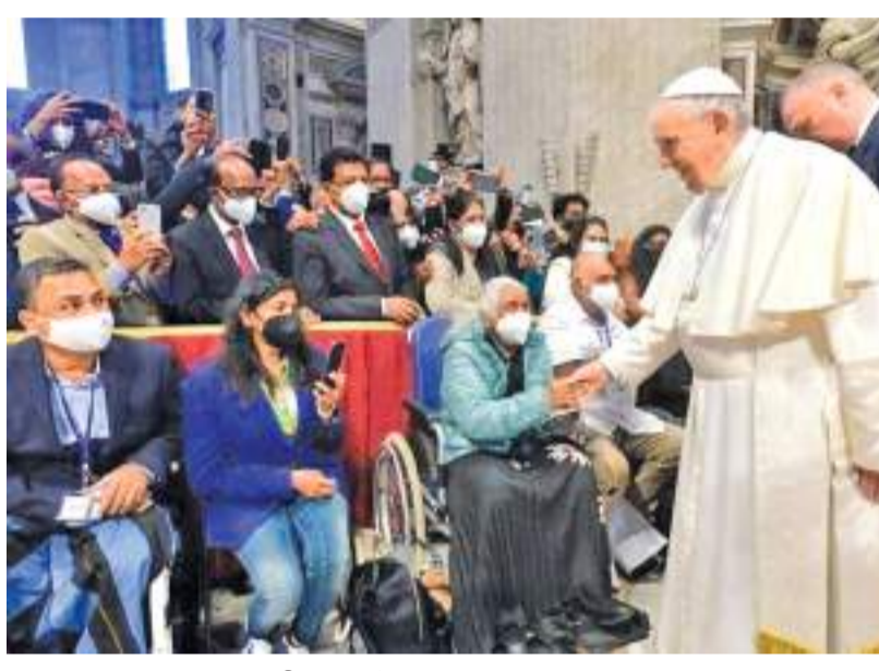
உயிர்த்த ஞாயிறு தாக்குதலில் உயிரிழந்த குடும்பங்கள் மற்றும் காயப்பட்டவர்கள் 60 பேர் கொண்ட குழுவினர். பேராயர் கருதினால் மெல்கம் ரஞ்சித் ஆண்டகையின் தலைமையில் ரோமிலுள்ள பரிசுத்த பாப்பரசரை சந்தித்து ஆசிரிவாதம் பெற்றுக் கொண்டனர். பாப்பரசர் பாதிக்கப்பட்டவர்களுக்கு ஆசி வழங்கியபோது பிடிக்கப்பட்ட படம்.