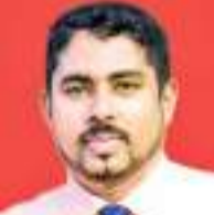
ஏ.எல்.எம்.வினான்ஸ்... (பெரியநீலாவணை விசேட நிருபர்)

இந்த நிகழ்வில் மாவட்டத்தின் தமிழ்மொழி மூல பிரதேச செயலகங்களில் கடமையாற்றும் கலாசார அபிவிருத்தி உத்தியோகத்தர்கள் கலந்து கொண்டதுடன் மூத்த கலைஞர்களுடைய பாரம்பரிய கலை, கலாசார நிகழ்வுகள் இடம்பெற்றன.