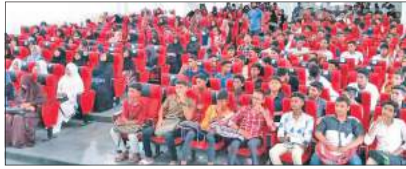
பொருளாதார நெருக்கடியாலும் நெருக்கடியாலும் மாணவர்கள் பாதிக்கப்பட்டிருக்கும் மாணவர்களின் கல்விச் செயற்பாடுகளின் மீள் எழுச்சிக்கான உந்து சக்தியாக இவ்வாறான இலவச கருத்தரங்குகள் அமை

க.பொ.த. சாதாரண தரப் பரீட்சைக்கு இவ்வருடம் (2022) தேர்ந்துள்ள மாணவர்களுக்கான இலவச விஞ்ஞான பாட கருத்தரங்கு புத்தளம் கே.ஏ.பாமின் ஞாபகார்த்த மாநாட்டு மண்டபத்தில் அண்மையில் இடம் பெற்றது.