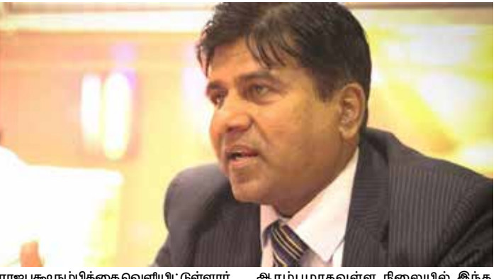
ராஜபக்சு நம்பிக்கை வெளியிட்டுள்ளார். ஊக்கிய நாடுகள் மன்ற உரிமை பேரவையின் 53 ஆவது அமர்வு இன்று ஆரம்பமாகவுள்ள நிலையில் இந்த நகல்வடிவை தயாரிக்கப்பட்டுள்ளமை குறிப்பிடத்தக்கது. (05)

உண்மை மற்றும் நல்லிணக்க ஆணைக்குழு குறித்த இறுதி நகல்வடிவை அரசாங்கம் தமிழ்த் தேசியக் கூட்டமைப்பிடம் வழங்கும் என நீதி அமைச்சர் விஜேதாஸ் ராஜபக்ச தெரிவித்துள்ளார். மேலும் குறித்த நகல் வெளிநாட்டு இராஜதந்திரிகளிடமும் சமர்ப்பித்த பின்னரே அதனை நாடாளுமன்றத்தில் சமர்ப்பிப்போம் என விஜேதாஸ் ராஜபக்சு கறிப்பிட்டுள்ளார். உண்மை மற்றும் நல்லிணக்க ஆணைக்குழு குறித்த இறுதி நகல் அடுத்த மாத இறுதிக்குள் தயாராகிவிடும் எனவும் நீதி அமைச்சர் குறிப்பிட்டுள்ளார். நாடாளுமன்றம் அனுமதியளித்ததும் டிசெம்பர் மாதம் முதல் அதற்காக ஆணைக்குழு செயற்பட ஆரம்பிக்கும் எனவும் நீதி அமைச்சர் விஜேதாஸ்