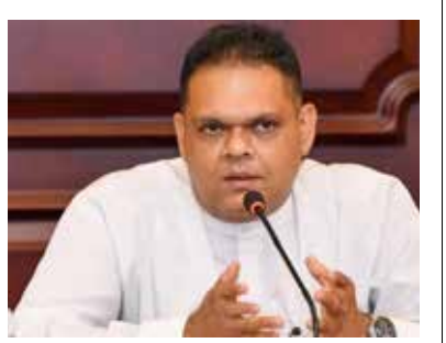
அவர் வலியுறுத்தியுள்ளார். (05)

நிலவும் பணவீக்கத்தை கட்டுப்படுத்த நிதி அமைச்சர் மத்திய வங்கியும் பல்வேறு உத்திகளை மேற்கொண்டு வருவதாக பதில் நிதியமைச்சர் ஷெஹான் சேமசிங்க தெரிவித்துள்ளார். அதன்படி எதிர்காலத்தில் வட்டிவிகிதங்கள் குறையும் என்றும் சாதகமான முடிவுகளை எதிர் பார்க்கப்படும் பதில் நிதி அமைச்சர் ஷெஹான் சேமசிங்க மேலும் தெரிவித்துள்ளார். ஆகவே, அபிவிருத்தியடைந்து வரும் நாட்டின் பொருளாதாரம் தொடர்பில் தேசிய மற்றும் சர்வதேச நம்பிக்கையை உடைக்கும் வகையில் கருத்துக்களை வெளியிடுவதை தவிர்க்க வேண்டும் என்றும்