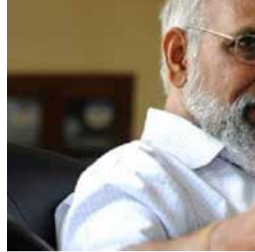
எல்லாவல மேதானந்த தேரர். மேற்கொண்டுவரும் குழப்பியடிக்கும் செயற்பாடுகளை வன்மையாக

கண்டிப்பதாக தமிழ் மக்கள் கூட்டணியின் பொதுச்செயலாளர் சி.வி.விக்னேஸ்வரன் தெரிவித்துள்ளார். மேலும், வரலாறு கசப்பானதாக இருந்தாலும் கி.பி. 6 ஆம், 7 ஆம் நூற்றாண்டுகளிலேயே சிங்கள மொழி இலங்கைக்கு வந்தது என்பதை அவர்கள் தெரிந்து கொள்ள வேண்டும் என்றும் குறிப்பிட்டுள்ளார். வரலாற்றுமற்றி பின்னர் அதனடிப்படையில் தமிழர்களுக்குச் சொந்தமான பகுதிகளைக் கையகப்படுத்த முனைவது ஆக்கிரமிப்பு என்றும் அவர் குற்றம் சாட்டியுள்ளார். ஆகவே, இந்த விடயங்களில் ஜனாதிபதி ரணில் விக்கிரமசிங்க தீர்க்கமான நடவடிக்கைகளை முன்னெடுக்கவேண்டும் என தமிழ் மக்கள் கூட்டணியின் பொதுச்செயலாளர் சி.வி.விக்னேஸ்வரன் கேட்டுக்கொண்டுள்ளார். (05)