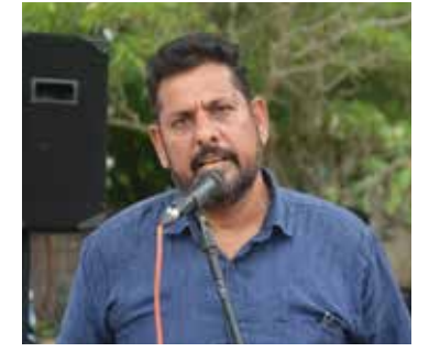
நாம் குரல்கொடுப்போம். - என்.ரா. (05)

ஏற்படுகின்றது. வடகொரியாவிலே எவ்வாறு மக்கள் நசுக்கப்படுகின்றார்களோ - அவர்களுக்கான வாழும் உரிமை எவ்வாறு மறுக்கப்பட்டோ - அவர்களின் கருத்துச் சுதந்திரம் எவ்வாறு இல்லாமலாக்கப்பட்டதோ அந்த நிலைமை இலங்கையிலும் ஏற்படுவதற்கான வாய்ப்புகள் காணப்படுகின்றன. ஆகவே, இந்தச் சட்டமூலங்களை எதிர்க்கவேண்டிய கடப்பாடு தமிழ்த் தேசியக் கூட்டமைப்புக்கு உண்டு. அது நிச்சயம் இவற்றை எதிர்க்கும். தமிழர்களோடும் - தமிழ்ப்பண்புகளோடும் - தமிழகமேலும் தமிழ்த் தேசியத்துக்காகவும்