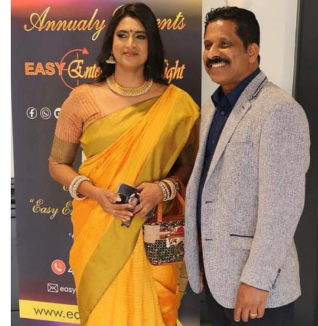
தும் விதமாகவும் இடம்பெற்றுள்ளது.

இந்த நிகழ்வு மகிழ்ச்சிக்கூரிய நிகழ்வாக மாத்திரமின்றி தமிழர் விடுதலை உணர்வையும் விழிப்பையும் ஏற்படுத்தும் விதமாகவும் இடம்பெற்றுள்ளது.