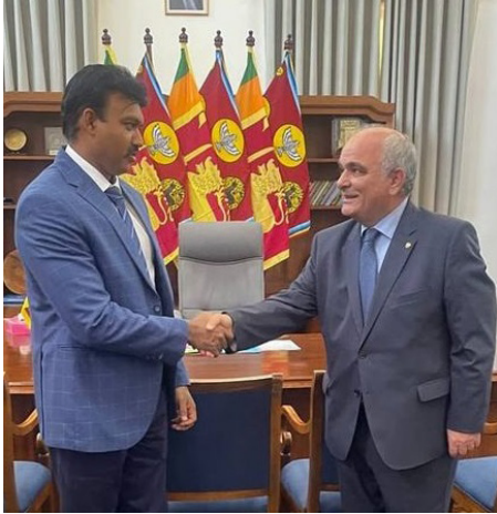
இலங்கைக்கான ரஷ்யத் தூதுவர்