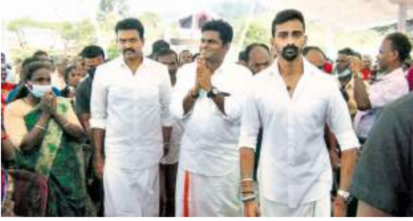
ஹற்றன் சுழற்சி நிகுபர்

இலங்கை தொழிலாளர் காங்கிரஸின் தோட்ட தலைவர், தலைவி மார்கள் மற்றும் வாலிப காங்கிரஸ் இளைஞர்கள் ஆகியோர் கலந்து கொண்ட மேதினக் கூட்டம், கொட்டகலை சி.எல்.எப். வளாகத்தில் நேற்று (01) இடம்பெற்றது.