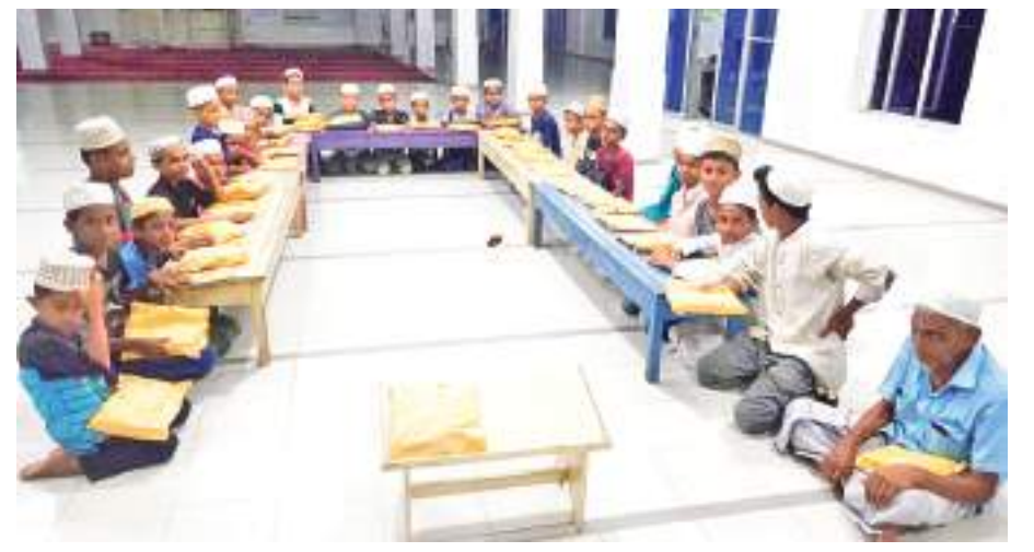
வெலிகம, புலஹாரிப் பள்ளிவாசலில் புனித ரமழான் மாதம் முழுவதும் நடைபெற்ற ஹிஸ்பு மஜ்லிஸில் சிறார்கள் கலந்து கொண்டுள்ளதையும் அவர்களுக்கு பள்ளிவாசல் நிர்வாகத்தினால் அன்பளிப்புகளும் வழங்கப்பட்டன. கலந்துகொண்ட சிறார்களுக்கு அன்பளிப்பு பிரார்த்தனைகளும் வெலிகம தினகரன் நிருபர்