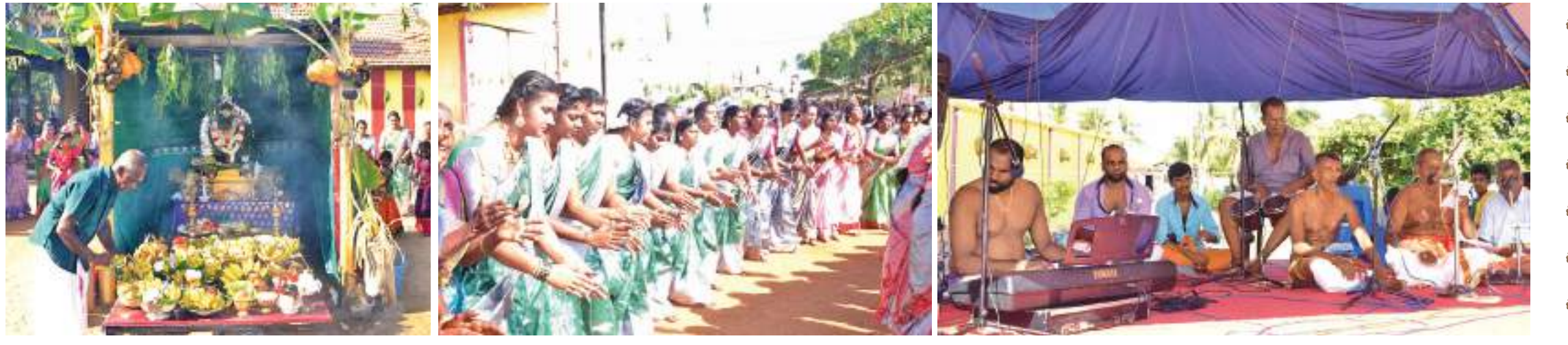
உட்புறின் வருடாந்த சித்திரைச் செவ்வாய் நிகழ்வு மிகவும் பக்தியாக புதன்கிழமை காலை(27) நடைபெற்றது. மாரியம்மன் அம்பாளின் அருளைப் பெற்றுக் கொள்ளும் முழு நோக்குடனும், இந்த நிகழ்வு காலம் காலமாக நடைபெற்று வருவது குறிப்பிடத்தக்கதாகும். இந்த வெப்ப காலத்தில் மக்களுக்கு அம்மை நோய் வருவதை நிவர்த்தி செய்யும் முகமாகவும், மழையை வேண்டியும் கிது நடைபெறுகின்றது.

கலாநிதி சிவலீர் கு.வை.க. வைத்தீஸ்வர குருக்கள்