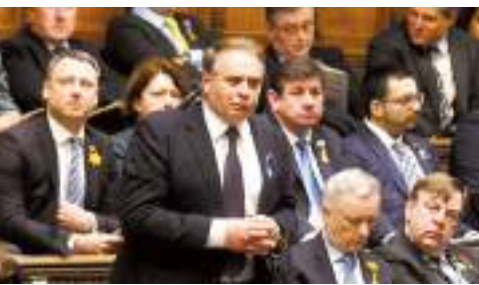
மடைந்திருப்பதையும் காண முடிந்தது. பதவியில் தொடரத் தகுதியற்றவன் என்பதையும் உணர்ந்தேன்" என்று அவர் குறிப்பிட்டுள்ளார். விசயியான பாரிஷ் ஆபாச படம் பார்த்தது குறித்து விளக்குகையில், "ஒரு இணையதளத்தில் டிராக்டர்கள் குறித்து தேடிக்கொண்டிருக்கும்போது தற்செயலாக தடை செய்யப்பட்ட ஆபாச படத்தை பார்க்க நேர்ந்தது. பார்க்க கூடாது தான், ஆனால், அதை சிறிது நேரம் பார்க்கவேண்டும்" என்றார்.

பிரிட்டன் பாராளுமன்ற சீழைவ அமர்வின் போது இரண்டு முறை கைபேசியில் ஆபாச படத்தை பார்த்ததாக எம்.பி நீல் பாரிஷ் ஒப்புக் கொண்ட நிலையில், கன்சர்வேட்டிவ் கட்சி அவரை நீக்கியுள்ளது. இதையடுத்து, எம்.பி பதவியிலிருந்து விலகியுள்ளதாக அவர் தெரிவித்துள்ளார். பாராளுமன்ற நிலைக்குழு ஆணையரிடம் ஆபாச படத்தை பார்த்ததாக ஒப்புக்கொண்ட நிலையிலேயே, நீல் பாரிஷை கன்சர்வேட்டிவ் கட்சி நீக்கியது. விசாரணை நடைபெறும் வரை, எம்.பி பதவியில் தொடர்வேன் என அவர் கூறியிருந்த நிலையில், சனிக்கிழமை தனது பதவியை இராஜினாமா செய்துள்ளார். "இறுதியில், எனது குடும்பம், தொகுதி மக்கள் ஆகியோர் என்னால் கோபமடைந்திருப்பதையும் காய