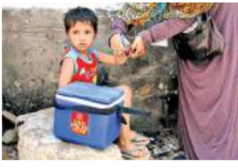
எடுக்கப்படுவதாக சுகாதார அமைச்சர் அப்துல் காதிர் பட்டேல் தெரிவித்துள்ளார். அண்மைய ஆண்டுகளில் போலியோ வேகமாக குறைந்து வந்த நிலையில் அண்டைய நாடான ஆப்கானிடன் உலகில் போலியோ பாதிப்பு உள்ள நாடாக பாகிஸ்தான் தொடர்ந்து நீடிக்கிறது.

பாகிஸ்தானில் இரண்டாவது போலியோ தொற்று சம்பவம் வடக்கு வசிரில்ல்தானில் இரண்டு வயது சிறுமிகளில் ஒருவரிடம் பதிவாகியுள்ளது. இதனை சுகாதார அமைச்சின் பேச்சாளரும் உறுதி செய்துள்ளார். கடந்த ஏப்ரல் 22 ஆம் திகதி முதல் சம்பவம் கண்டுபிடிக்கப்பட்டிருக்கும் நிலையிலேயே மற்றொரு தொற்று சம்பவம் பதிவாகியுள்ளது. நாட்டில் மேலும் போலியோ வைரஸ் கண்டுபிடிக்கப்பட்டிருப்பது குறித்து சுகாதார அமைச்சு கவலையை வெளியிட்டுள்ளது. போலியோ தொற்றை ஒழிப்பதற்காக அவசர அடிப்படையில் ஆக்கபூர்வமான நடவடிக்கைகள் எடுக்கப்படுவதாக சுகாதார அமைச்சர் அப்துல் காதிர் பட்டேல் தெரிவித்துள்ளார். அண்மைய ஆண்டுகளில் போலியோ வேகமாக குறைந்து வந்த நிலையில் அண்டைய நாடான ஆப்கானிடன் உலகில் போலியோ பாதிப்பு உள்ள நாடாக பாகிஸ்தான் தொடர்ந்து நீடிக்கிறது.