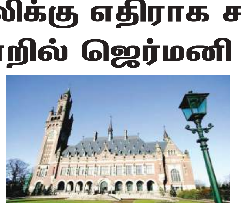
வழக்குகளில் இத்தாலியில் உள்ள ஜெர்மனிக்கு சொந்தமான சொத்துகள் பறிமுதல் செய்யப்பட வாய்ப்பு உள்ள நிலையிலேயே ஜெர்மனி ஐ.நா நீதிமன்றம் சென்றுள்ளது. வரும் மே 25 ஆம் திகதி இத்தாலி நீதிமன்றம்

நாஜி காலத்து போர் குற்றங்களுக்காக இத்தாலி இழப்பீடு கோர முயற்சிப்பது தொடர்பில் இத்தாலிக்கு எதிராக ஜெர்மனி ஐ.நா உயர் நீதிமன்றத்தில் வழக்குத் தொடுத்துள்ளது. இத்தாலி இழப்பீடு கோருவது ஏற்க முடியாதது என்று 2012 இன் தீர்ப்பு ஒன்று கூறுகின்றபோதும் அந்த நாடு உள்நாட்டில் தொடர்ந்து வழக்குகளை தொடுத்து வருவதாக சர்வதேச நீதிமன்றத்தில் தாக்கல் செய்த மனுவில் ஜெர்மனி குறிப்பிட்டுள்ளது. இத்தீர்ப்புக்கும் பின்னரும் இத்தாலியில் 25க்கும் அதிகமான வழக்குகள் தாக்கல் செய்யப்பட்டிருப்பதாக அதில் கூறப்பட்டுள்ளது. சில வழக்குகளில் ஜெர்மனி இழப்பீடு வழங்கவும் தீர்ப்பு அளிக்கப்பட்டுள்ளது. இதில் தற்போது இடம்பெற்று வரும்