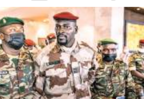
அரசுக்கு கையளிக்கத் தவறியது குறித்து இராணுவ ஆட்சியின் மீது அதிருப்தி வலுத்து வருகிறது. இந்தநிலையில் சிவில் அரசை அமைப்பதற்கு மேற்கு ஆபிரிக்க நாடுகளின் கூட்டணி கடந்த திங்கட் கிழமை கெடு விதித்ததை அடுத்தே கினிய இராணுவம் இந்த அறிவிப்பை வெளியிட்டுள்ளது.

கினியாவில் 39 மாத நிலைமற்ற காலத்துக்குப் பின் சிவில் அரசை கொண்டுவரப் போவதாக அந்நாட்டு இராணுவ அரசு அறிவித்துள்ளது. இந்த பிரேரணை கினிய பாராளுமன்றத்திற்கு விடப்படுவதாக இராணுவ அரசின் தலைவர் கர்னல் மமாடி டவும்போயா தொலைக்காட்சியில் உரையாற்றும்போது தெரிவித்துள்ளார். அவரது இராணுவம் கடந்த ஆண்டு ஜனநாயக முறையில் தேர்வான ஜனாதிபதியை பதவி கவிழ்த்தார். இதனை ஆரம்பத்தில் பல கினிய நாட்டினர்களும் வரவேற்றனர். எனினும் ஆட்சியை சிவில்