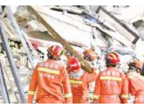
மேயர் தெரிவித்துள்ளார். இதுவரை எந்த உயிரிழப்பும் பதிவாகாத நிலையில் இடிபாடுகளில் இருந்து ஐவர் மீட்கப்பட்டுள்ளனர். இந்த சம்பவம் தொடர்பில் ஒன்பது பேர் தடுப்புக்காவலில் வைக்கப்பட்டிருப்பதாக பொலிஸார் தெரிவித்துள்ளனர். கட்டிடத்தின் உரிமையாளரும் கட்டிடத்தின் வடிவமைப்பு, கட்டுமானம் ஆகியவற்றுக்கு பொறுப்பான மற்ற மூவரும் தடுப்புக்காவலில் வைக்கப்பட்டதாகச் சங்ஷா பொலிஸார் தெரிவித்தனர்.

மத்திய சீனாவில் இடித்துவிழுந்த கட்டிடத்தில் பல டஜன் பேர் சிக்கி இருப்பதாக அதிகாரிகள் தெரிவித்துள்ளனர். உயிர்தப்பியோரைத் தேடி மீட்புப் பணிகள் தொடர்ந்து இடம்பெற்று வருகின்றன. எட்டு மாடிகள் கொண்ட இடிந்த கட்டிடத்தில் ஹோட்டல் ஒன்று, அடுக்குமாடி குடியிருப்புகள் மற்றும் திரையரங்கு ஒன்று இருந்துள்ளது. ஹூனான் மாகாணத்தின் சங்ஷா நகரில் இருக்கும் இந்தக் கட்டிடம் கடந்த வெள்ளிக்கிழமை மாலை இடிந்து விழுந்தது. தொடர்ந்து 23 பேர் சிக்கி இருப்பதாக மேலும் 39 பேரின் தொடர்பு துண்டிக்கப்பட்டிருப்பதாக சங்ஷா