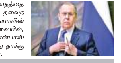
உக்ரைன் மீதான ரஷ்ய படையெடுப்பு மாதத்தை தாண்டி நீடிக்கும் நிலையில் தலைநகர் கியேவை கைப்பற்றும் ரஷ்யாவின் முயற்சி தோல்வி அடைந்த நிலையில், அது தற்போது கிழக்கில் டொன்பால் பிராந்தியத்தை இலக்கு வைத்து தாக்குதல்களை தீவிரப்படுத்தியுள்ளது.

ரஷ்ய படையெடுப்பு மாதத்தை தாண்டி நீடிக்கும் நிலையில் தலைநகர் கியேவை கைப்பற்றும் ரஷ்யாவின் முயற்சி தோல்வி அடைந்த நிலையில், அது தற்போது கிழக்கில் டொன்பால் பிராந்தியத்தை இலக்கு வைத்து தாக்குதல்களை தீவிரப்படுத்தியுள்ளது.