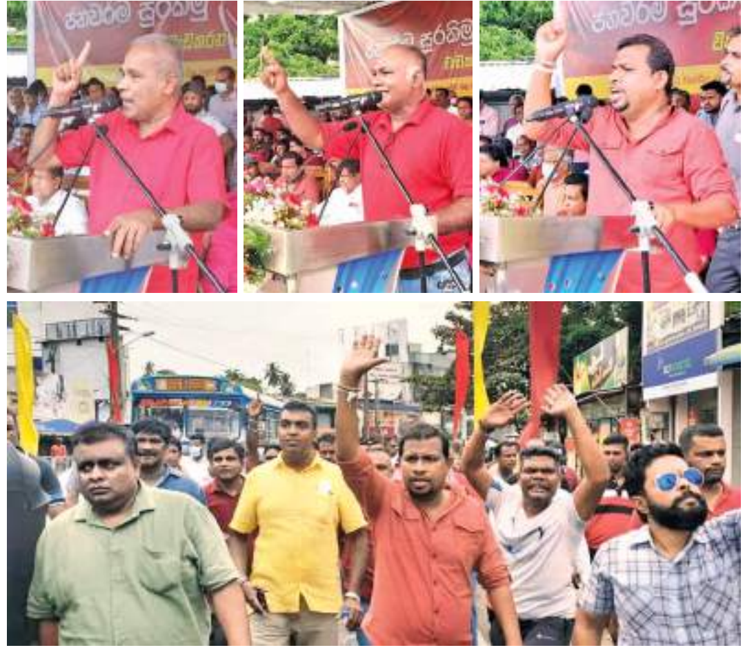
பொதுஜன முன்னேற்ற தொழிற்சங்கத்தின் மேதின ஊர்வலமும் கூட்டமும் நேற்று நுகேகொடையில் நடைபெற்றது. இதில் பெரும் திரளான மக்கள் கலந்து கொண்டனர்.