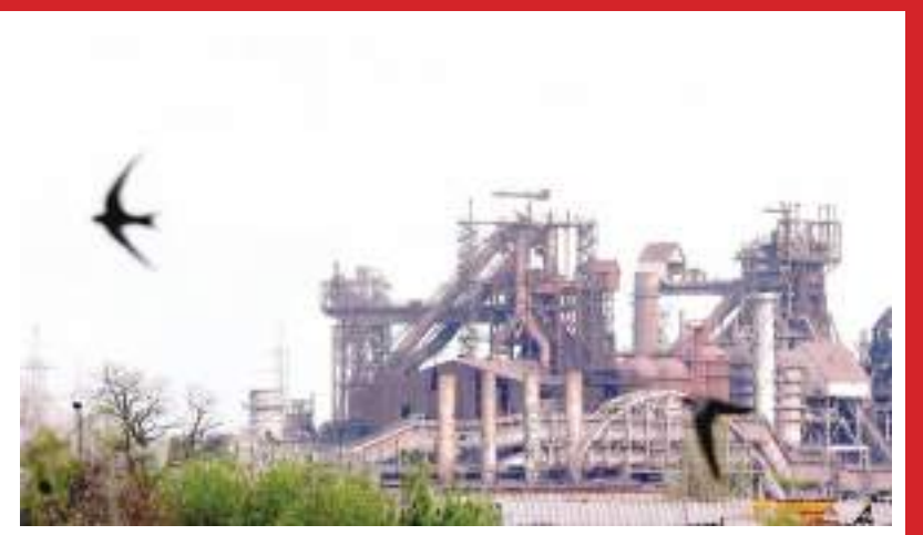
ஆலையில் இருந்து ஆறு சிறுவர்கள் உட்பட 25 பொதுமக்கள் வெளியேறியதாக ரஷ்ய ஊடகங்கள் செய்தி வெளியிட்டுள்ளன. எனினும் இவர்கள் எங்கு அழைத்துச் செல்லப்பட்டார்கள் என்பது பற்றி கூறப்படவில்லை. எனினும் 20 பெண்கள் மற்றும் சிறுவர்களே வெளியேறியதாக அந்த உருக்காலகங்கள் இருக்கும் உக்ரைன் படையினர் குறிப்பிட்டுள்ளனர். மரியூபோல் நகரை கைப்பற்றுவது உக்ரைனின் ஒட்டுமொத்த

உக்ரைனின் தெற்கு நகரான மரியூபோலில் உக்ரைனிய துருப்புக்களின் கட்டுப்பாட்டில் இருக்கும் கடைசி பகுதியான அசோவ்ஸ்டால் உருக்கு ஆலைகள் இருந்து சுமார் 20 பொதுமக்கள் வெளியேறியுள்ளனர். இந்த பாரிய கைத்தொழில் வலயத்தை முடக்குவதற்கு ரஷ்ய ஜனாதிபதி விளாடிமிர் பட்டின் கடந்த வாரம் உத்தரவிட்ட நிலையில் அந்தப் பகுதியில் இருந்து வெளியேறும் முதல் குழு இதுவாகும். அங்கு தொடர்ந்து சிக்கி இருப்பதாக கூறப்படும் சுமார் 1,000 பொதுமக்களை விடுவிப்பது தொடர்பான பேச்சுவார்த்தை தொடர்ந்து இடம்பெற்று வருகிறது. இதேநேரம் கிழக்கு உக்ரைனில் தமது தாக்குதல்களை தொடர்ந்து முன்னெடுத்து வருவதாக ரஷ்யா குறிப்பிட்டுள்ளது. மரியூபோல் நகரை கைப்பற்றியதாக ஒரு வாரத்திற்கு முன் ரஷ்யா அறிவித்த நிலையில் "விமானங்கள் பறக்க முடியாத வகையில் இந்த கைத்தொழில் வலயத்தை முடக்கும்படி", பட்டின் தனது துருப்புக்களக்கு உத்தரவிட்டார். எனினும் இந்த உருக்கு