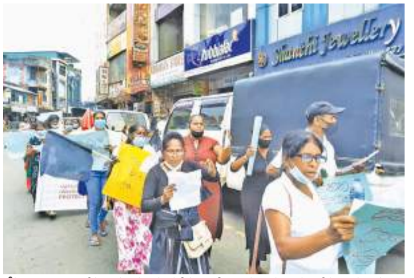
வீட்டு வேலை பணிப்பவர்கள் சங்கத்தின் மேதின ஊர்வலம் ஹற்றளில் இடம்பெற்றது.