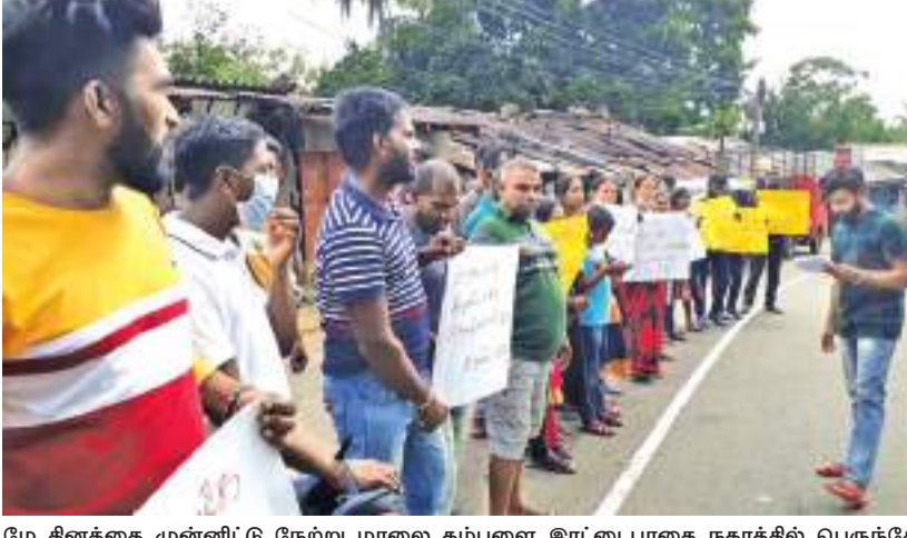
மே தினத்தை முன்னிட்டு நேற்று மாலை கம்பளை இரட்டைப்பாதை நகரத்தில் பெருந்தோட்டத்திலுள்ள கல்வி கற்ற இளைஞர் யுவதிகள் ஒன்றிணைந்து "சுரண்டாபதே சுரண்டாபதே தொழிலாளர்களின் உழைப்பை சுரண்டாபதே" இரட்டைப்பாதை மலையக கல்விக்கூடு வெளிச்சம் கிடைப்பு என்போது" மலையக மக்களின் அடிப்படை சம்பளத்தை உயர்த்த வேண்டும்" என பல்வேறு சுவாகங்களான ஏந்தியவாறு போராட்டம் நடத்தினர்.

அதிர்வுகளை தடுத்தாடும். இலங்கை தொழிலாளர் காங்கிரஸ் அரசாங்கம் இலங்கை குடிநீர் மேலாண்மைத் துறைக்கு நிதி உதவியை வழங்க வேண்டும் என கோரியும், ஆனால் இலங்கை அரசாங்கம் இதற்கான உதவியை வழங்கவில்லை. இலங்கை அரசாங்கம் இலங்கை குடிநீர் மேலாண்மைத் துறைக்கு நிதி உதவியை வழங்க வேண்டும் என கோரியும், ஆனால் இலங்கை அரசாங்கம் இதற்கான உதவியை வழங்கவில்லை.