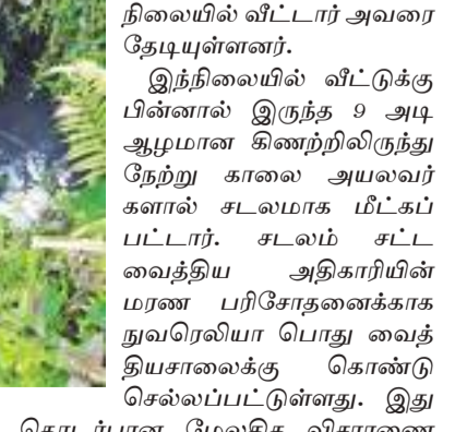
நிலையில் வீட்டார் அவரை தேடிவந்தனர். வீட்டுக்கு பின்னால் இருந்த 9 அடி ஆழமான கிணற்றிலிருந்து நேற்று காலை அயல்வர் களால் சடலமாக மீட்கப்பட்டார். சடலம் சட்ட வைத்திய அதிகாரியின் கலை பரிசோதனைக்காக நுவரெலியா பொது வைத்தியசாலைக்கு கொண்டு செல்லப்பட்டுள்ளது. இதுவரை இவ்வாறு சடலமாக மீட்கப்பட்டிருந்தது இதுவரையில் இரண்டு இரண்டு வெளியே சென்றவர் வீடு திரும்பாத

தலவாக்கலை குறுப் நிருபர் தலவாக்கலை கிரேட் வெஸ்டன் ஸ்கல்பா தோட்டத்தில் வயன் தொட்டி குடி மிருப்பொன்றின் பின்னால் இருந்த 9 அடி ஆழமான கிணற்றிலிருந்து ஒருவரின் சடலம் (2) மீட்கப்பட்டுள்ளதாக தலவாக்கலை பொலிஸார் தெரிவித்தனர். வேலூராஜாட்டணம் வயது (50) இரண்டு பின்னாள் இறந்தார் என்று கிணற்றிலிருந்து கிணற்றிலிருந்து மீட்கப்பட்ட சடலம் சட்ட வைத்திய அதிகாரியின் கலை பரிசோதனைக்காக நுவரெலியா பொது வைத்தியசாலைக்கு கொண்டு செல்லப்பட்டுள்ளது. இதுவரை இவ்வாறு சடலமாக மீட்கப்பட்டிருந்தது இதுவரையில் இரண்டு இரண்டு வெளியே சென்றவர் வீடு திரும்பாத