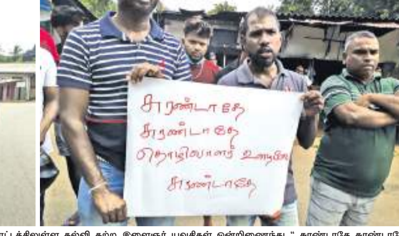
மே தினத்தை முன்னிட்டு நேற்று மாலை கம்பளை இரட்டைப்பாதை நகரத்தில் பெருந்தோட்டத்திலுள்ள கல்வி கற்ற இளைஞர் யுவதிகள் ஒன்றிணைந்து "சுரண்டாபதே சுரண்டாபதே தொழிலாளர்களின் உழைப்பை சுரண்டாபதே" இரட்டைப்பாதை மலையக கல்விக்கூடு வெளிச்சம் கிடைப்பு என்போது" மலையக மக்களின் அடிப்படை சம்பளத்தை உயர்த்த வேண்டும்" என பல்வேறு சுவாகங்களான ஏந்தியவாறு போராட்டம் நடத்தினர்.