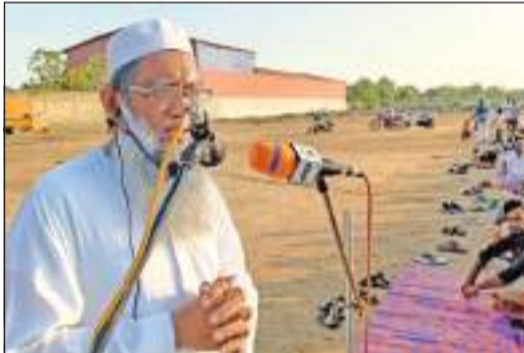
அக்கரைப்பற்று வடக்கு தினகரன் நிருபர்

சர்வதேசப்பிறை அடிப்படையில் புனித நோன்புப் பெருநாள் தொழுகை அக்கரைப்பற்று பொது விளையாட்டு மைதான திறந்த வெளியில் நேற்று திங்கட்கிழமை (02) காலை 6.30மணிக்கு இடம்