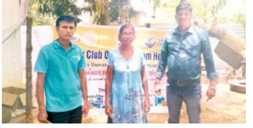
சுன்னாகம் பாரம்பரிய ரோட்டிக் கழித்தினால் கடந்த 01/05 ஞாயிற்புதன்கிழமை யாழ்ப்பாணம் இளவாலைப் பகுதியைச் சேர்ந்த பயனாளி ஒருவருக்கு வாழ்வாதார உதவியாக கோழிகள் மற்றும் கோழிக்கூடு ஆகியவற்றை வழங்கி வைக்கப்பட்டன.