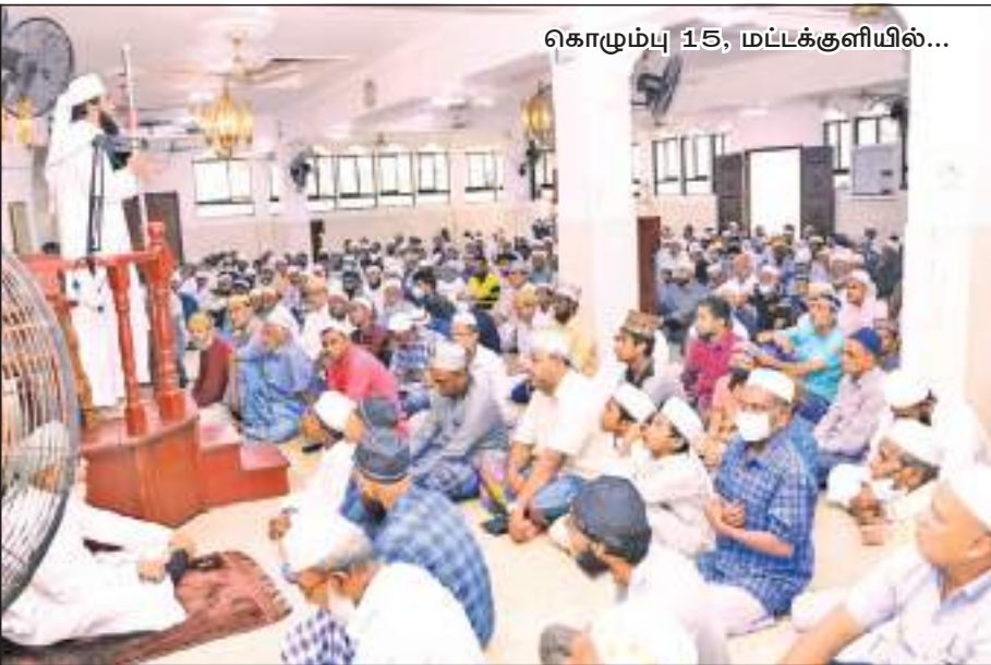
கொழும்பு 15, மட்டக்குளியில்...