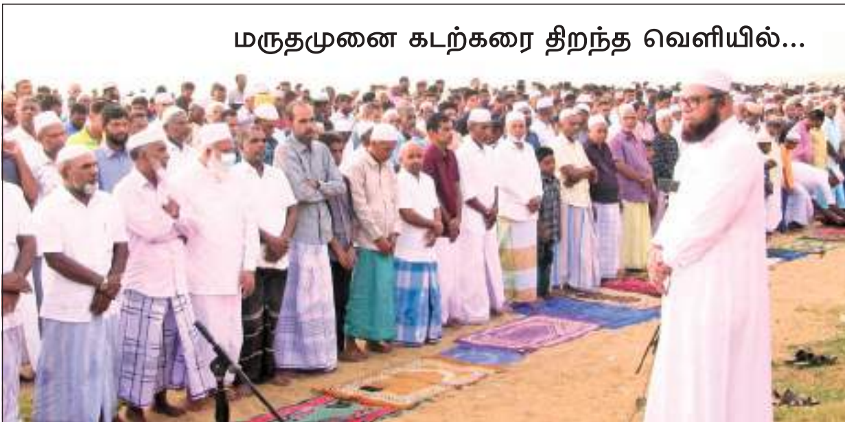
மருதமுனை கடற்கரை திறந்த வெளியில்...