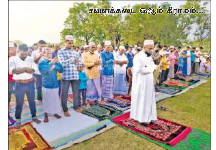
சவளக்கடை ஆய்ம் கிராமம்...