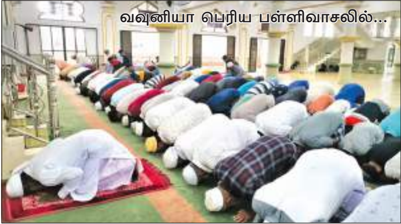
வவுனியா பெரிய பள்ளிவாசலில்...