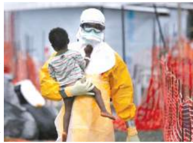
கசாதர அதிகாரிகள் அதிக கண்காணிப்புடன் பணியில் ஈடுபட்டு வருகின்றனர்.

இந்த வைரஸ் இதுவரை அந்நாட்டில் 13 முறை கண்டறியப்பட்டு உள்ளது. இதில் கடந்த 2018 - 2020 ஆம் ஆண்டுகளில் ஏற்பட்ட பரவலின் போது அதிகபட்சமாக 2,300 பேர் உயிரிழந்துள்ளனர். இந்தநிலையில் காங்கோ நாட்டில் வடமேற்கு பகுதியில் தற்போது மீண்டும் எபோலா வைரஸ் கண்டறியப்பட்டுள்ளது என தேசிய உயிரிழந்தவர்களை ஆய்வு மையம் தெரிவித்துள்ளது.