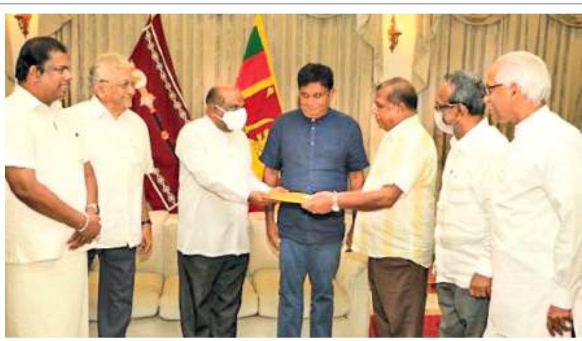
பிரதான எதிர்க்கட்சியான ஐக்கிய மக்கள் சக்தி நேற்று இரவு நம்பிக்கையில்லா பிரேரணைகளை சபாநாயகரிடம் கையளித்தது. ஜனாதிபதி கோட்டாபய ராஜபக்சவுக்கு எதிராக ஒரு நம்பிக்கையில்லா பிரேரணையை அரசாங்கத்துக்கு எதிராக மற்றொரு நம்பிக்கையில்லா பிரேரணையுமே கையளிக்கப்பட்டன.