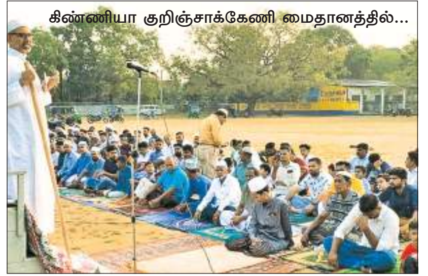
கிண்ணியா குறிஞ்சாக்கேணி மைதானத்தில்...