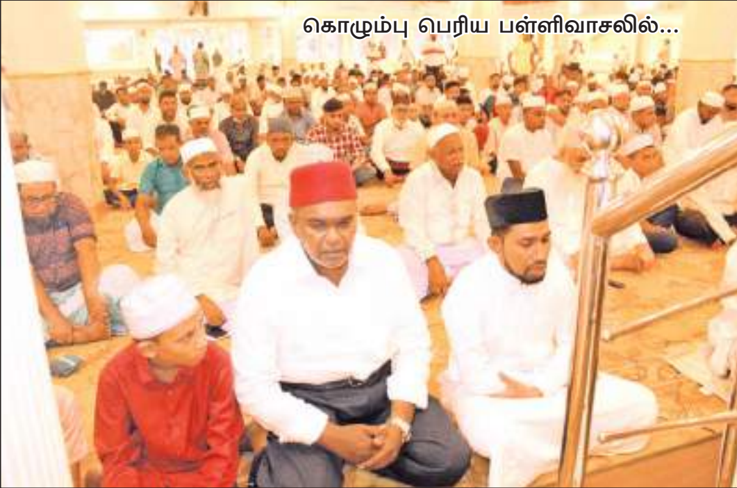
கொழும்பு பெரிய பள்ளிவாசலில்...