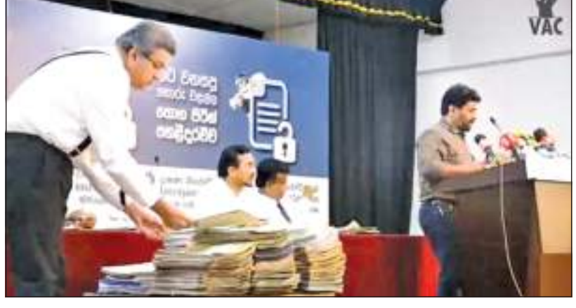
இலங்கை அரசியல்வாதிகள் மற்றும் அவர்களுடன் சம்பந்தப்பட்டவர்கள் தொடர்பான பல ஊழல் குற்றச்சாட்டுகளை மக்கள் விடுதலை முன்னணி (ஜேவிபி) நேற்று வெளிப்படுத்தியது. இலங்கை மன்றக் கல்லூரியில் நேற்று காலை நடைபெற்ற நிகழ்வில் ஜே.வி.பி., தேசிய மக்கள் சக்தியின் தலைவர் அநுரகுமார திசாநாயக்க எம்.பி., ஊழல் குற்றச்சாட்டுகள் தொடர்பான ஆவணங்களை வெளிப்படுத்தினார். 'நாட்டை நாசமாக்கிய திருட்டுக் கும்பலை ஒட்டுமொத்தமாக அம்பலப்படுத்துதல் எனும்