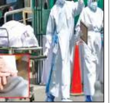
தொடர்ந்து அவரை பிரேத பரிசோதனை கூடத்திற்கு எடுத்து சென்றனர். ஆனால், அவர் உயிருடன் இருந்துள்ளார். அவரது உடல் பாகங்கள் அசைந்துள்ளன. இதனால், பரிசோதனை கூடத்தில் இருந்த ஊழியர்கள் அதிர்ச்சி அடைந்துள்ளனர். இதனை தொடர்ந்து அவர் மருத்துவமனைக்கு

சீனாவில் ஷாங்காய் நகரில் உள்ள முதியோருக்கான மருத்துவமனை ஒன்றில் இறந்து விட்டதாக அறிவிக்கப்பட்ட முதியவர் ஒருவர் பிரேத பரிசோதனை கூடத்திற்கு எடுத்து செல்லப்பட்டார். அங்கு அவரது உடல் பாகங்கள் அசைந்ததால் பரிசோதனை கூடத்தில் இருந்த ஊழியர்கள் அதிர்ச்சி அடைந்த சம்பவம் ஒன்று பதிவாகியுள்ளது. ஷாங்காய் நகரில் புட்டுவோ மாவட்டத்தில் உள்ள முதியோருக்கான மருத்துவமனை ஒன்றில் சிகிச்சைக்காக அனுமதிக்கப்பட்ட இறந்த முதியவர் ஒருவர் உயிரிழந்து விட்டார் என தவறாத லாக கூறப்பட்டுள்ளது. இதனை