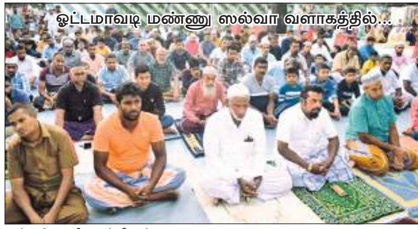
ஓட்டமாவடி மண்ணு ஸல்வா வளாகத்தில்...