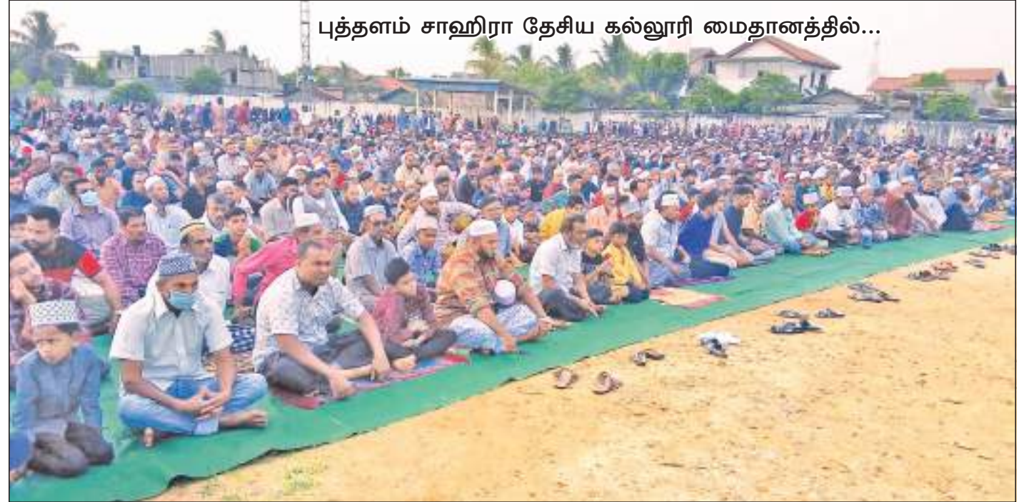
புத்தளம் சாஹிரா தேசிய கல்லூரி மைதானத்தில்...