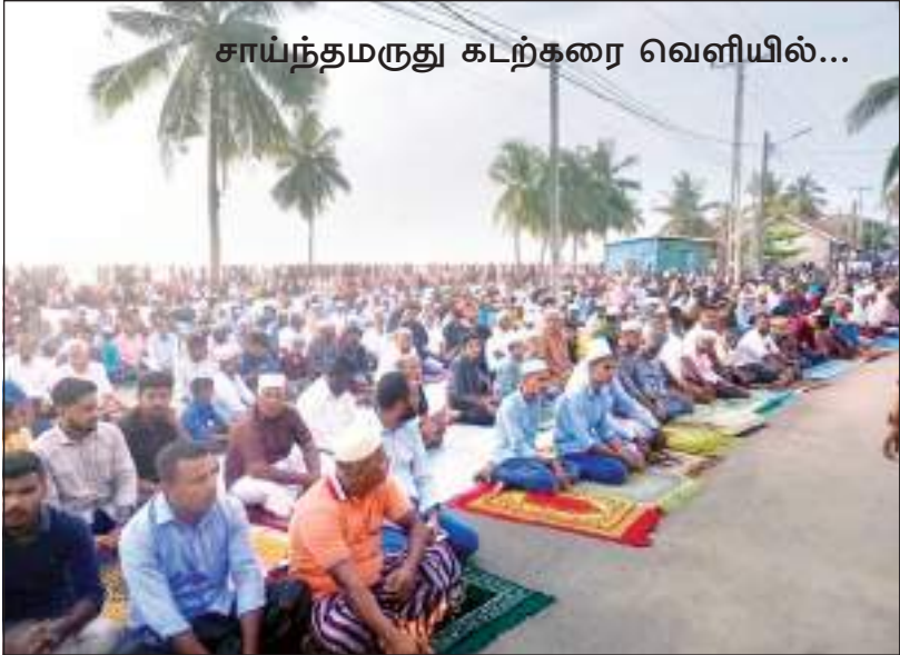
சாய்ந்தமருது கடற்கரை வெளியில்...