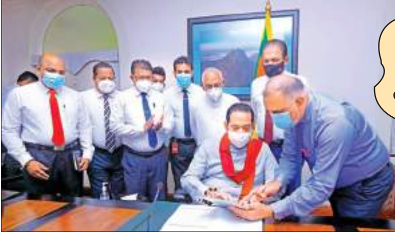
பாதுகாப்பு, ஆராய்ச்சிகளை மேற்கொள்ளல், கவரோவியங்கள் மற்றும் பிற தொல்பொருட்களை பாதுகாத்தல் மற்றும் தொல்லியல் துறையில் மனித வளங்களை மேம்படுத்துதல்

மத்திய கலாசார நிதியம் இலங்கையின் கலாசார பாரம்பரியத்தை நிர்வகிக்கும் முன்னணி நிறுவனமாகும். மேலும் இலங்கையின் முக்கிய தொல்பொருள் தளங்களின்