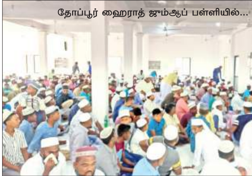
தோப்பூர் ஹைராத் ஜம்ஆப் பள்ளியில்...