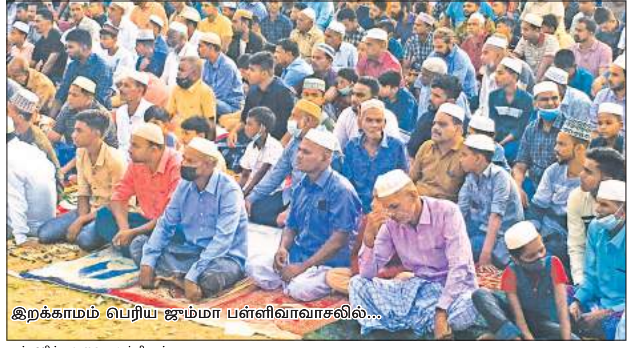
இறக்காமம் பெரிய ஜம்மா பள்ளிவாசலில்...