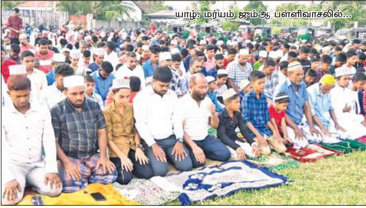
யாழ். மர்யம் ஜம்ஆ பள்ளிவாசலில்...