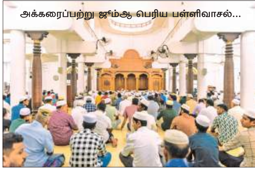
அக்கரைப்பற்று ஜம்ஆ பெரிய பள்ளிவாசல்...