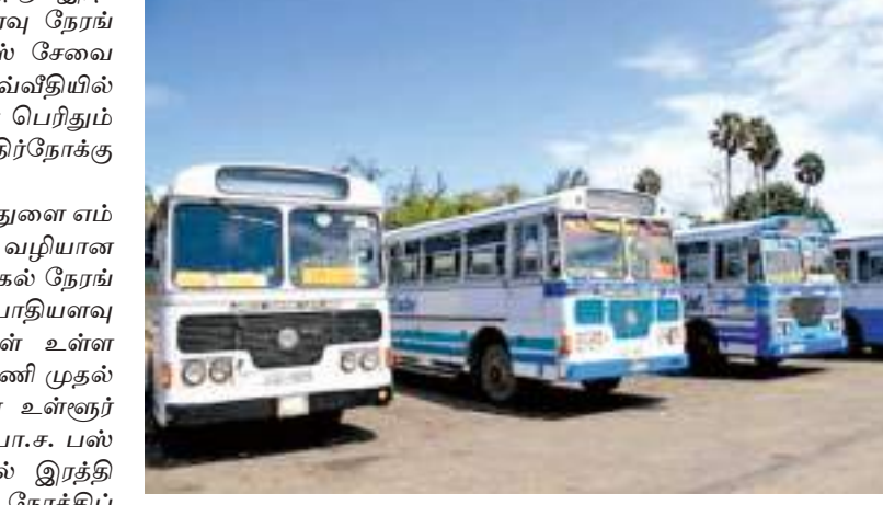
காத்திருக்கும் பயணிகளே இவ்வாறு பாதிக்கப்படுகின்றனர். எனவே உள்நகர் தனியார் இ.போ.ச.பஸ் வண்டிகளை இந்நேரத்திலும் பயணிக்க ஆவன செய்ய வேண்டுமென பயணிகள் வேண்டுகோள் விடுகின்றனர்.