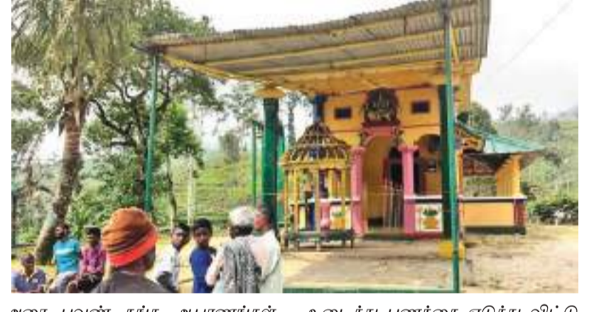
அரை பவுன் தங்க ஆபரணங்கள் மற்றும் உண்டியல் காணாமல் போய் உள்ளது என வாக்குமூலத்தில் பதிவு செய்து உள்ளனர். உண்டியல் பெட்டியை ஆலயத்திற்கு அருகில்