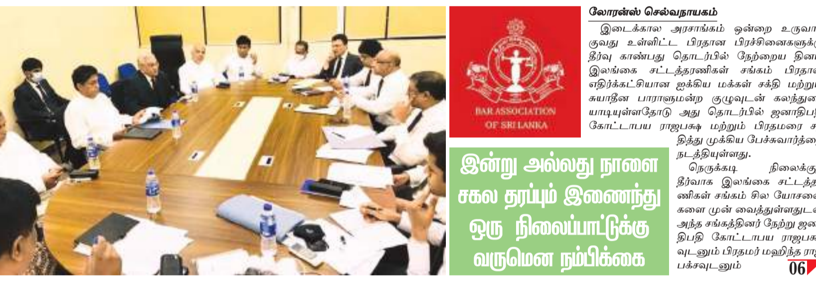
இடைக்கால அரசாங்கம் ஒன்றை உருவாக்குவது உள்ளிட்ட பிரதான பிரச்சினைகளுக்கு தீர்வு காண்பது தொடர்பில் நேற்றைய தினம் இலங்கை சட்டத்தரணிகள் சங்கம் பிரதான எதிர்க்கட்சியான ஐக்கிய மக்கள் சக்தி மற்றும் சுயாதீன பாராளுமன்ற குழுவுடன் கலந்துரையாடியுள்ளதோடு அது தொடர்பில் ஜனாதிபதி கோட்டாபய ராஜபக்சு மற்றும் பிரதமரை சந்தித்து முக்கிய பேச்சுவார்த்தை நடத்தியுள்ளது. நெருக்கடி நிலைக்குத் தீர்வாக இலங்கை சட்டத்தரணிகள் சங்கம் சில யோசனைகளை முன் வைத்துள்ளதுடன் அந்த சங்கத்தினர் நேற்று ஜனாதிபதி கோட்டாபய ராஜபக்சுவுடனும் பிரதமர் மஹிந்த ராஜபக்சுவுடனும் 06