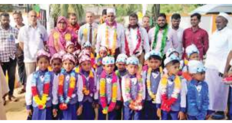
பாலமுனை உதுமாபுர தாறுல் ஹஸனாத் வித்தியாலத்தில் தரம் ஒன்று மாணவர்களின் வித்தியாரம்ப விழா இடம்பெற்ற போது, படம்: பாலமுனை கிழக்கு தினகரன் நிருபர்

தொழிலுக்காக சென்றவேளை இச் சம்பவம் இடம்பெற்றுள்ளது. கரையிலிருந்து சுமார் 100 மீற்றர் கடலில் தேணி வந்து கொண்டிருந்தவேளை இறங்கி வலையை சுழற்றும் பணியில் ஈடுபட்டு கொண் டிருந்த வேளையில் திடீரென இழுதுமீன் தலைப்பிட்டு மீனவரை சுற்றிக்கொண்டது. இதைத் தடுக்கவசை கண்ட ஏனைய மீனவர் அவரை காப்பாற்ற முயற்சி செய்தும் பலனளிக்கவில்லை. ஒருவாறு அவரை கரைக்கு கொண்டு வந்து வைத்திய சாலையில் சேர்த்தனர். எனினும் காப்பாற்ற முடியவில்லை.