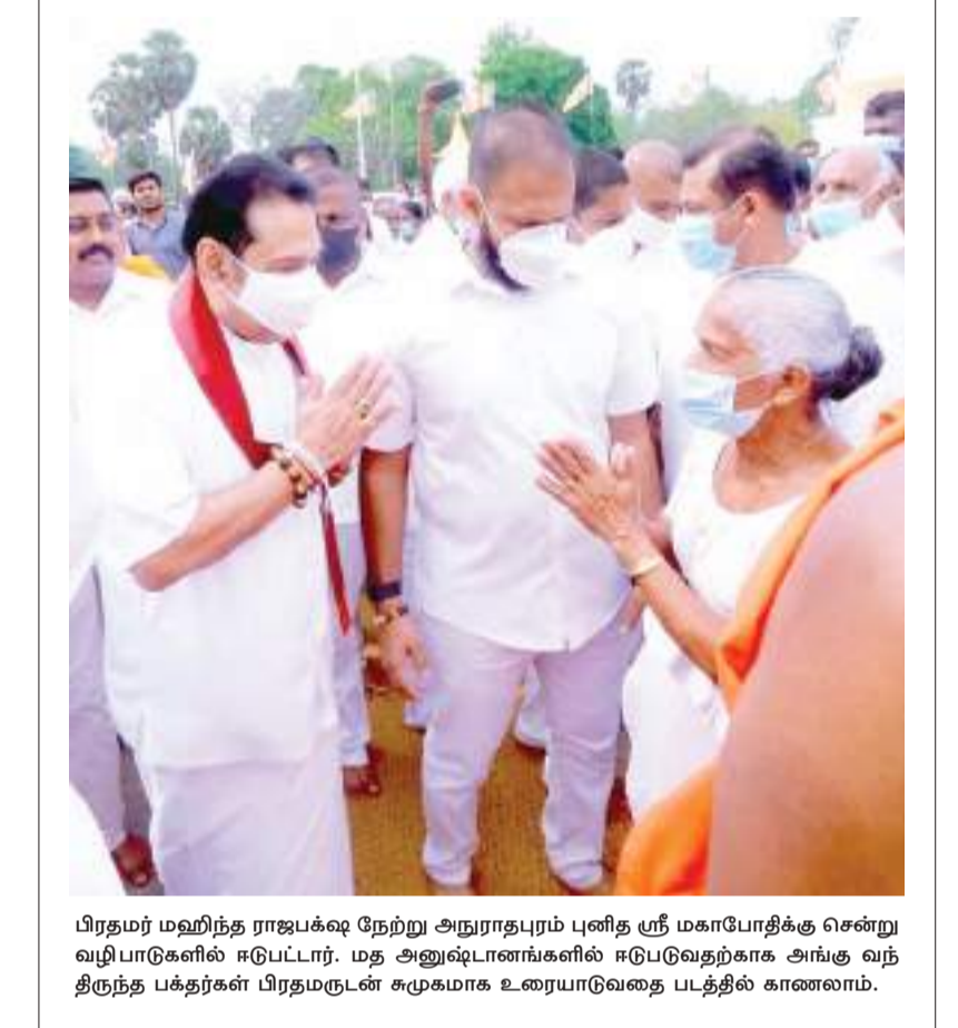
பிரதமர் மஹிந்த ராஜபக்சு நேற்று அந்நாடாழ்வார்புனித ஸ்ரீ மகாபொதிக் கு சென்று வழிபாடுகளில் ஈடுபட்டார். மத அணுவ்டாணங்களில் ஈடுபடுவதற்காக அங்கு வந்திருந்த பக்தர்கள் பிரதமருடன் சமூகமாக உரையாடுவதை படத்தில் காணலாம்.

இயல்பு வாழ்க்கைக்கு பாதிப்பு ஏற்படுத்தினால் உன் கைது பொதுமக்கள் பாதுகாப்பு அமைச்சின் செயலாளர் 03