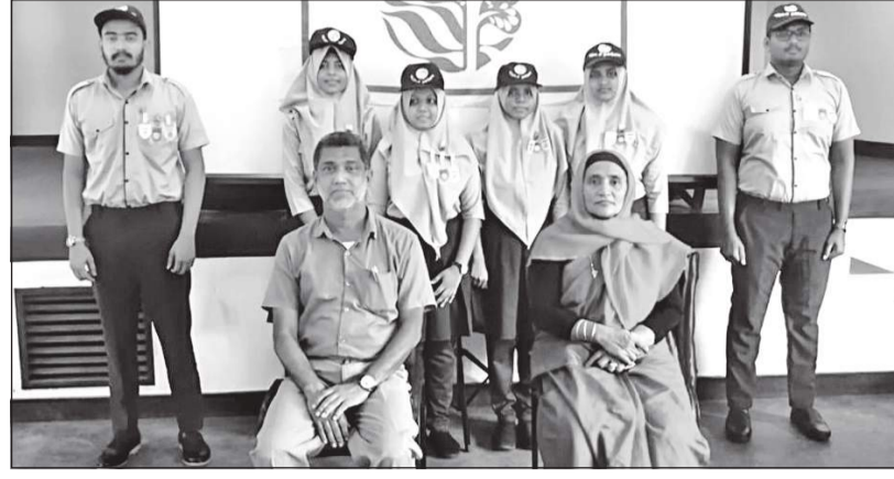
(புத்தளம் தினகரன் நிருபர்)