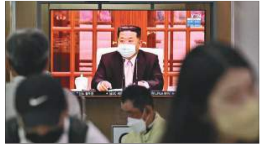
பட்டவர்களா என்பதை அது குறிப்பிடவில்லை.

அடையாளம் தெரியாத காய்ச்சலோடு இதுவரை 350,000க்கும் மேற்பட்டோர் அடையாளம் காணப்பட்டுள்ளனர் என்றும் அவர்களில் 162,000க்கும் அதிகமானோருக்குச் சிகிச்சை அளிக்கப்பட்டது என்றும் அந்த செய்தி நிறுவனம் கூறியது. இருப்பினும் அவர்கள் கொவிட்-19 தொற்றால் பாதிக்கப்