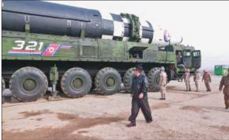
பது பற்றிய சந்தேகங்களுக்கு மத்தியலேயே இந்த புதிய ஏவுகணை சோதனை இடம்பெற்றுள்ளது. வட கொரியாவில் முதல் முறையாக கொரோனா வைரஸ் தொற்று

வட கொரியா 2017 ஆம் ஆண்டு இடை நிறுத்திய அணு ஆயுத சோதனையை மீண்டும் ஆரம்பிப்பது பற்றிய சந்தேகங்களுக்கு மத்தியலேயே இந்த புதிய ஏவுகணை சோதனை இடம்பெற்றுள்ளது. வட கொரியாவில் முதல் முறையாக கொரோனா வைரஸ் தொற்று