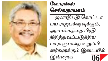
லோரன்ஸ் செல்வநாயகம் ஜனாதிபதி கோட்டாபய ராஜபக்சைக்கும், அரசாங்கத்தின் பிரதிநிதித்துவப்படுத்திய பாராளுமன்ற உறுப்பினர்களுக்கும் இடையில் இன்றைய 06