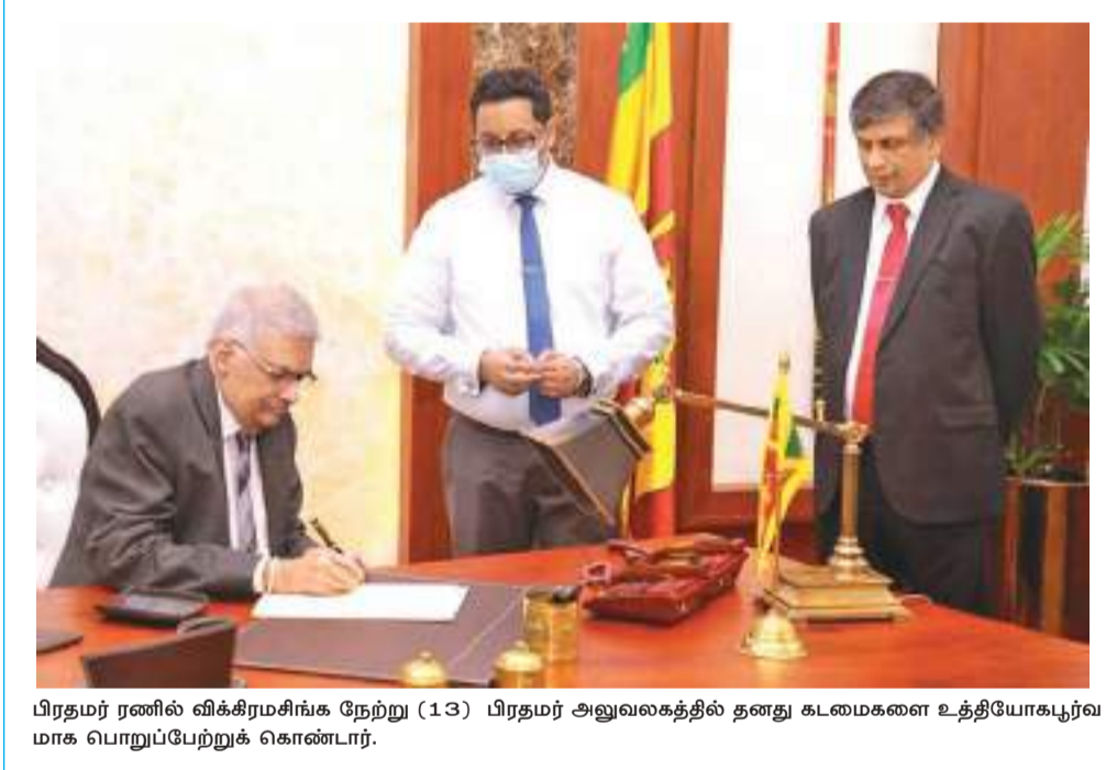
பிரதமர் ரணில் விக்கிரமசிங்க நேற்று (13) பிரதமர் அலுவலகத்தில் தனது கடமைகளை உத்தியோகபூர்வமாக பொறுப்பேற்றுக் கொண்டார்.