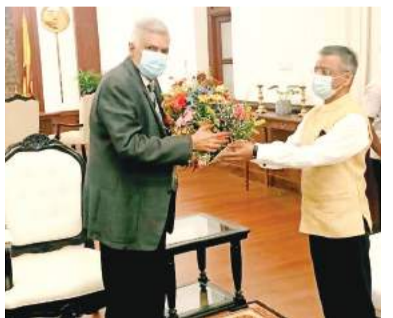
இலங்கைக்கான இந்திய உயர்ஸ்தானிகர் கோபால் பாக்கோ, நேற்று பிரதமர் ரணில் விக்கிரமசிங்கவை சந்தித்து வாழ்த்து தெரிவித்தார். அனைத்து மக்களினமும் நல்லாடும் நோக்கிய ஜனநாயக செயன்முறை ஊடான இலங்கையின் பொருளாதார மீட்டி மற்றும் ஸ்திரீத்தன்மைக்காக இந்தியா தொடர்ந்து ஒத்துழைப்பை வழங்கும் என அவர் தெரிவித்தார்.