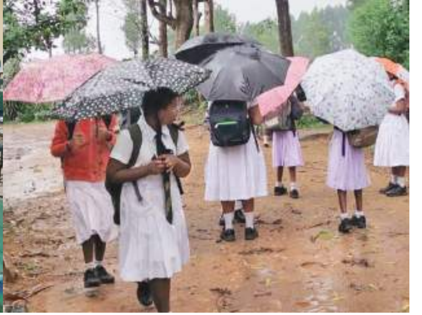
மலையக பெருந்தோட்டப் பகுதிகளில் பாடசாலைகளில் மாணவர்களின் வருகை மிகவும் குறைந்த அளவிலேயே காணப்பட்டது. நாட்டில் ஊரடங்குச் சட்டம் சில மணித்தியாலங்கள் தளர்த்தப்பட்ட போதிலும், மலையகத்தில் நிலவிய சீற்ற காலநிலை காரணமாகவும் மாணவர்களின் வருகை மிக குறைவாகவே நேற்றைய தினம் காணப்பட்டது.