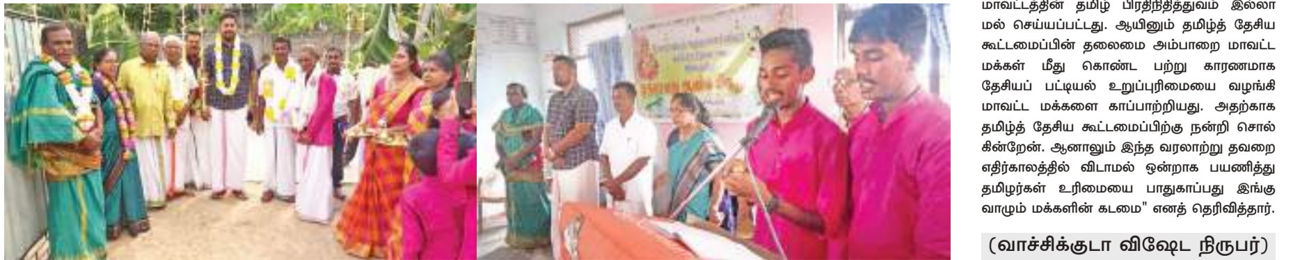
(வாச்சிக்குடா விஷ்ட நிருபர்)