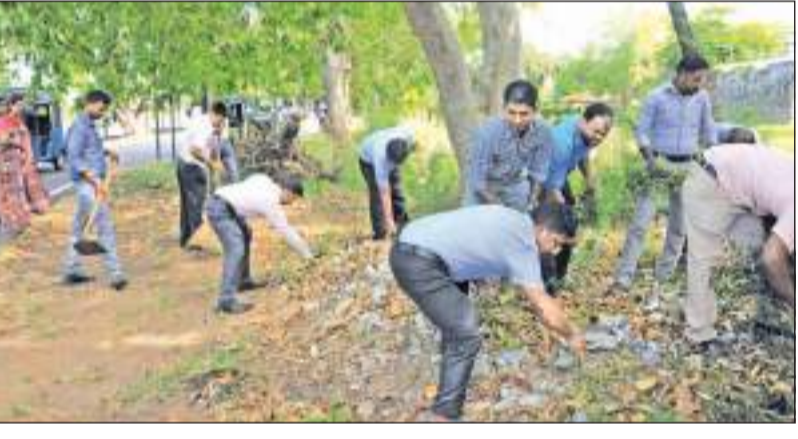
(கல்லடி குறாப், மட்டக்களப்பு குறாப், மட்டக்களப்பு விசேட, ஆரையம்பதி தினகரன் நிருபர்கள்)

மட்டக்களப்பில் டெங்கு ஒழிப்பு சிரமதான வேலைத்திட்டம் இடம்பெற்று வருகின்றது. நாட்டில் கொரோனா வைரஸ் பரவல் குறைவடைந்துள்ள நிலையில், டெங்கு பரவல் அதிகரித்து வருவதாகக் ககாதார பிரிவு தகவல்கள் தெரிவிக்கின்றன. மாவட்டத்திலிருந்து கொரோனா மற்றும் டெங்கு நோயினைக் கட்டுப்படுத்தும் முகமாக பொதுமக்கள் ககாதார நடவடிக்கைகளை முழுமையாக பின்பற்றுவதற்கும், விசேட விழிப்புணர்வு செயற்றிட்டங்களை மாவட்டம் முழுவதும் நடைமுறைப்படுத்துவதற்கும் தேவையான நடவடிக்கைகளை