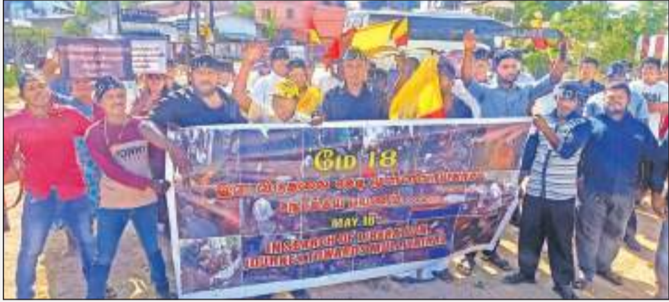
(அன்பு வழிபடும் தினகரன் நிருபர்)

'வீழ்ந்த இடத்தில் எழுவோம்' எனும் தலைப்பில் ஆரம்பம்