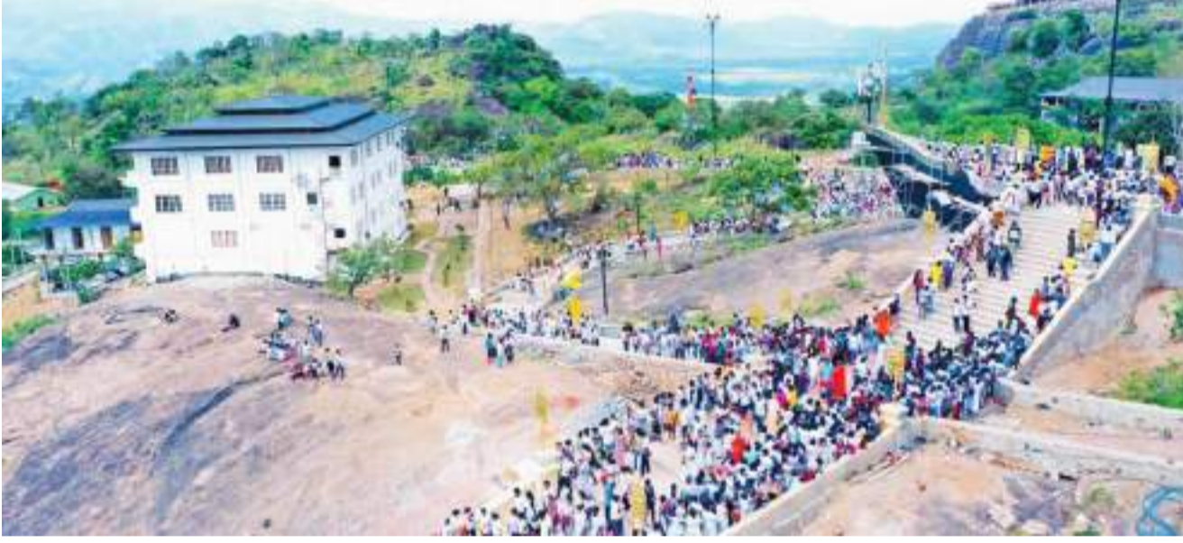
அரச வெசாக் தினம் இம்முறை கூரகல விஹாரையில் நடைபெற்றபோது பிடிக்கப்பட்ட படம்