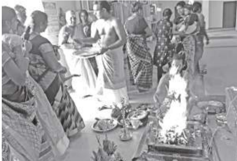
வகைசி விசாக பெரன்மை தினத்தை முன்னிட்டு உட்பு ஸ்ரீ வீரபத்திரகாளியம்மன் ஆலயத்தில் விசாக அபிஷேகம், யாசம் வளர்த்தல் குரூபிற்றுக்கிழமை (15) காலையிலும்பெற்றது. அதனைத் தொடர்ந்து அன்னதானம் போன்றவையும் வழங்கப்பட்டன. கிதன்போது பக்தர்கள் கலந்து கொண்டு அம்மனின் அருளைப் பெற்றுக் கொண்டனர். உட்பு குறுப் நிருபர்