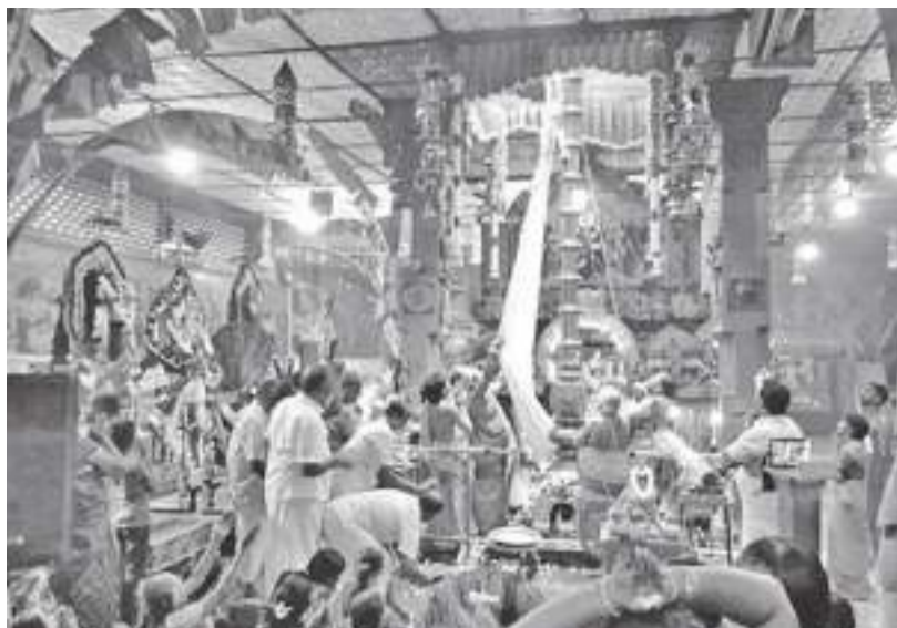
கொழும்பு 11. கதிர்சன் வீதியில் அமைந்துள்ள ஸ்ரீ கதிர்வலையடி சுவாமி திருக்கோயிலின் மகோற்சவம் அண்மையில் கொண்டாட்டம் ஆரம்பமாகியது .

அறிவித்து அதை மையக் கருவியாக அறிவித்தார். அத்துகோரள வின்மேல் பலமுறை கேட்டுப்போதும், அவர் அது தொடர்பில் எதனையும் தெரிவிக்கவில்லை. பிரதி சபாநாயகராக ஏக மனதாக ஒருவரை தெரிவு செய்ய வேண்டுமென வலியுறுத்தின.