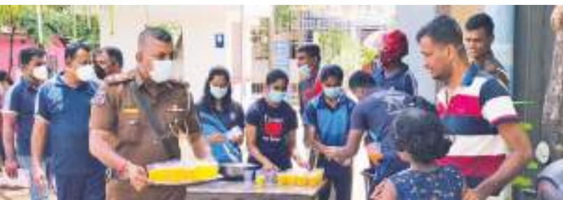
யாழில் வசைக் தினத்தன்று பாதுகாப்புத் தரப்பினரால் பொதுமக்களுக்கு உணவு மற்றும் குளிர்பானங்கள் வழங்கப்பட்டன. மாண்புமம் பொலிஸரால் குளிர்பானம் வழங்கப்பட்டதுடன் கிரானூவத்தினரால் பருத்தித்துறைப் பகுதியில் காலை உணவு வழங்கப்பட்டது. (கரவெடி தினசரி நிருபர்)

இதனால், சிலர் பாராளுமன்றக்குள் வருவதற்கு அச்சமடைவதாகவும், பாராளுமன்ற உறுப்பினர்களின் பாதுகாப்பை கவனத்தில் கொண்டு அந்த நபர்கள் யார்? என்பதை கண்டறிந்து நடவடிக்கைகளை எடுக்குமாறும் அவர் கேட்டுக்கொண்டார்.