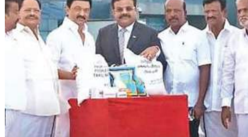
கோடி மதிப்பில் உயிர் காக்கக்கூடிய 137 மருந்துப் பொருட்களும், 15 கோடி ரூபாய் மதிப்பிலான குழந்தைகளுக்கு வழங்க 500 தொன் பால்மா

இலங்கை வரலாற்றில் இல்லாத அளவுக்கு பொருளாதார சிக்கலில் தவித்து வருகிறது. இதனையடுத்து தமிழக பேரவையில் இலங்கை தமிழர்களுக்கு உதவிடும் வகையில் தீர்மானம் கொண்டு வரப்பட்டது. பொருளாதார நெருக்கடியில் சிக்கித் தவிக்கும் ஒட்டுமொத்த இலங்கை மக்களுக்காக, ௯.80 கோடியில் 40,000 தொன் அரிசியும், ௯.28