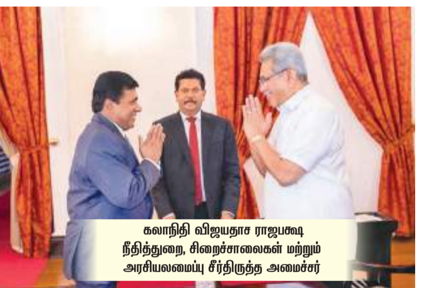
கலாநிதி விஜயதாச ராஜபகஷ நீதித்துறை, சிறைச்சாலைகள் மற்றும் அரசியலமைப்பு கீர்த்திருத்த அமைச்சர்

இந்திய தேசிய பாதுகாப்பு ஆலோசகர் உயர்ஸ்தானிகர் மிலிந்த மொரகொட விசேட கலந்துரையாடல் இந்தியாவுக்கான இலங்கை உயர்ஸ்தானிகர் மிலிந்த மொரகொட, இந்திய தேசிய பாதுகாப்பு ஆலோசகர் ஸ்ரீ அஜித் குமார் தோவாலை, (19) புது டெல்லியில் உள்ள அ வ ரு அலுவலகத்தில் சந்தித்தார். இந்திய அரசாங்கம் இலங்கைக்கு வழங்கும் ஆதரவிற்கு உயர்ஸ்தானிகர் மொரகொட, இந்திய தேசிய பாதுகாப்பு ஆலோசகர் கருக்கு நன்றி தெரிவித்தார். இந்த நிலையில், இலங்கையின் பொருளாதார மீட்சிக்கு சர்வதேச ஆதரவைப் பெறுவதற்கு இந்தியா