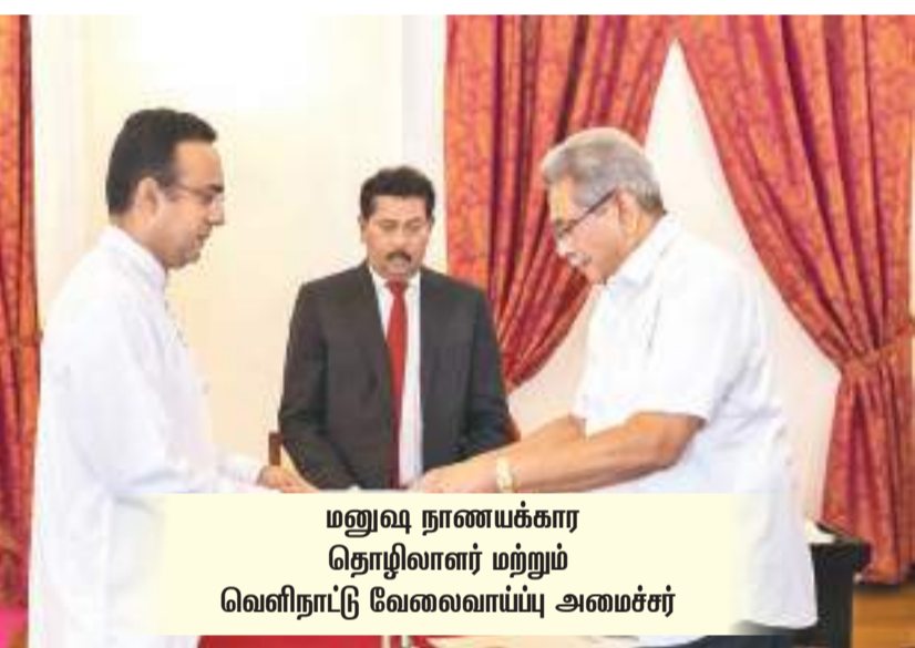
மனுவா நாணயக்கார தொழிலாளர் மற்றும் வெளிநாட்டு வேலைவாய்ப்பு அமைச்சர்