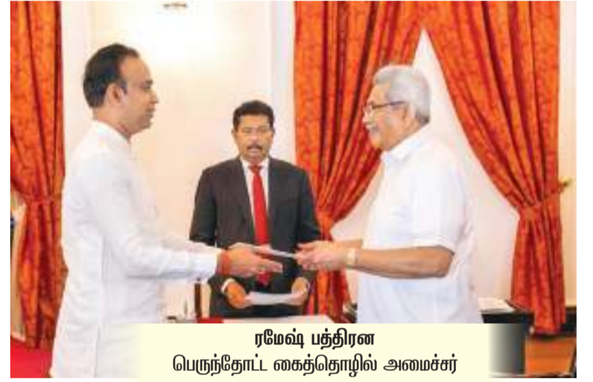
ரமேஷ் பத்திரன் பெருந்தோட்ட கைத்தொழில் அமைச்சர்