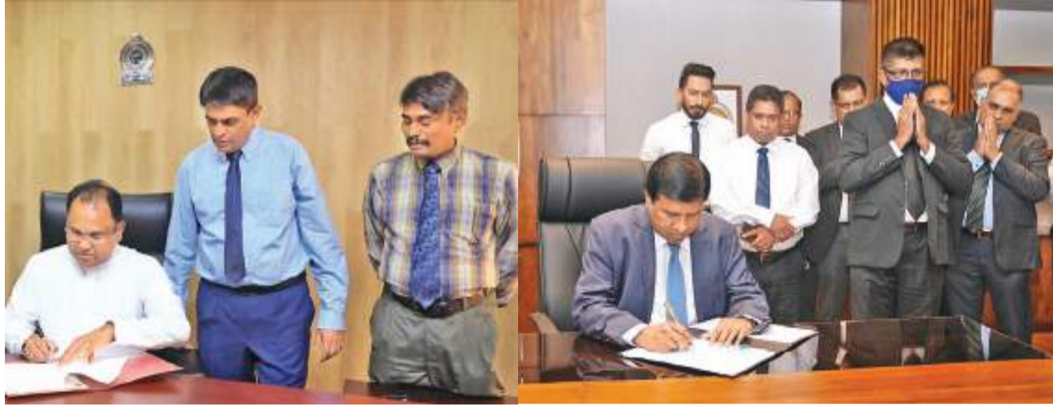
நீதித்துறை, சினைச்சாலைகள் மற்றும் அரசியலமைப்பு, சீர்திருத்த அமைச்சர் கலாநிதி விஜயதாச ராஜபக்ச மற்றும் வர்த்தக மற்றும் உணவுப் பாதுகாப்பு அமைச்சர் நடனின் பெர்னாண்டோ ஆசியோர் நேற்று தமது அமைச்சில் உத்தியோகபூர்வமாக கடமைகளை பொறுப்பேற்றபோது...

தேசிய பாடசாலைகளுக்கு மாணவர்களை அனுமதிப்பதற்கான கடிதங்கள் வழங்குவது நேற்று 20 ஆம் திகதி முதல் அமுலுக்கு வரும் வகையில் தற்காலிகமாக இடைநிறுத்தப்பட்டுள்ளது. பாடசாலைகள் விடுமுறையின் முடிவில் இது தொடர்பாக கொள்கை ரீதியான எடுக்கப்படும் தீர்மானம் பொது மக்களுக்கு அறிவிக்கப்படுமென கல்வி அமைச்சு அறிவித்துள்ளது. நேற்று (20) கல்வி அமைச்சின் புதிய கல்வி அமைச்சர் சசில் பிரேமஜயந்த பதவியேற்றதன் பின்னர் அதிகாரிகளுடன் நடைபெற்ற கலந்துரையாடலையடுத்து இந்த தீர்மானம் எடுக்கப்பட்டுள்ளது.