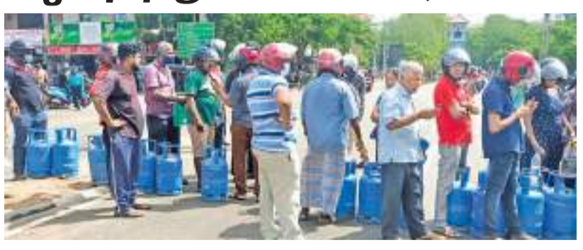
வவுனியா விசேட நிருபர்

வவுனியாவில் எரிவாயு கோரி ஏ 9 வீதியினை வழிமறித்து நேற்று (20.05) மக்கள் போராட்டத்தில் ஈடுபட்டமை யினால் அப்பாத்தையுடன போக்குவரத்து அரை மணித்தியாலம் வரை ஸ்தம்பிதமடைந்திருந்தது. வவுனியா மாவட்டத்தில் கடந்த இரு வாரங்களுக்கு மேலாக எரிவாயு இல்லாமையினால் மக்கள் பல்வேறு இன்னல்களுக்கு முகங்கொடுத்திருந்தனர். இந்நிலையில் நேற்று (20.05) காலை தொடக்கம் மாவட்டத்தில் இரு இடங்களில் எரிவாயு விநியோகம் மேற்கொள்ளப்பட்டுவந்ததுடன், வவுனியா பழைய பஸ் நிலையத்திற்கு முன்பாக வுள்ள எரிவாயு விநியோகஸ்தர் நிலை