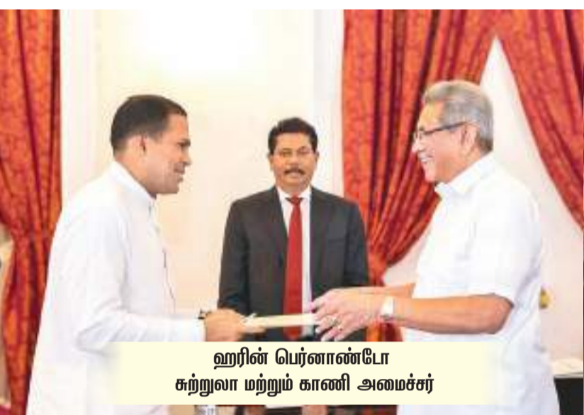
ஹரின் பெர்னாண்டோ சுற்றுலா மற்றும் காணி அமைச்சர்