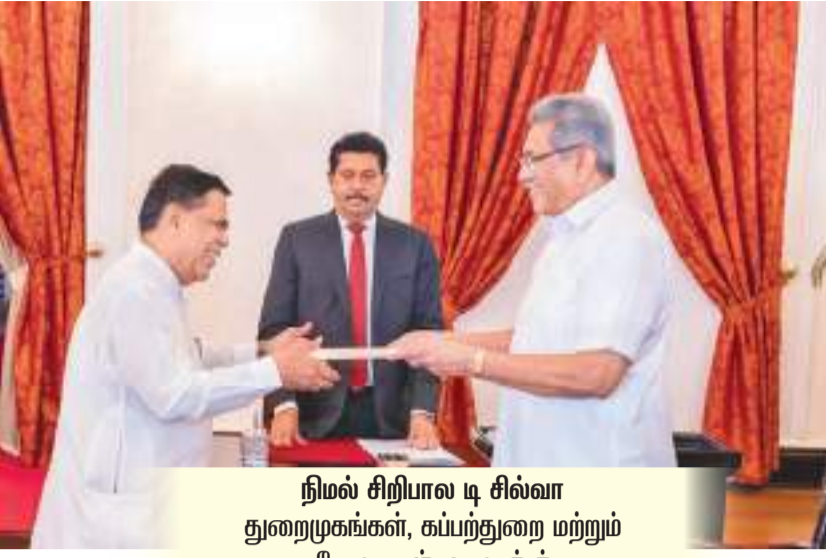
நிமல் சிறியால டி சில்வா துறைமுகங்கள், கப்பந்துறை மற்றும் சேவைகள் அமைச்சர்