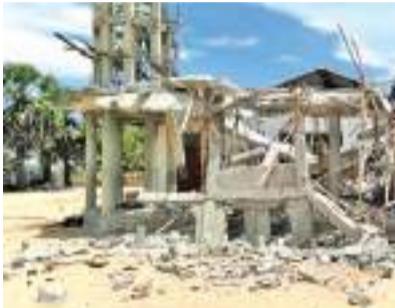
முல்லைத்தீவு தீத்தக்கரை பகுதியில் வீசிய கடும் காற்று காரணமாக தீத்தக்கரை வேளாங்கண்ணி மாதா கோயில் சேதமடைந்துள்ளது.

கடும் காற்று தீத்தக்கரை வேளாங்கண்ணி மாதா கோயில் சேதம் சேதமடைந்துள்ளது. முல்லைத்தீவு பொலிஸ் பிரிவுக்குட்பட்ட தீத்தக்கரை பகுதியில் வீசிய கடும் காற்று காரணமாக தீத்தக்கரை வேளாங்கண்ணி மாதா கோயில் சேதமடைந்துள்ளது. இப்பகுதியில் சற்று முன்னர் வீசிய கடும் காற்று காரணமாக கட்டுமான பணிகள் இடம்பெற்று வந்த தீத்தக்கரை வேளாங்கண்ணி மாதா கோயிலின் கட்டடத்தின் சில பகுதிகள் சேதமடைந்துள்ளன.