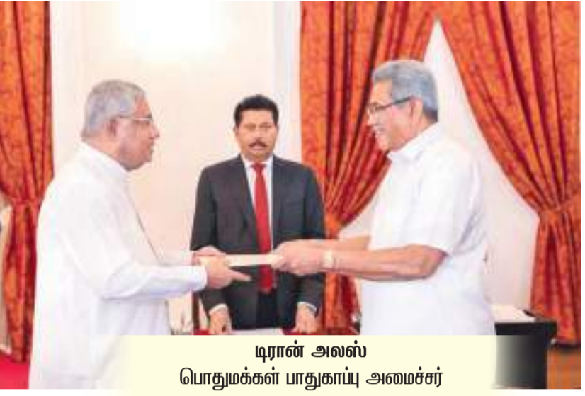
டிரான் அலஸ் பொதுமக்கள் பாதுகாப்பு அமைச்சர்