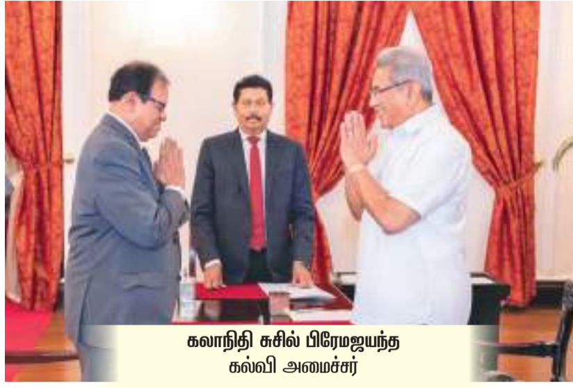
கலாநிதி சுசில் பிரேமஜயந்த கல்வி அமைச்சர்