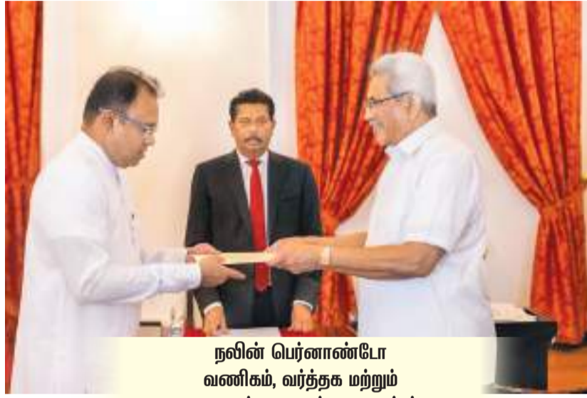
நரின் பெர்னாண்டோ வணிகம், வர்த்தக மற்றும் உணவுப் பாதுகாப்பு அமைச்சர்