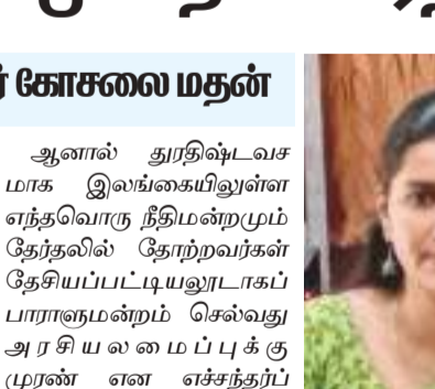
78 ஆண்டு அரசியலமைப்பு வழங்கியுள்ளது.

ஆனால் தூரதிஷ்டவசமாக இலங்கையிலுள்ள எந்தவொரு நீதிமன்றமும் தேர்தலில் தேற்றவர்கள் தேசியப்பட்டியலுடனாகப் பாராளுமன்றம் செல்வது அரசியலமைப்புக்கு முரணான எச்சத்தர்ப்பத்திலும் கூறவில்லை. இலங்கை அரசியல் அமைப்பு தொடர்பில் சில விடயங்களை பொருள்கோடல் மூலம் உணர்த்துவதற்கு நீதிமன்றங்கள் முனைந்தாலும் அவ்வளவு தூரம் நீதிமன்றங்களுக்கு சுயநீதம்தலைவர் என எல்லையற்ற அதிகாரம் உள்ள ஒரு தலைவராக காணப்படுகிறது. அவசரகாலச் சட்டத்தை பிரகடனப்படுத்தல், யுத்தத்தை பிரகடனம் செய்தல் ஆகியவற்றிற்கு யாரையும் கலந்து ஆலோசிக்காமல் ஜனாதிபதி முடிவெடுக்க கூடிய அதிகா