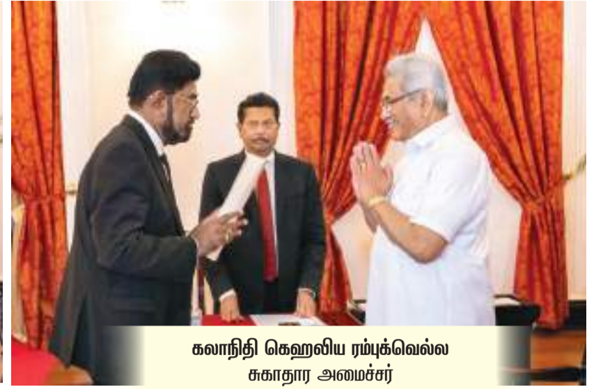
கலாநிதி கெஹலிய ரம்புக்வெல்ல சுகாதார அமைச்சர்