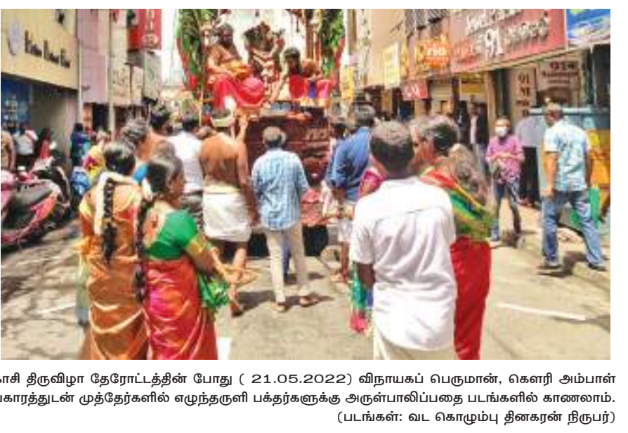
கொழும்பு 13, ஸ்ரீ கதிர்சேன் வீதி, ஸ்ரீ கதிர்வேலாயுத சுவாமி ஆலய வைகாசி திருவிழா தேரோட்டத்தின் போது ( 21.05.2022) விநாயகப் பெருமான், கௌரி அம்பாள் மற்றும் வள்ளி, தெய்வானை சமேத கதிர்வேலாயுத சுவாமிகள் சிறப்பு அலங்காரத்துடன் முத்தேர்களில் ஏழுந்தருளி பக்தர்களுக்கு அருள்பாலிப்பதை படங்களில் காணலாம்.