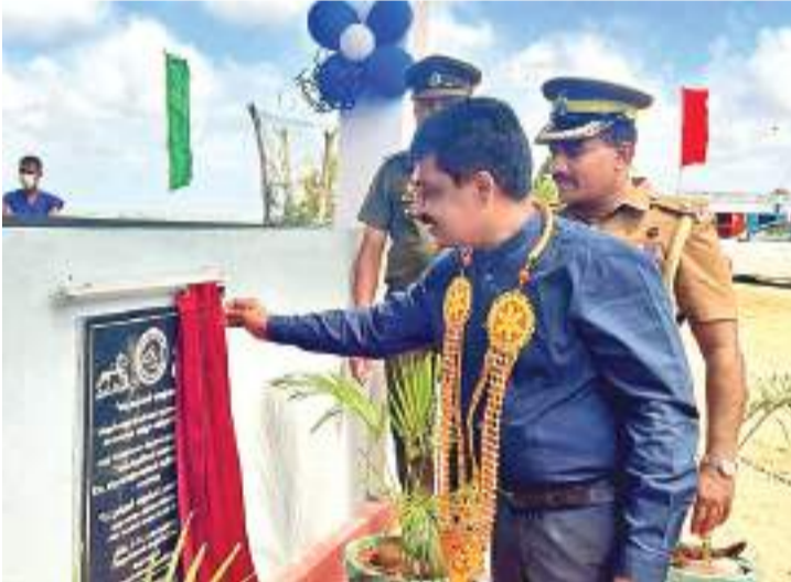
கொடைவள்ளல் S.K.T நாதனின் நிதிப்பங்களிப்பில் "சிறைக் கைதிகளும் மனிதர்களும்" எனும் தொனிப் பொருளில் யாழ்ப்பாண சிறைச்சாலையில் உள்ள தமது உறவுகளை பார்வையிட வரும் மக்களுக்கான வசதிகளை மேம்படுத்தும் நோக்கில் காத்திருப்போர் மண்டபம் ஒன்று கட்டி சனிக்கிழமை யாழ்ப்பாண சிறைச்சாலை முன்புலில் திறந்து வைக்கப்பட்டது.

அந்நிலையில் கடந்த 19 ஆம் திகதி மீண்டும் வயிற்றோட்டம் வாந்தி ஏற்பட்டு மாணவன் பாதிக்கப்பட்ட நிலையில், யாழ்ப்பாணம் போதனா மருத்துவமனையில் அனுமதிக்கப்பட்டார். அங்கு சிகிச்சை பயணித்திருந்த காலத்தில் கட்டைக்கிழமை உயிரிழந்துள்ளார்.