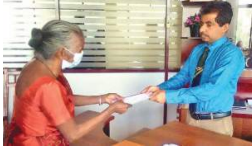
இந்த காப்புறுதியை "சொப்ரல்லோஜிக் இன்ஸூரன்ஸ் கம்பனி" வழங்குகிறது. தேசிய பாரம்பரியம், கலை நிகழ்ச்சிகள் மற்றும் கிராமிய கலை மற்றும்

தேசிய ம ரபுரிமை, கலைநிகழ்ச்சிகள் மற்றும் கிராமிய கலை மேம்பாட்டுக்கான அமைச்சின் அலுவலகங்களில், கலாசார அலுவலர்கள் திணைக்களத்தினால் பதுளை மாவட்டத்தில் கலைஞர்களுக்கு காப்புறுதி வழங்கும் நிகழ்வு பதுளை மாவட்ட செயலகத்தில் இடம்பெற்றது. பதுளை மாவட்ட கலாசாரப்பிரிவின் ஏற்பாட்டில் இந்த நிகழ்வு இடம்பெற்றது. பதுளை மாவட்டத்தில் 13 கலைஞர்களுக்கு காப்புறுதி பாதுகாப்பு வழங்கப்பட்டது. இதன்மூலம், ஒருவருக்கு தலா ரூ 20 லட்சம் காப்பீட்டுத் தொகை கிடைக்க உள்ளது. பிரதேச செயலகங்களிடாக விண்ணப்பங்கள் கோரப்பட்டு தெரிவு செய்யப்பட்ட கலைஞர்களுக்கு காப்புறுதிச் சலுகைகள் வழங்கப்படும்.