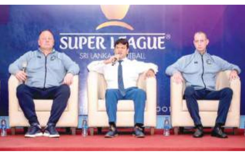
பாய்ச்சனில் பல கூறுகளை இந்தத் திட்டம் கொண்டிருக்கும். போட்டி கட்டமைப்பில் சீர்திருத்தங்கள், அதிசிறப்பு பயிற்சிக் கல்வி மற்றும் ஆலோசனை, அடிமட்ட மற்றும் இளையோருக்கான உறுதியான கால்பந்தாட்ட கட்டமைப்பை ஸ்தாபித்தல், மிகச் சிறந்த வீரர்களுக்கு வெளிநாட்டு வீக் போட்டிகளில்