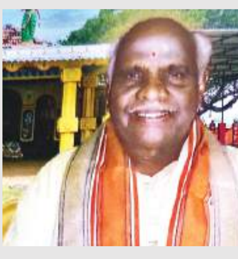
கராக (தலைவர்) தெரிவு செய்யப்பட்ட அவர், சுமார் இருபது வருட காலம் வண்ணக்கராகவி ருந்து தொடர் பணிகளை துலங்க வைத்தார்.