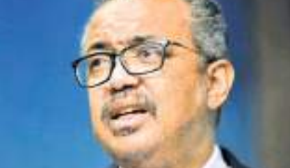
களுக்கு பதிலளித்து உலக சுகாதார அமைப்பை டெட்ரோஸ் திறம்பட வழிநடத்தினார். உக்ரைன் நிலைமையைப் பற்றி பேசியபோது கண்கலங்கினார் டொக்டர் டெட்ரோஸ். 50 ஆண்டு களுக்கு முன்னர் போருக்கும் வறுமைக்கும் இடையில் தமது தம்பி சிறுவயதில் இறந்துபோனதை அவர் நினைவுகூர்ந்தார்.

டொக்டர் டெட்ரோஸ் கேப்ரியேசஸ் உலக சுகாதார அமைப்பின் தலைமை பணியாளராக மீண்டும் தேர்வுபெற்றுள்ளார். அவர் மேலும் 5 ஆண்டுகளுக்கு அந்தப் பொறுப்பில் இருப்பார். மொத்தமிருந்த 160 வாக்குகளில் டொக்டர் டெட்ரோஸுக்கு ஆதரவாக 155 வாக்குகள் கிடைத்தன. எனினும் அவருக்கு எதிராக எவரும் போட்டியிடவில்லை. மீண்டும் தேர்வுபெற்ற பின்னர் பேசிய அவர், நெருக்கடிக்காலத் தயார்நிலை, நிறுவனத்தின் மேம்பாடு ஆகியவற்றில் உலக சுகாதார அமைப்பு கூடுதல் கவனம் செலுத்தும் என்றார். கொரோனா வைரஸ் தொற்றின் போது பல்வேறு சிரமங்களுக்கு மத்தியில் உலக நாடுகளின் கேள்வி