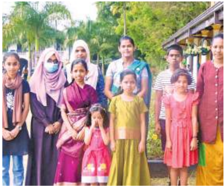
தேசிய நூலக போட்டியின் மூன்றாம் கட்டமாகான போட்டிக்கு தெரிவான அக்குறண பிரதேச போட்டியாளர்களை பாராட்டுவதை வாயவம் அக்குறணை பிரதேச செயலக கேட்போர் கூடத்தில் இடம்பெற்றது.

தலவாக்கலை ட்ராப் தோட்டத்தில் நேற்று முன்தினம் (24) சிறுத்தையொன்று உயிரிழந்த நிலையில் மீட்கப்பட்டுள்ளதாக தலவாக்கலை பொலிஸார் தெரிவித்தனர். மூன்று மாதங்களான நான்கு அடி நீளமும், இரண்டு அடி உயரமும் கொண்ட சிறுத்தையே இவ்வாறு உயிரிழந்த நிலையில் மீட்கப்பட்டது. அதன் உடலில் எந்தவிதமான காயங்களும் காணப்படவில்லை. உயிரிழந்த சிறுத்தையின் உடல் நுவரெலியா நீதிமன்றத்தில் சமர்ப்பிக்கப்பட்ட பின்னரே இவ்வாறு தெரிவிக்கப்பட்டது. மரண பரிசோதனைகளுக்காக இரத்தனிகலை மிருக வைத்தியசாலைக்கு கொண்டு செல்லப்பட்டதாக வனஜிவிராகிகள் திணைக்கள அதிகாரிகள் தெரிவித்தனர்.