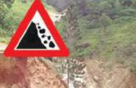
போதிலும் அவற்றில் குடியேறாமல் பாதுகாப்பற்ற இடங்களில் வாழ்வதாகவும் அவர் தெரிவித்தார்.

இரத்தினபுரி மாவட்ட அனர்த்த முகாமைத்துவ மத்திய நிலையத்தின் அதிகாரி ஒருவர் தெரிவிக்கையில், மண்சரிவு அபாயம் உள்ள இந்த இடத்திலிருந்து வீட்டு உரிமையாளர்களுக்கு பலமுறை வெளியேறுமாறு அறிவுறுத்தல் வழங்கப்பட்ட போதிலும் அவர்கள் வெளியேறவில்லை. இங்கும் பங்களுக்கு பாதுகாப்பான இடங்களில் காணிகள் வழங்கப்பட்டுள்ள