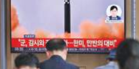
பம் தொடக்கம் தொடர்ச்சியான ஏவுகணை சோதனைகளை நடத்தி வருகிறது. சுமார் ஐந்தாண்டுக்குப் பின்னர் வட கொரியா அதன் முதல் நிலத்தடி அணுவாயுதச் சோதனையை நடத்தத் தயாராகி இருப்பதாக அமெரிக்க இராணுவமும் உளவு அமைப்புகளும் கூறியுள்ளமை குறிப்பிடத்தக்கது.

வட கொரியா நேற்று புதன்கிழமை காலை மூன்று பலிஸ்டிக் ஏவுகணைகளை சோதனை செய்திருப்பதாக தென் கொரிய இராணுவம் தெரிவித்துள்ளது. பிரியாங்கியல் கண்காணிப்புகளில் இருந்து ஒரு மணி நேரத்திற்குள் இந்த ஏவுகணைகள் ஒன்றன் பின் ஒன்றாக வானில் ஏவப்பட்டதாக தென் கொரிய நிர்வாகம் குறிப்பிட்டுள்ளது. வட கொரிய ஜனாதிபதி ஜோ பைடன் பிராந்தியத்திற்கு சுற்றுப்பயணம் மேற்கொண்டு திரும்பிய ஒரு நாளைப் பின்னரே இந்த ஏவுகணை சோதனை இடம்பெற்றுள்ளமை குறிப்பிடத்தக்கது. வட கொரியா இந்த ஆண்டு ஆரம்