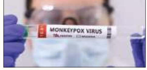
மற்றும் அமெரிக்காவில் கண்டுபிடிக்கப்பட்டுள்ளது. காய்ச்சல், சொறி உட்பட நோய் அறிகுறிகளைக் கொண்ட இந்த வைரஸ் வழக்கமாக மிதமான பாதிப்பை கொண்டுள்ளது. இந்நிலையில் மேற்கு ஆபிரிக்காவில் இருந்து வந்த ஒருவரிடமே இந்த தொற்று கண்டுபிடிக்கப்பட்டிருப்பதாகவும் அவருக்கு மருத்துவ சிகிச்சை அளிக்கப்படுவதாகவும் ஐக்கிய அரபு இராச்சி சுகாதார அதிகாரிகள் தெரிவித்துள்ளனர்.

முதல் வளைகுடா நாடாக ஐக்கிய அரபு இராச்சியத்தில் குரங்கம்மை சம்பவம் ஒன்று பதிவாகியுள்ளது. செக் குடியரசு மற்றும் ஸ்லோவெனியாவிலும் முதல் முறை கடந்த செவ்வாயன்று இந்த வைரஸ் பரவியுள்ளது. இதன்மூலம் வழக்கமாக ஆபிரிக்காவில் பரவக்கூடிய இந்த வைரஸ் கண்டுபிடிக்கப்பட்ட நாடுகளின் எண்ணிக்கை 18 ஆக உயர்ந்துள்ளது. இந்த எண்ணிக்கை மேலும் அதிகரிக்கும் என்று எதிர்பார்க்கப்படுகின்றபோதும், பொதுமக்களிடையே இதனால் ஏற்படும் அச்சுறுத்தல் மிதமாக இருப்பதாக நிபுணர்கள் தெரிவித்துள்ளனர். குரங்கம்மை நோய் தற்போது ஐரோப்பா, அவுஸ்திரேலியா