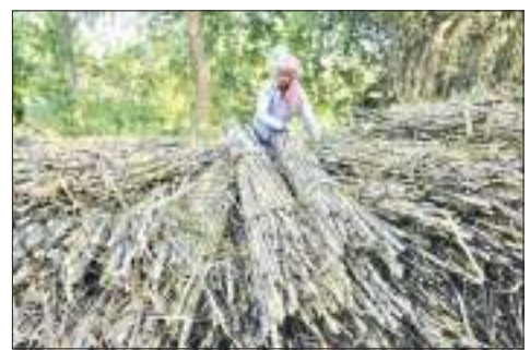
நான்காம் காலாண்டில் இந்தியாவின் உள்நாட்டுப் பயன்பாட்டுக்கு 6 மில்லியன் தொன் சீனி இருக்கும். அது நாட்டின் தேவைகளைப் பூர்த்தி செய்யப் போதுமானது என்ற கூறப்பட்டது. உலகின் மிகப்பெரிய சீனி உற்பத்தி நாடாக இந்தியா உள்ளது. பிரேசிலுக்கு அடுத்தபடியாக மிகப்பெரிய சீனி ஏற்றுமதி நாடாகவும் அது உள்ளது.

கோதுமையை தொடர்ந்து சீனி ஏற்றுமதியையும் கட்டுப்படுத்த இந்தியா திட்டமிட்டுள்ளது. உள்நாட்டு அளவில் விலை அதிகரிப்பைத் தடுப்பதற்காக அந்நடவடிக்கை எடுக்கப்படுவதாக அரசாங்க அதிகாரி ஒருவர் ரோய்ட்டர்ஸ் செய்தி நிறுவனத்திற்கு கூறியுள்ளார். இந்தியா 10 மில்லியன் தொன் சீனி ஏற்றுமதி செய்யத் திட்டமிட்டுள்ளது. இதற்கு முன்னர் ஏற்றுமதிக்கான 8 மில்லியன் தொன் ஐந்து கட்டுப்படுத்த அந்நாடு எண்ணியது. இருப்பினும் உள்நாட்டில் கூடுதல் சீனி உற்பத்தி செய்யப்படும் என்று கணிக்கப்பட்டதால் உலக நாடுகளுக்குச் சற்று அதிகமான சீனி ஒதுக்கப்பட்டதாகக் கூறப்பட்டது. இந்நிலையில், இவ்வாண்டின்